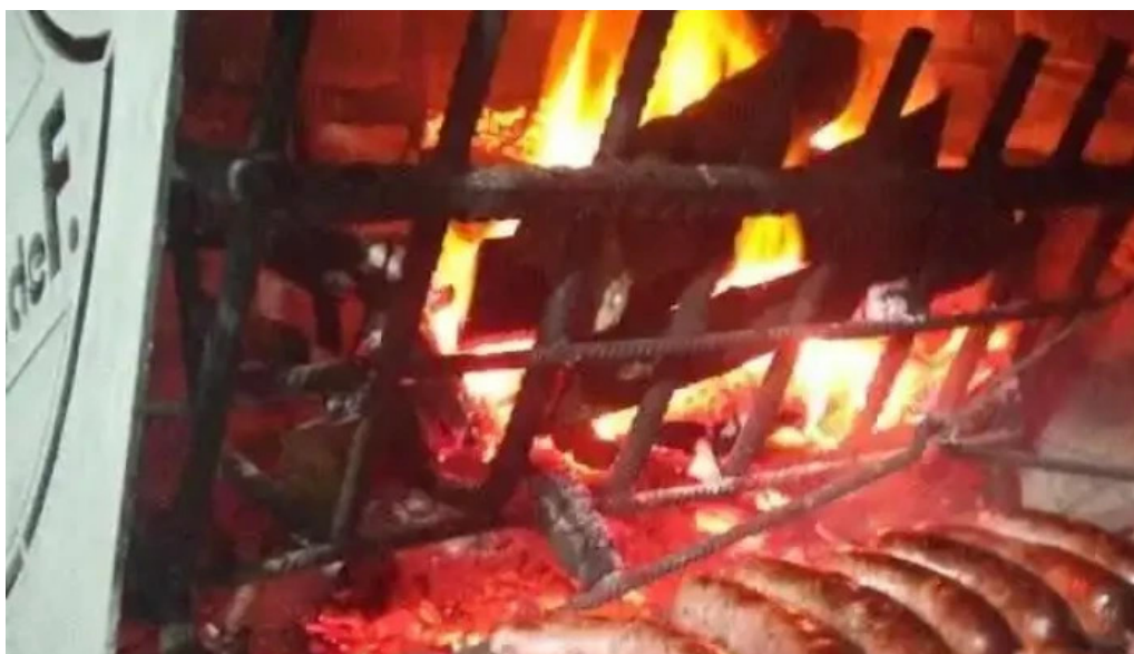
La carmela montevideo