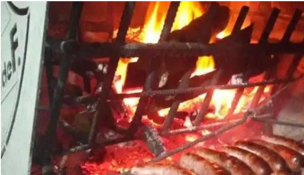
La carmela del propietario