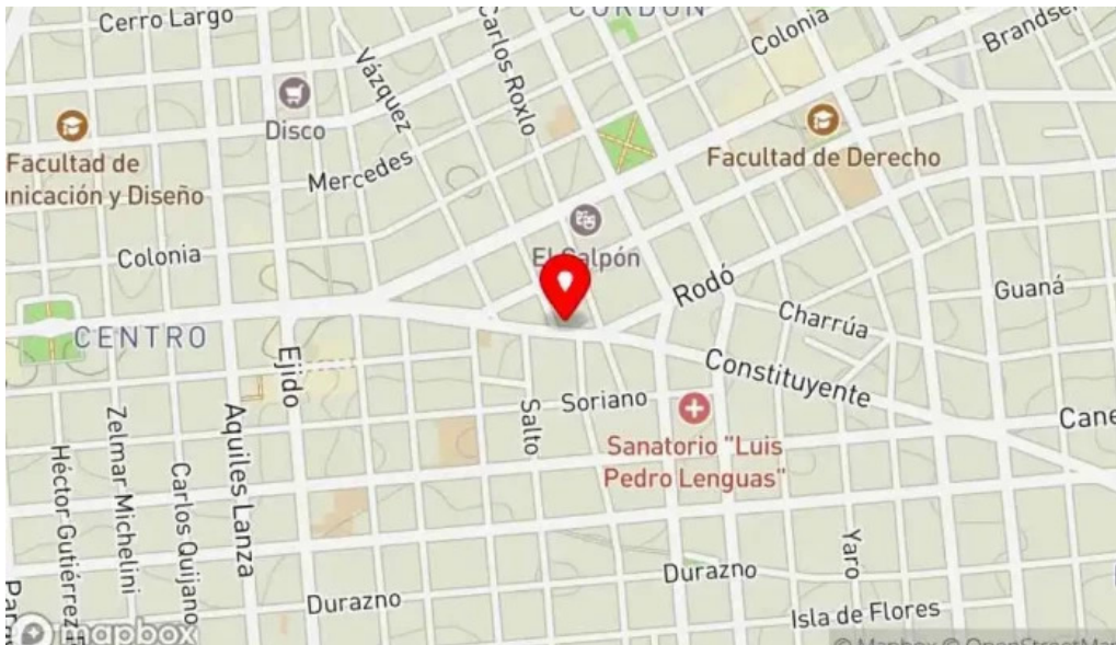
Brassas uy mapa