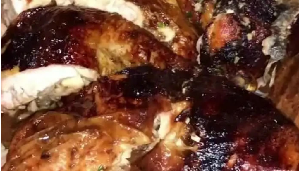
Brassas uy videos