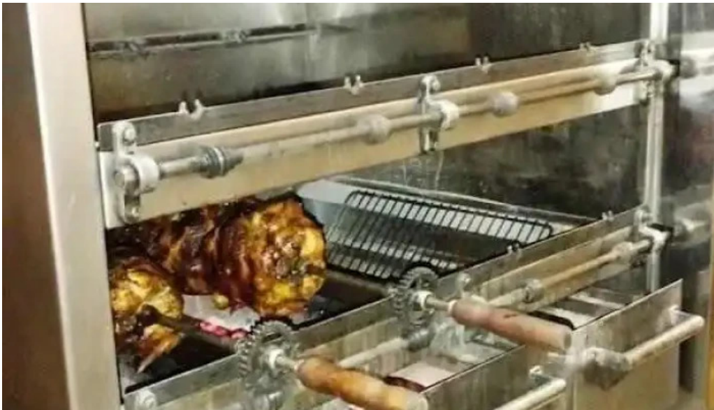
Brassas uy todas