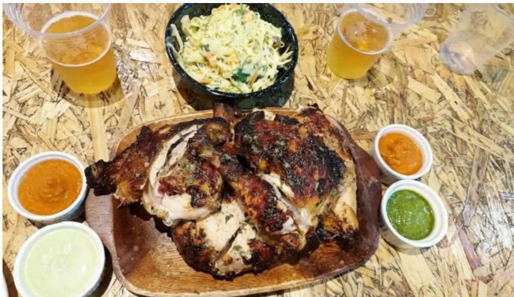
Brassas uy comida y bebida