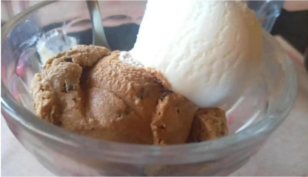
Ch parrilla con historia helado