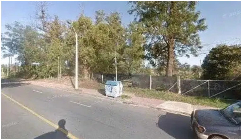
Ch parrilla con historia street view y 360