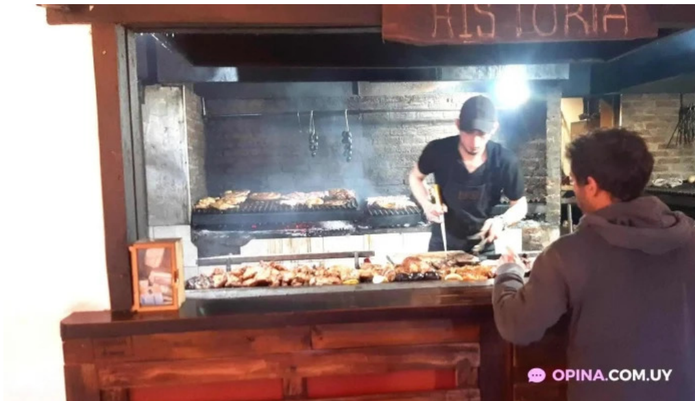
Ch parrilla con historia ambiente