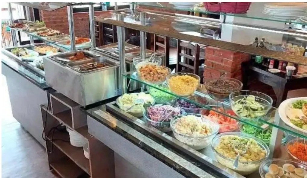
Ch parrilla con historia bufe de ensaladas