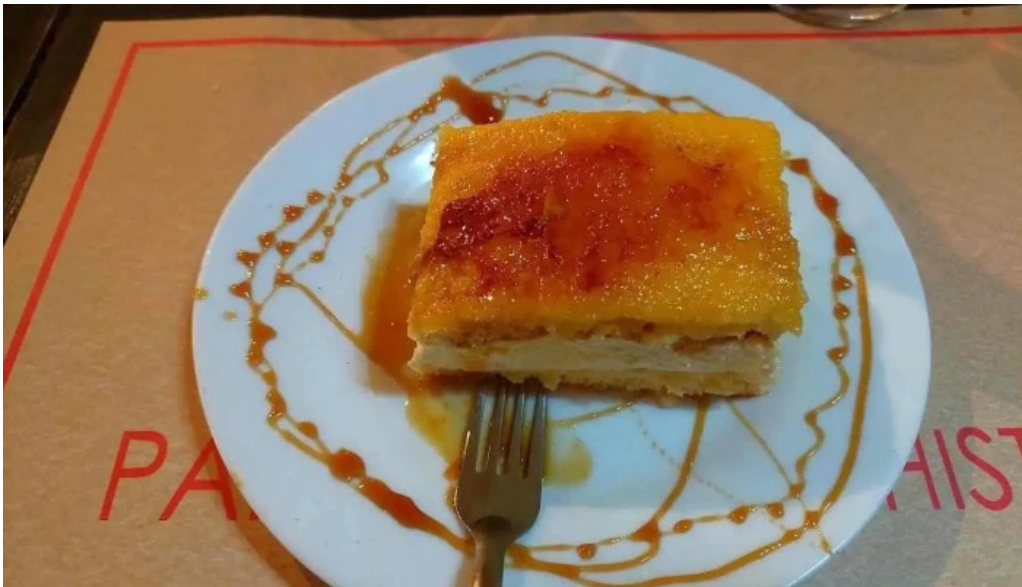
Ch parrilla con historia flan