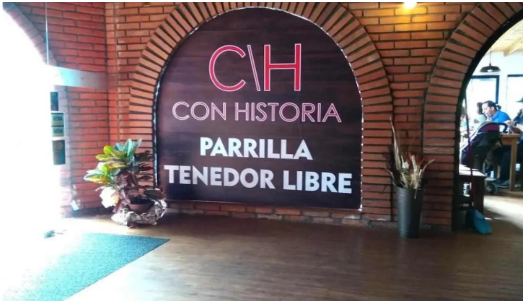
Ch parrilla con historia todas