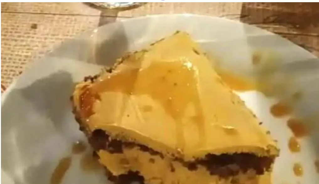
Ch parrilla con historia videos