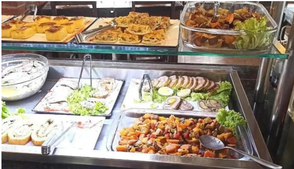
Ch parrilla con historia comida y bebida