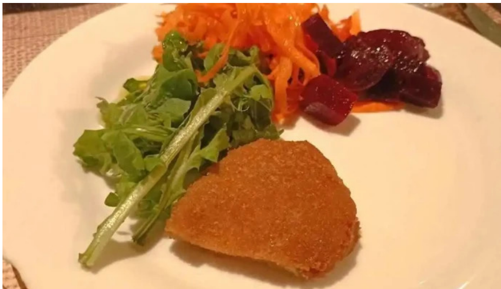
Ch parrilla con historia mas recientes