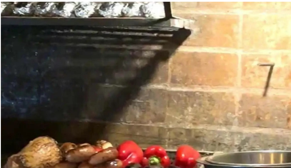
Lucien parrilla videos