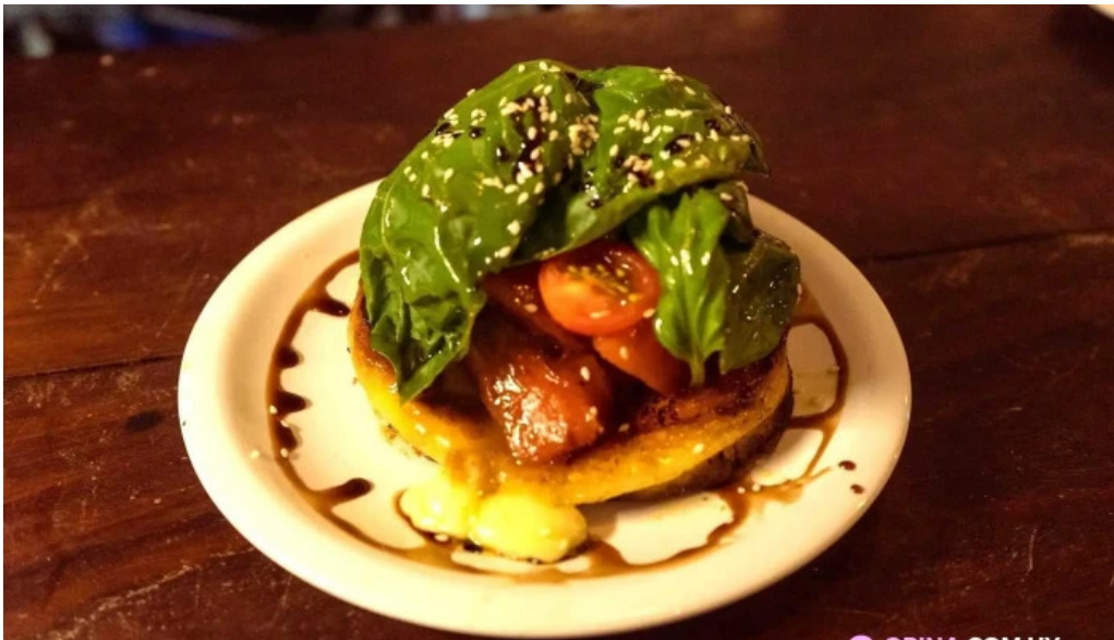
Lucien parrilla comidas y bebidas