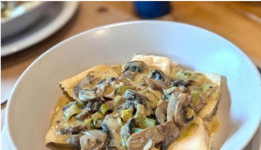
Lucien parrilla recientes