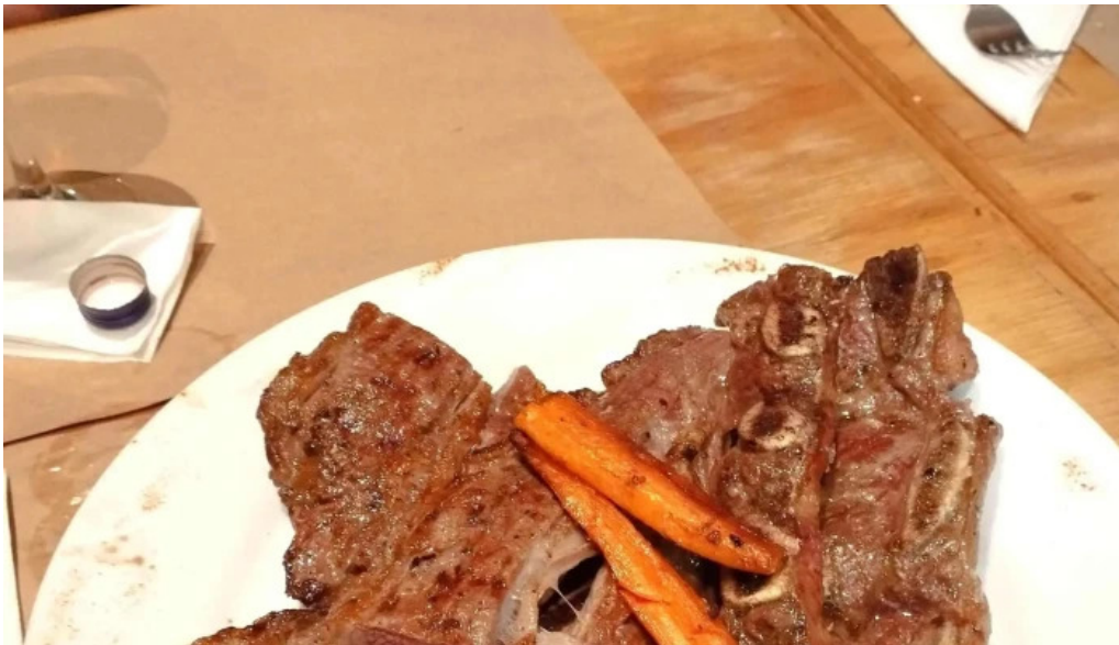
Lucien parrilla comentario 2