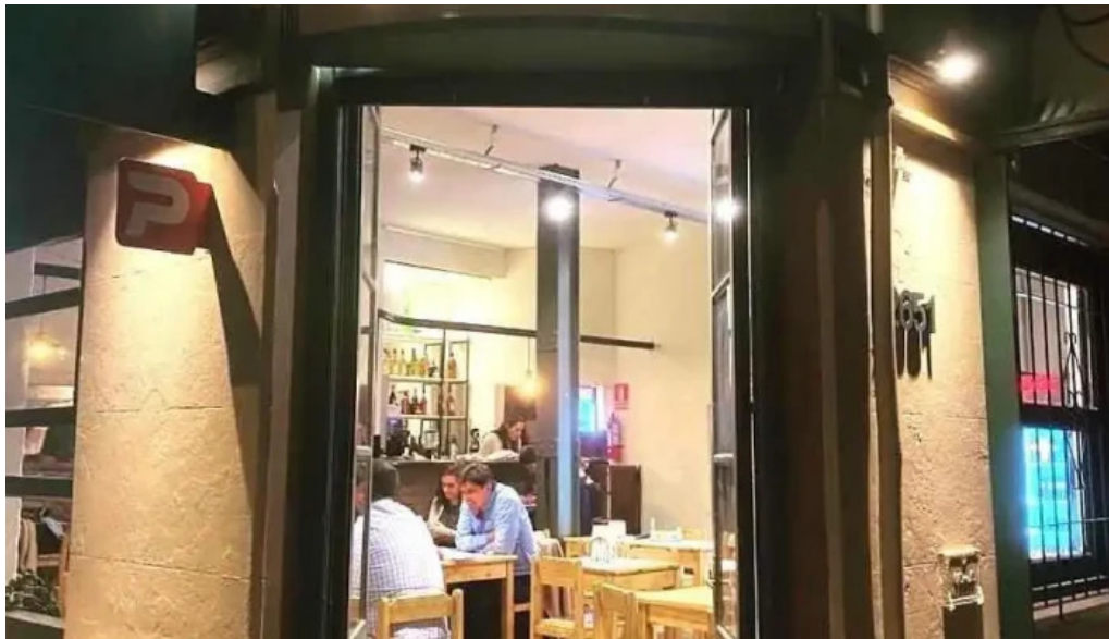
Lucien parrilla montevideo