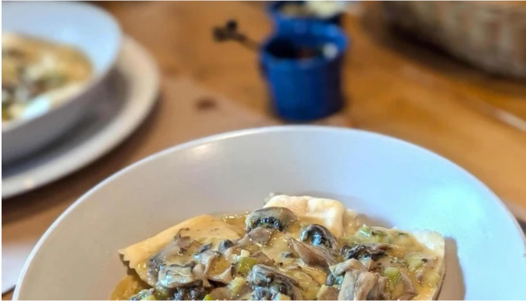
Lucien parrilla comentario 6