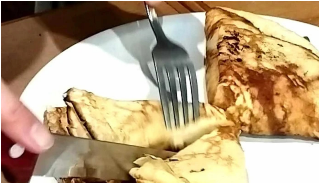
Lucien parrilla comentario 1