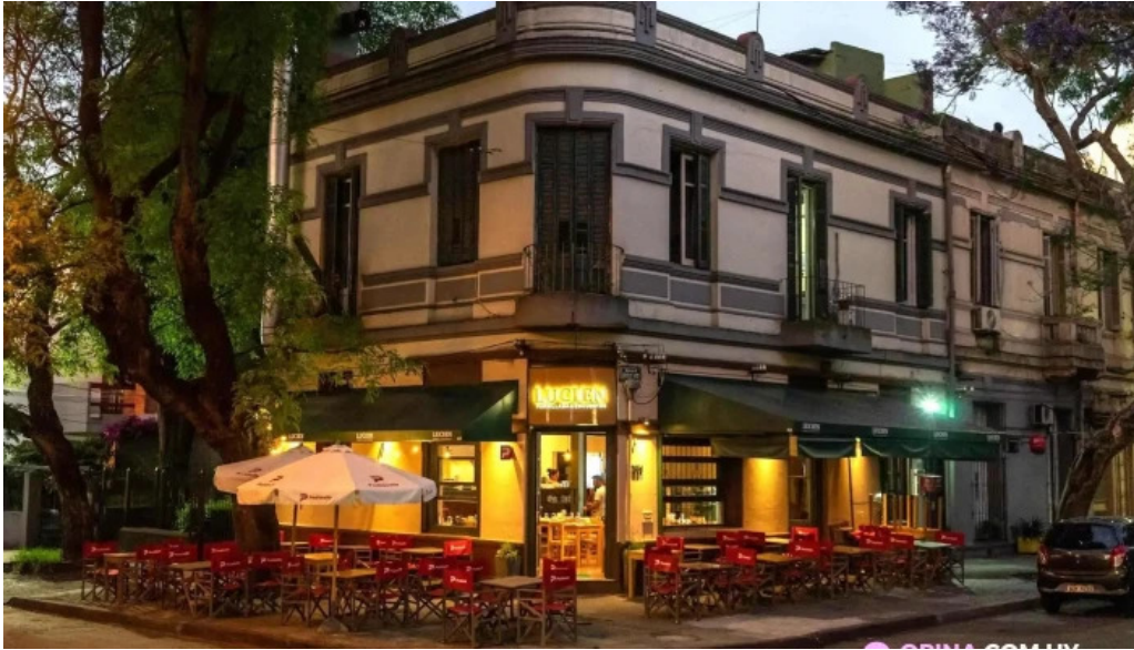
Lucien parrilla del propietario