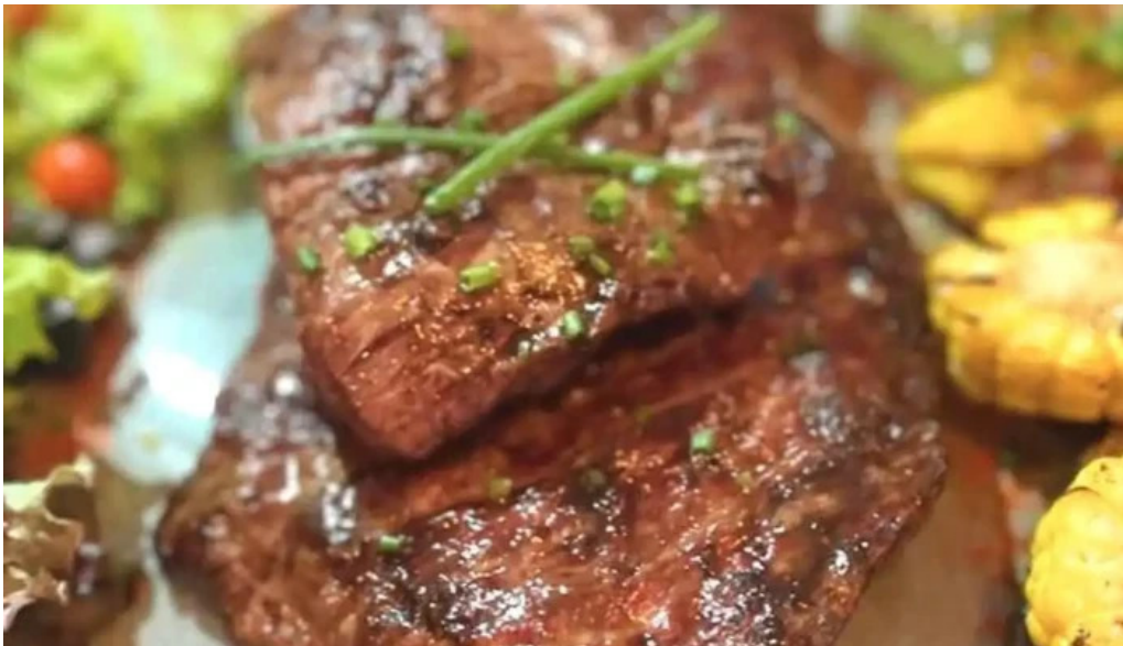
Lucien parrilla filete