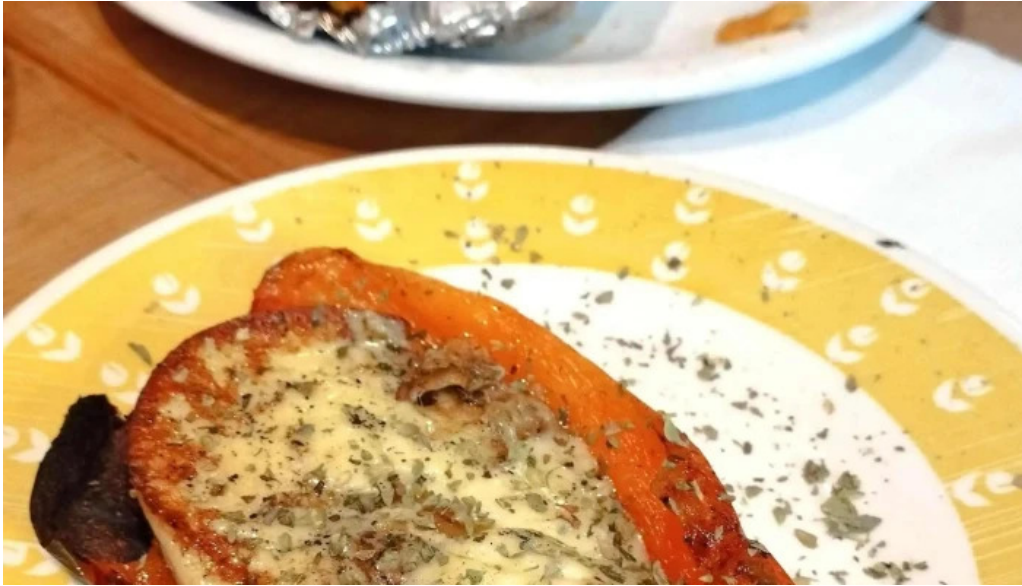
Lucien parrilla comentario 4