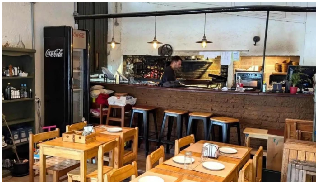
Lucien parrilla ambiente