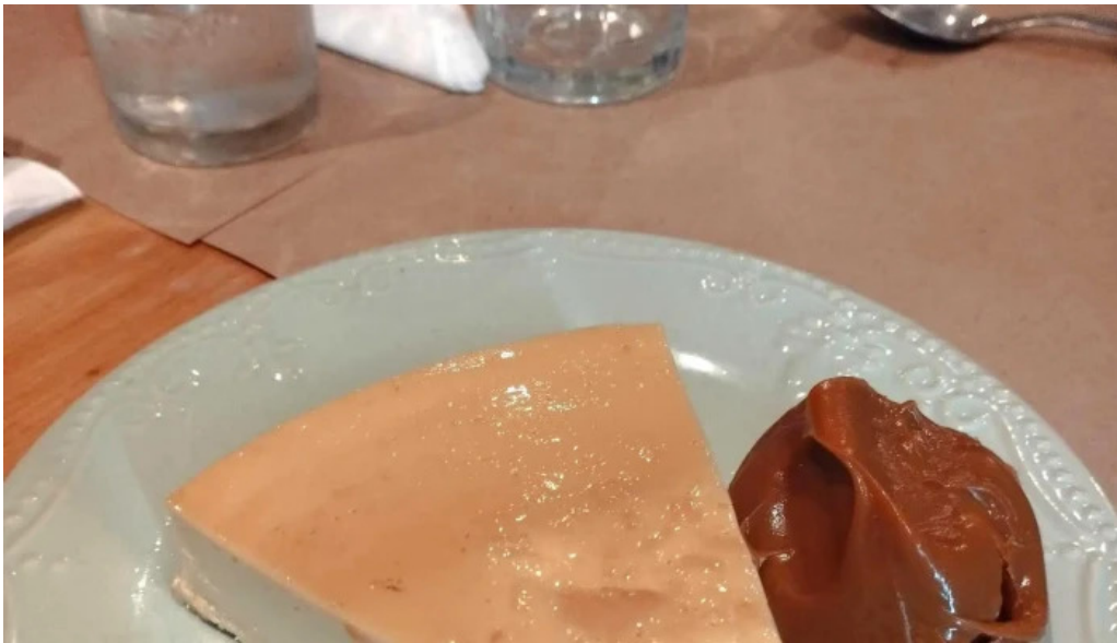
Lucien parrilla comentario 3