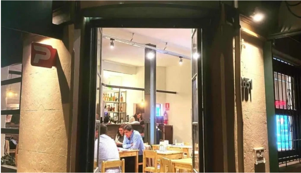
Lucien parrilla todo