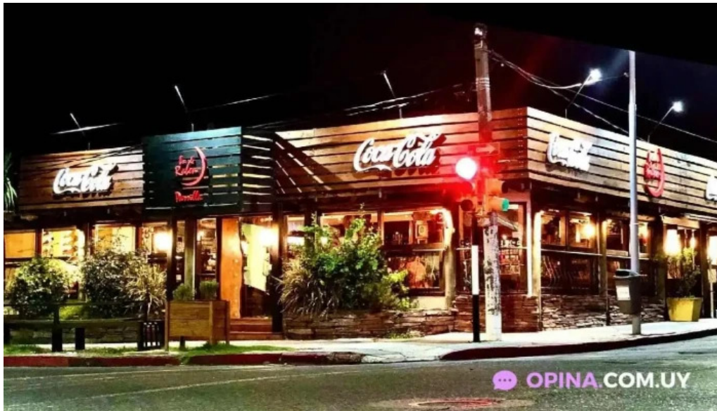
Lo de ruben todas