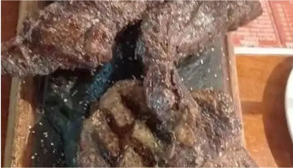
Lo de ruben mas recientes