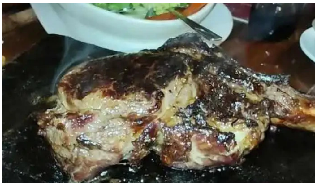
Lo de ruben videos