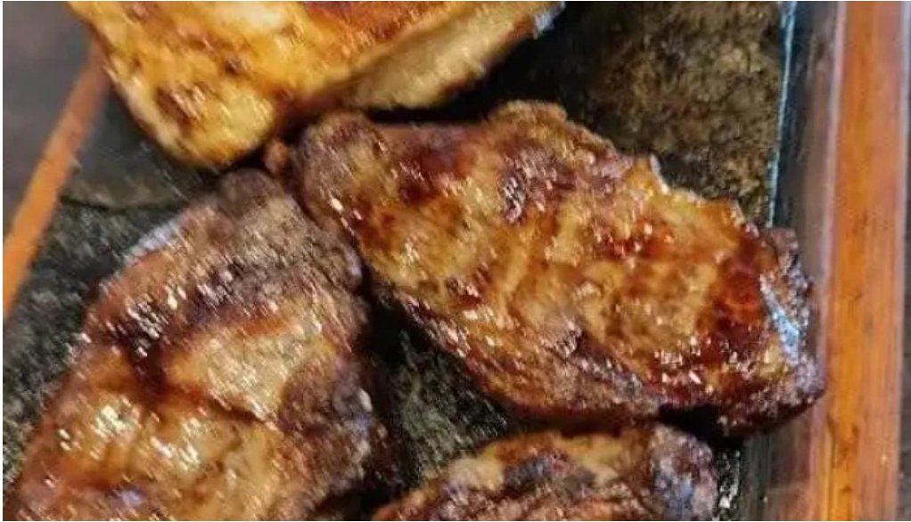
Lo de ruben churrasco