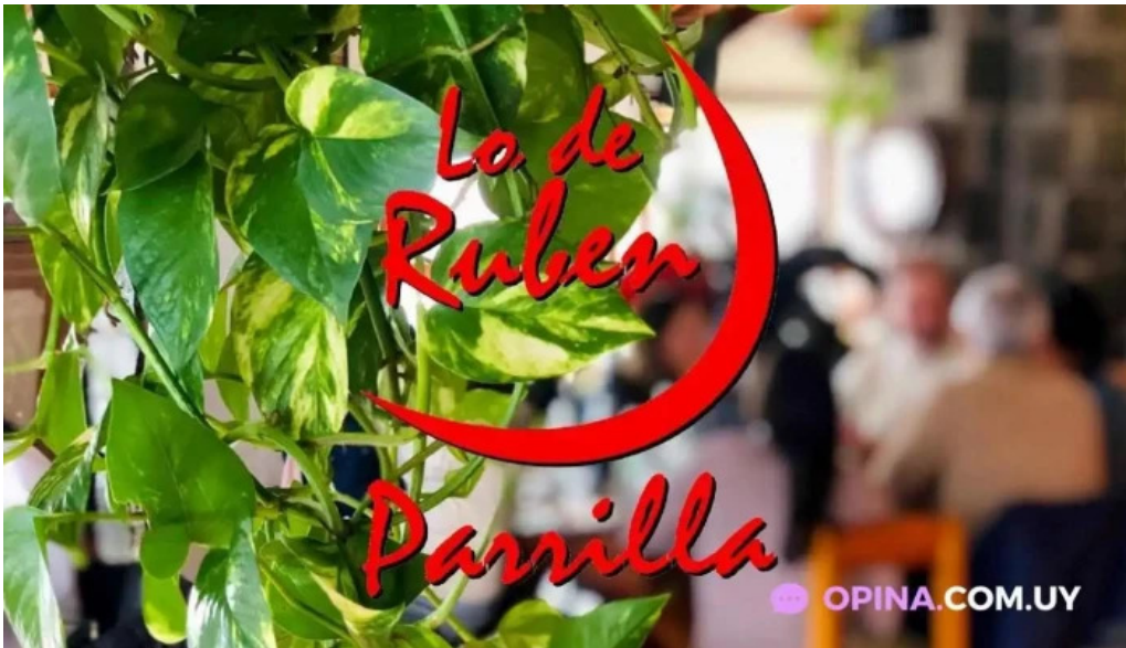
Lo de ruben comida y bebida