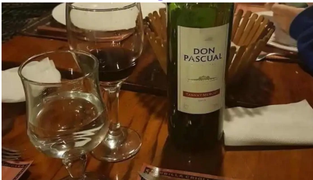
Lo de ruben vino