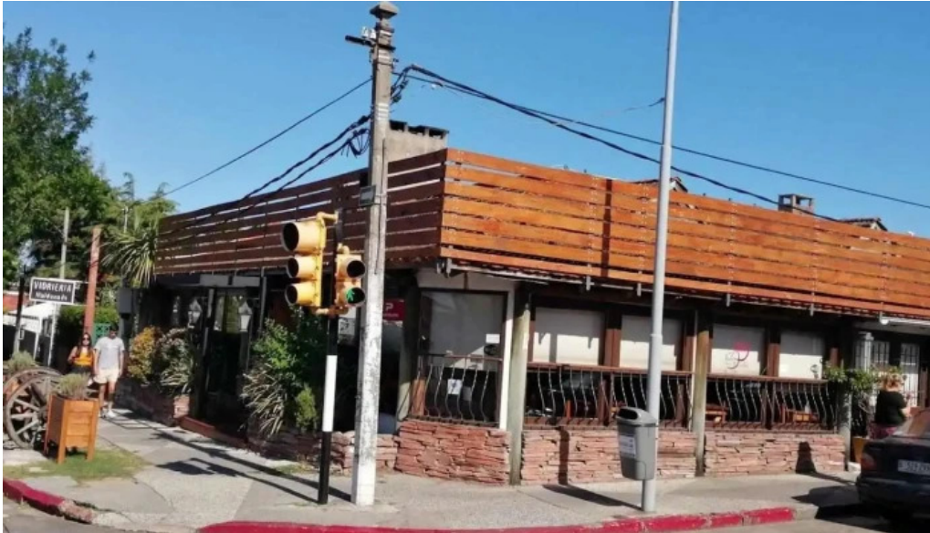
Lo de ruben del propietario