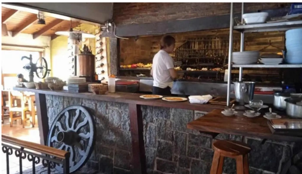
Lo de ruben ambiente