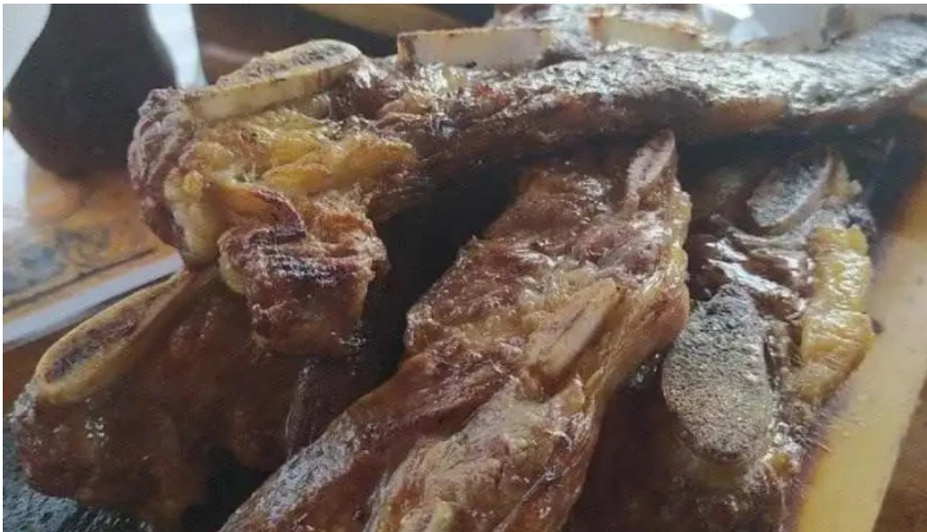
Lo de ruben asado de tira