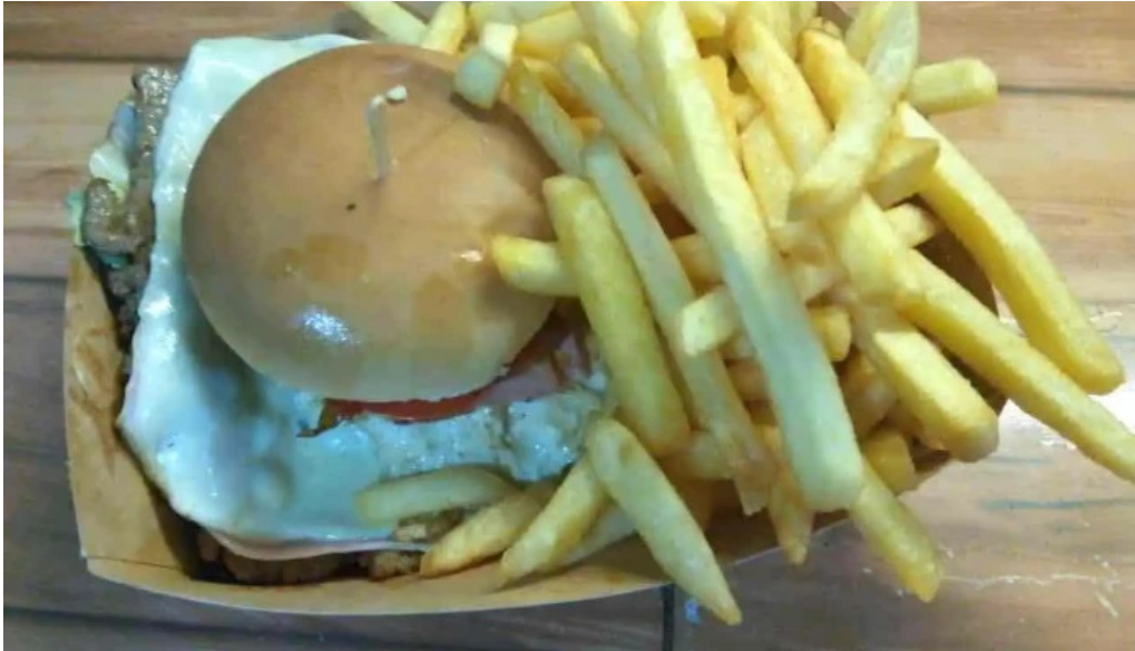
Lo de raquel ciudad de la costa