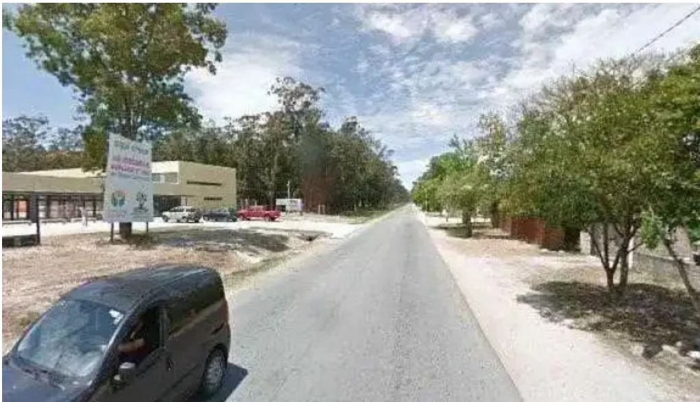
Lo de raquel street view y 360