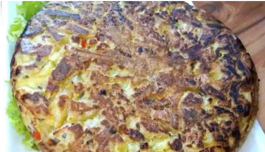
Lo de raquel comida y bebida