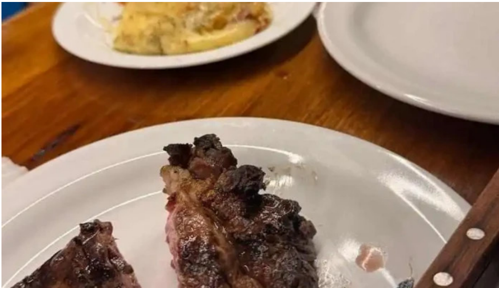
La pulperia filete