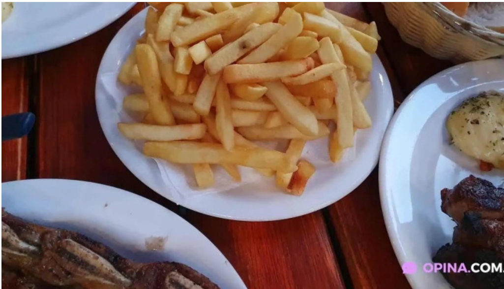
La pulperia papas fritas