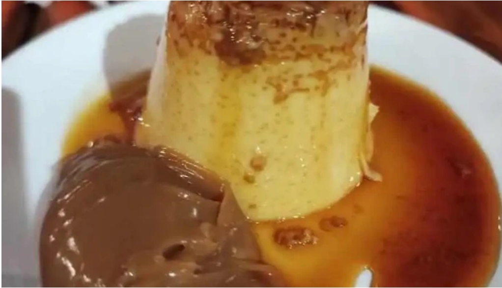
La pulperia flan