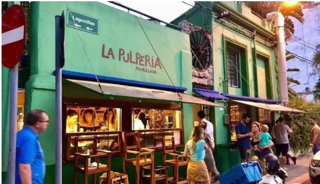
La pulperia montevideo