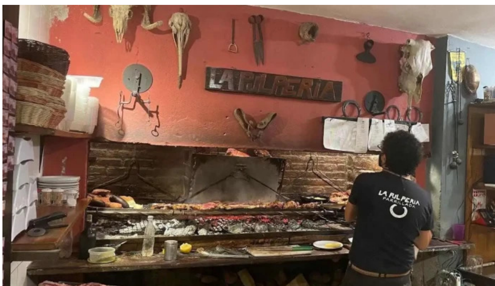
La pulperia ambiente