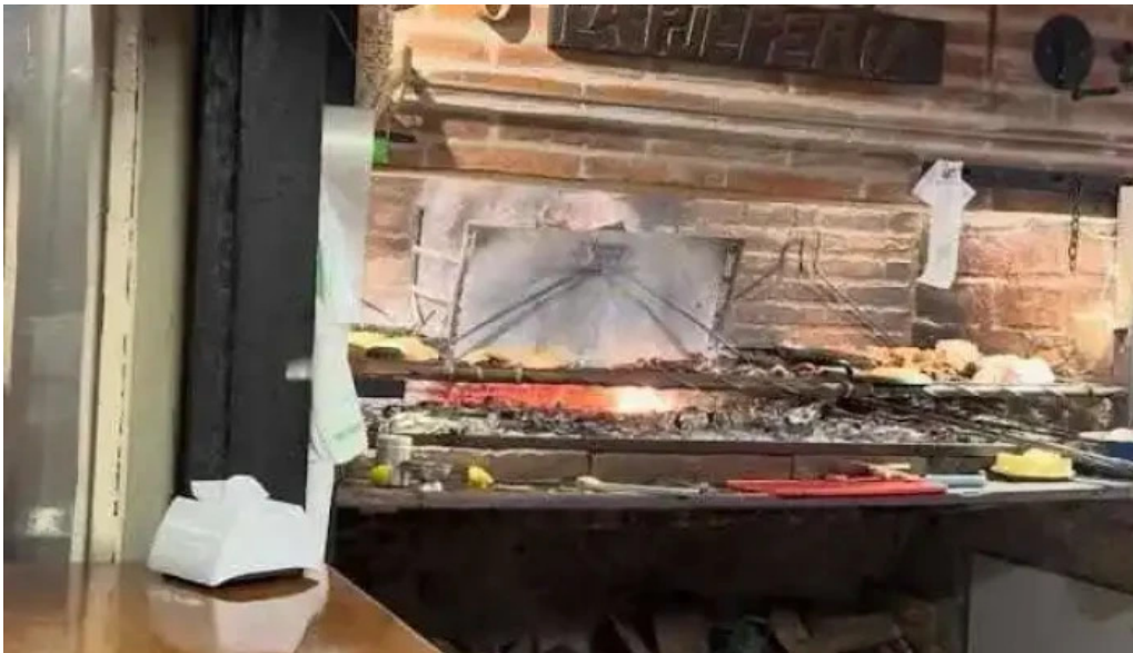
La pulperia mas recientes