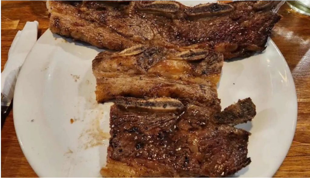
La pulperia churrasco