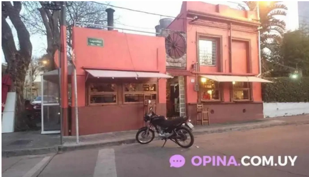
La pulperia del propietario