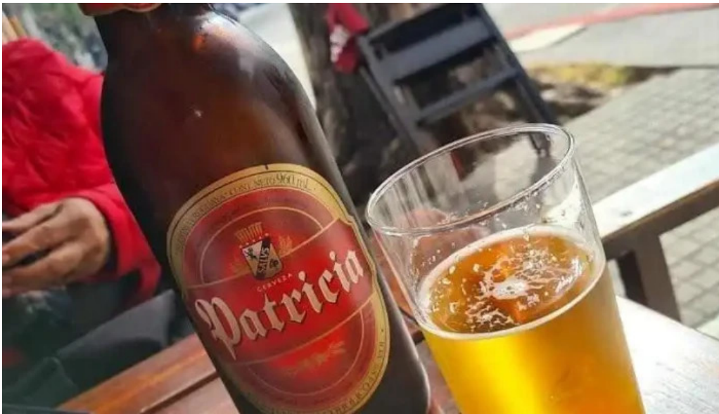
La pulperia cerveza