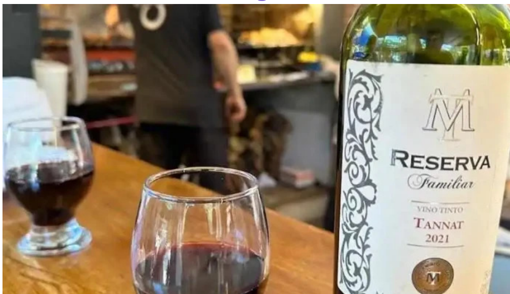
La pulperia vino