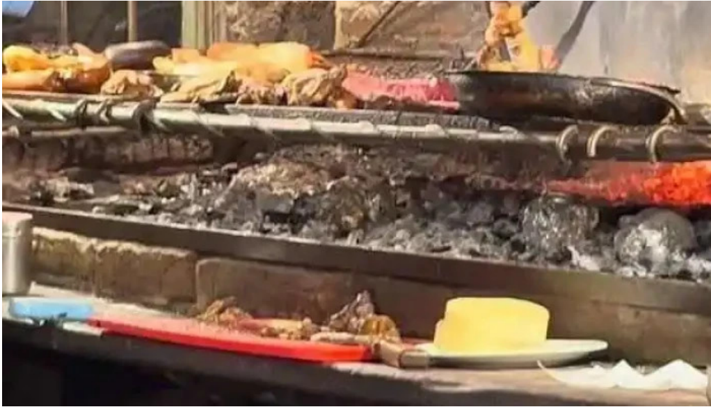
La pulperia videos