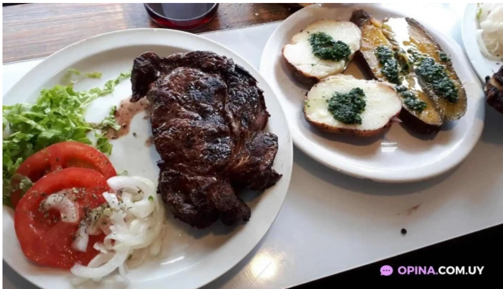
La pulperia comida y bebida