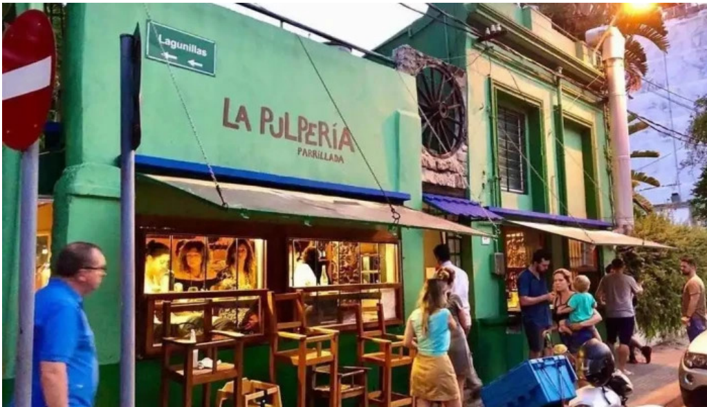
La pulperia todas