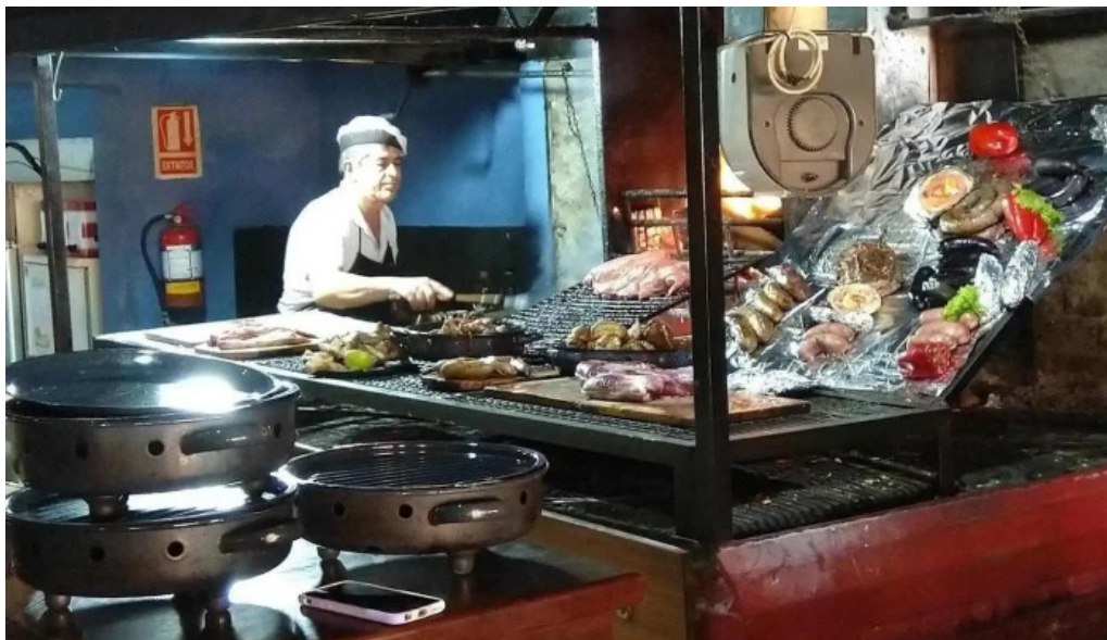
La parrilla comida y bebida