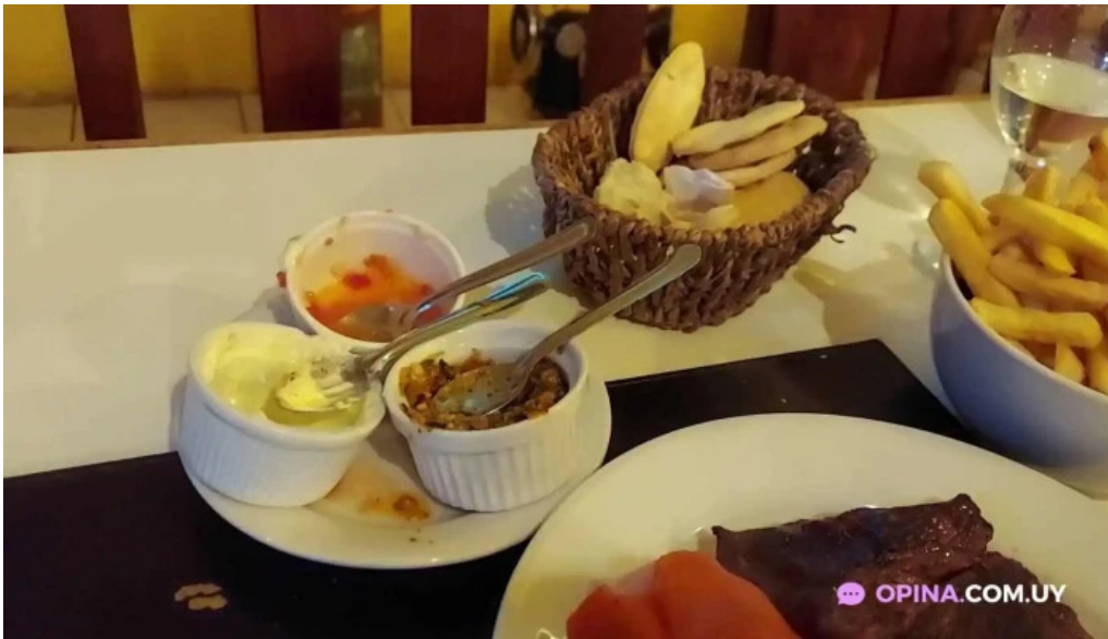
La parrilla videos