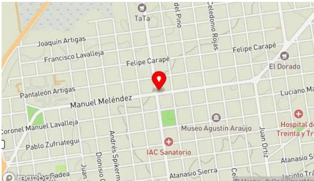
La parrilla mapa