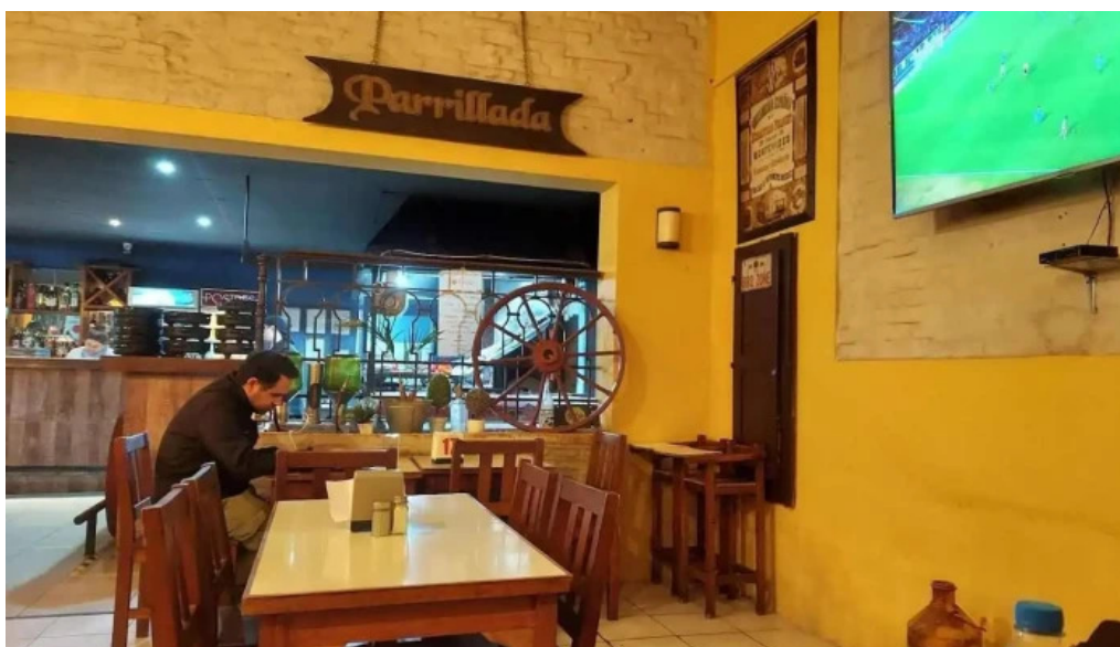
La parrilla ambiente