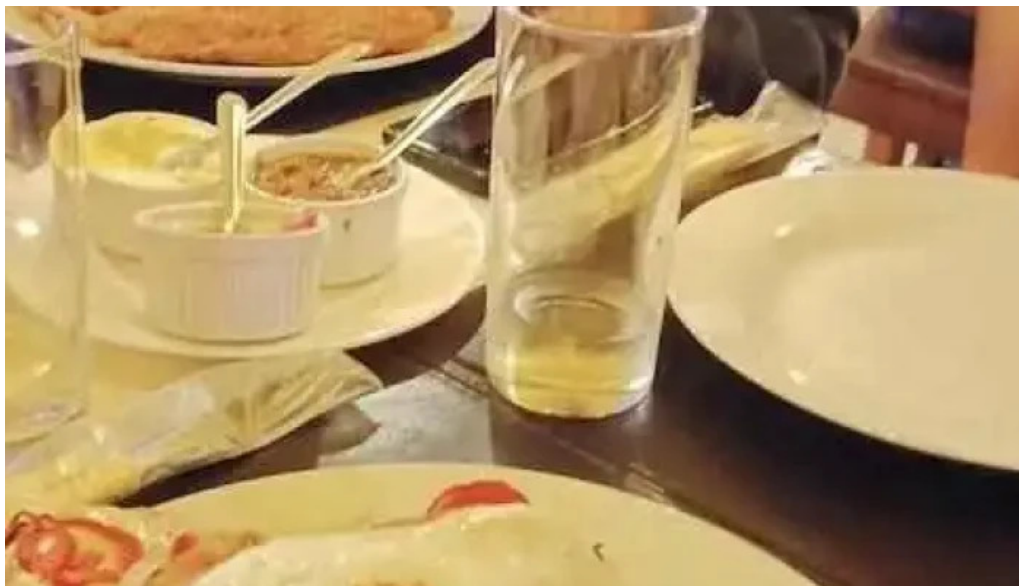
La parrilla mas recientes