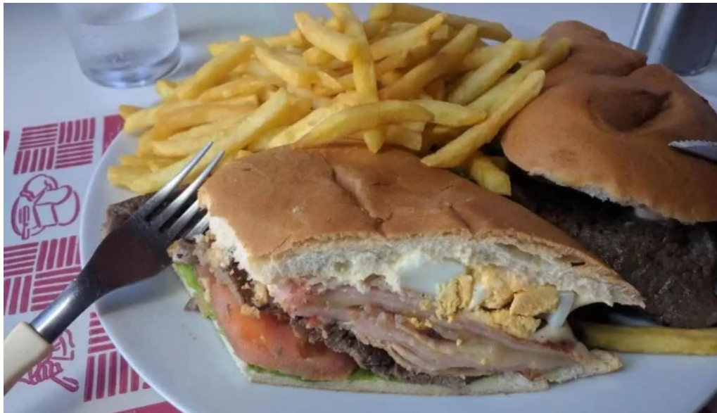
La parrilla sandwich cubano