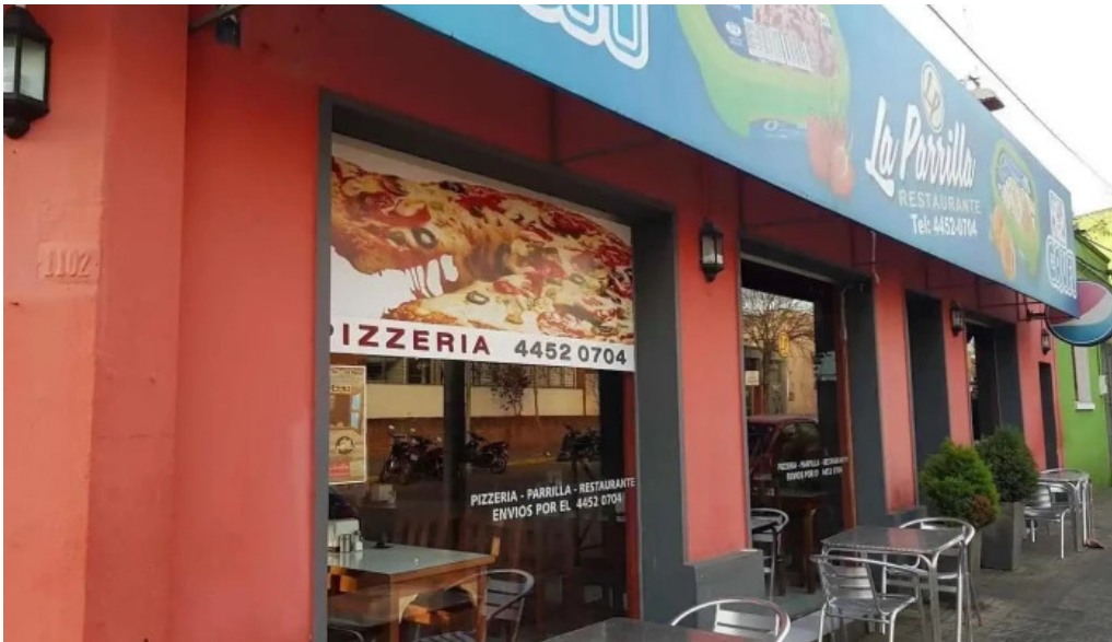
La parrilla treinta y tres