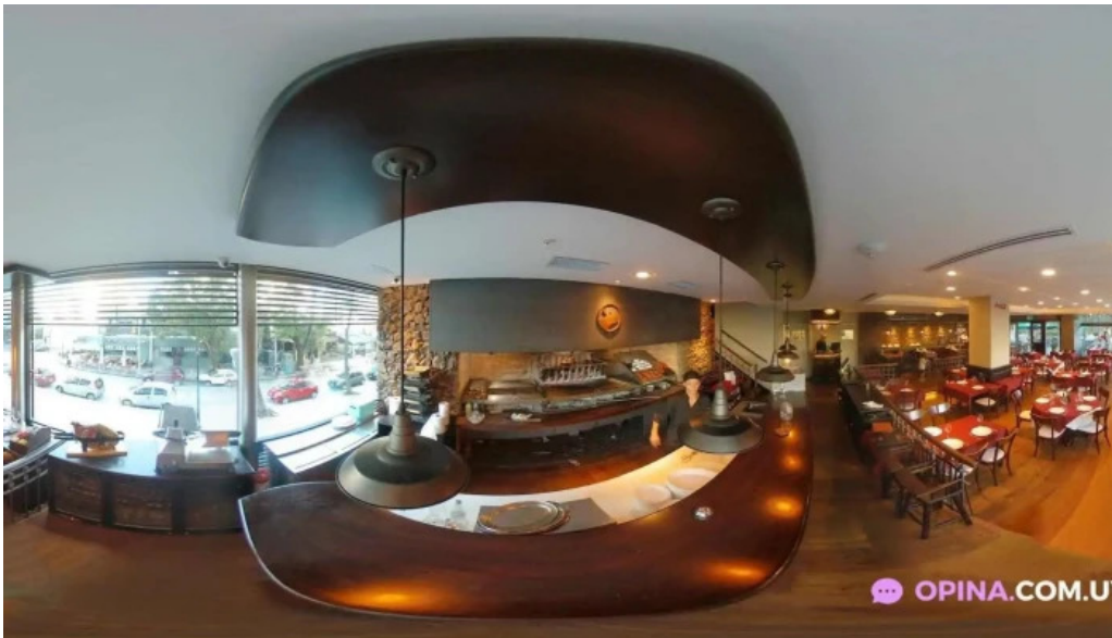
Garcia street view y 360