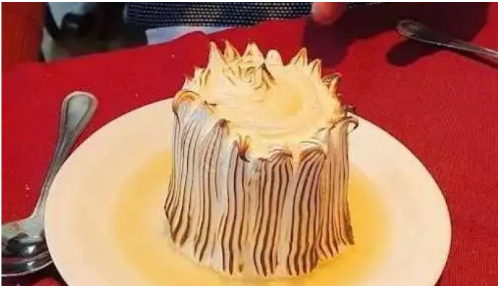
Garcia baked alaska