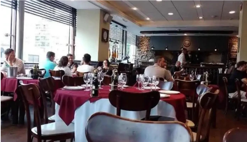
Garcia comida y bebida