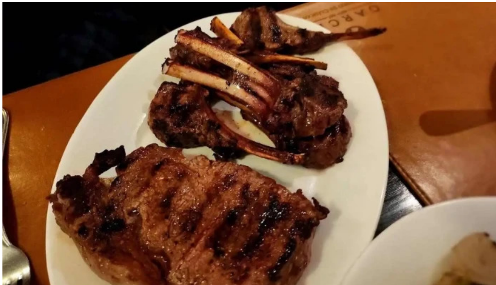
Garcia mas recientes