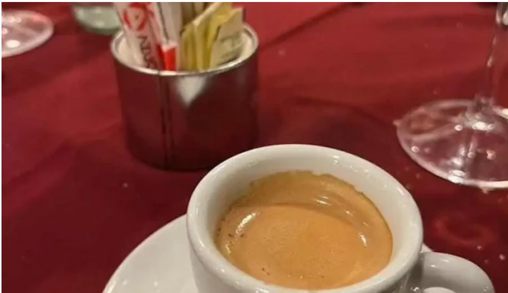
Garcia cafe expreso