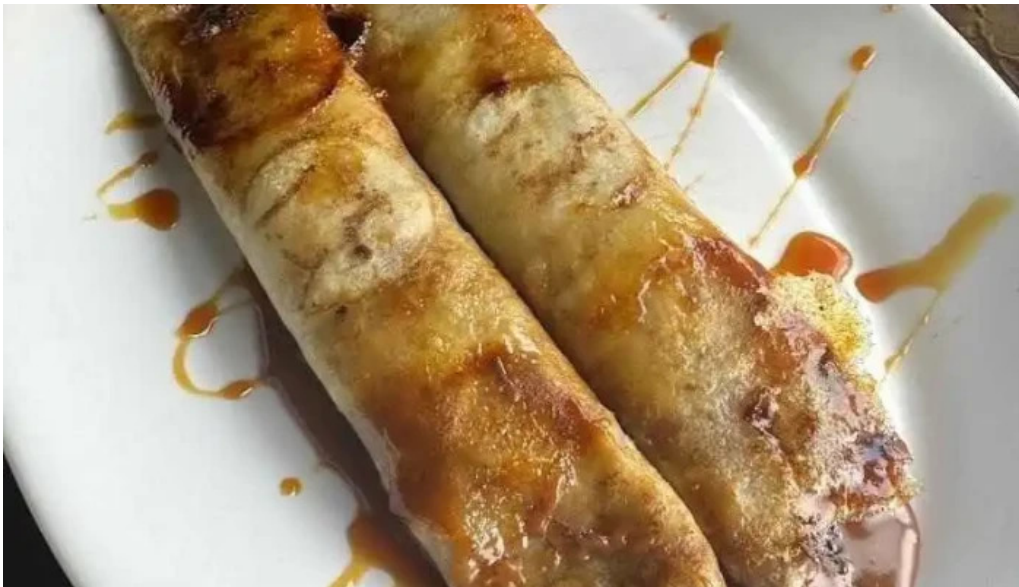
Garcia dulce de leche