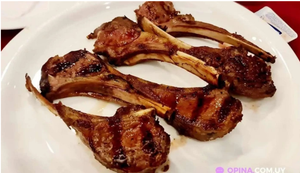
Garcia costillar de cordero