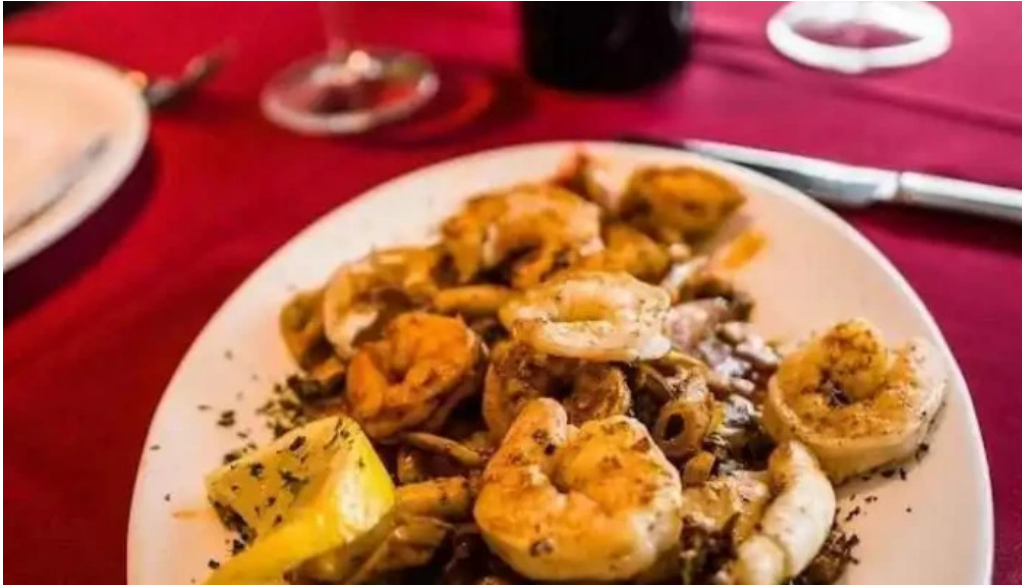
Garcia del propietario