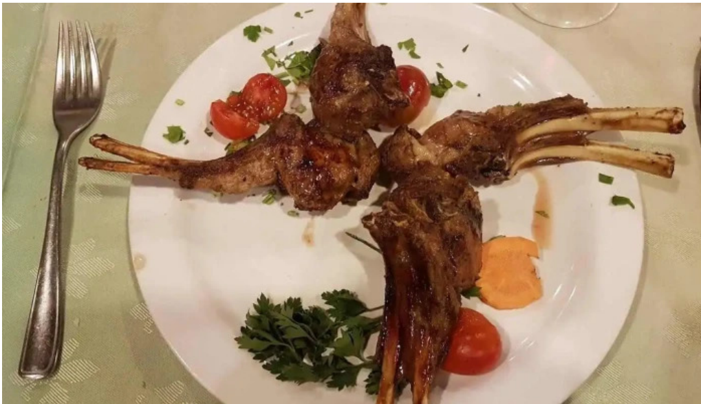
El fogon costillar de cordero