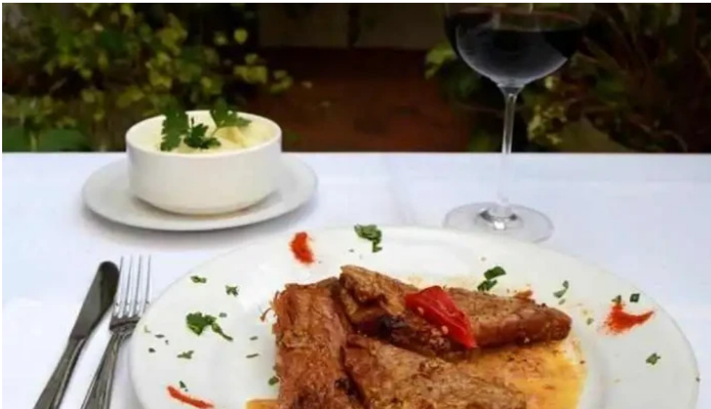
El fogon comida y bebida