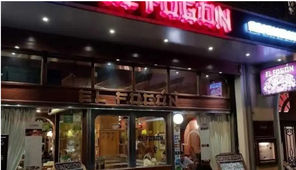
El fogon todas