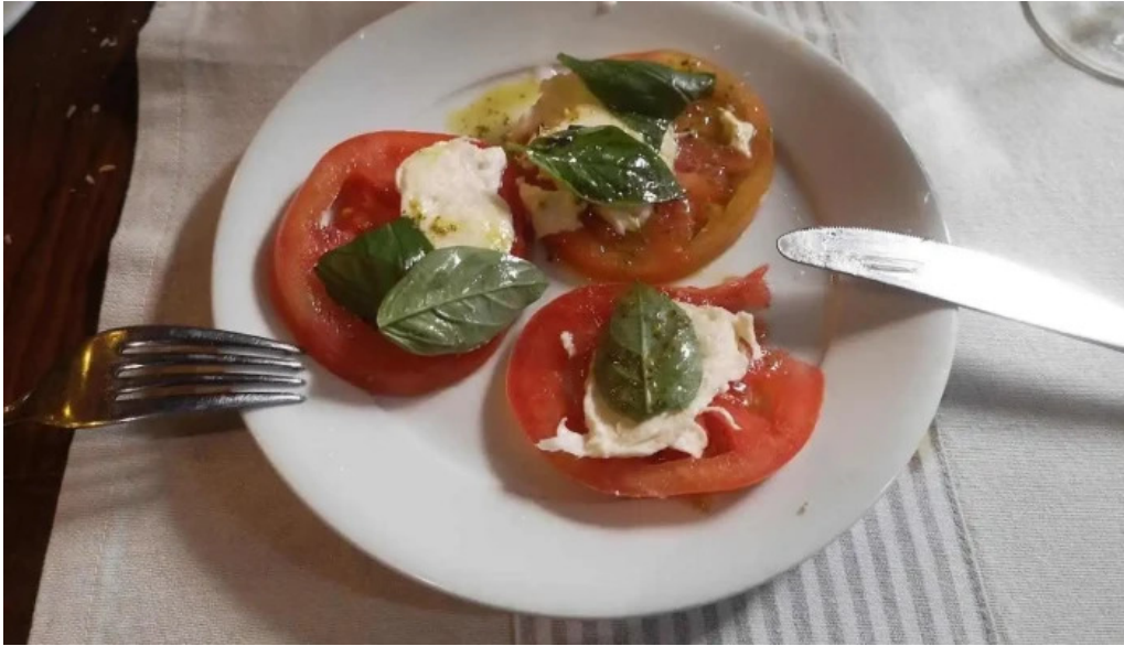
El fogon ensalada caprese