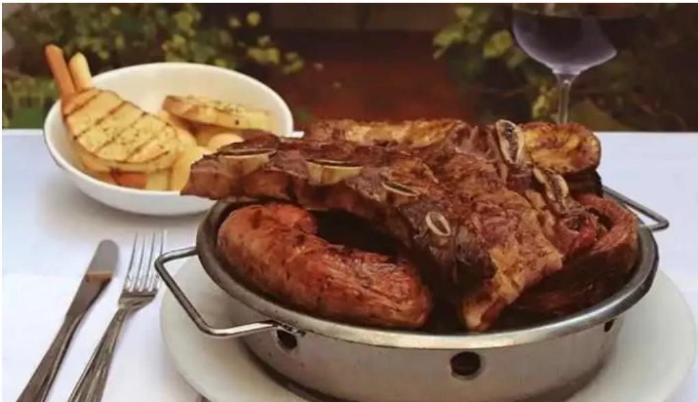
El fogon filete