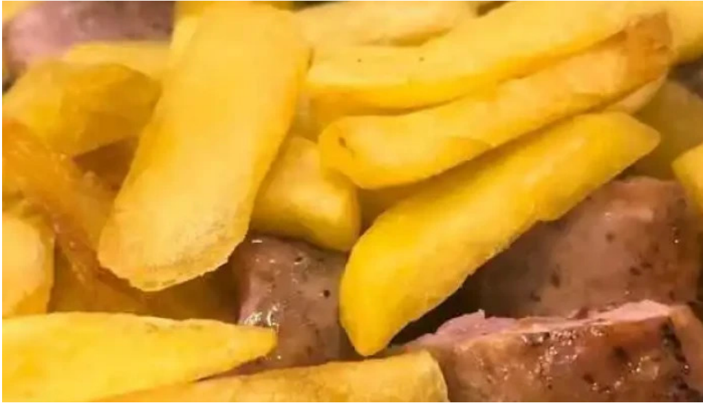
El fogon churrasco