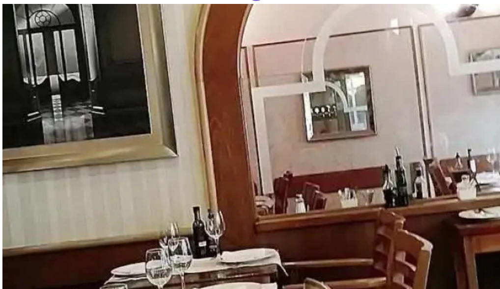
El fogon videos