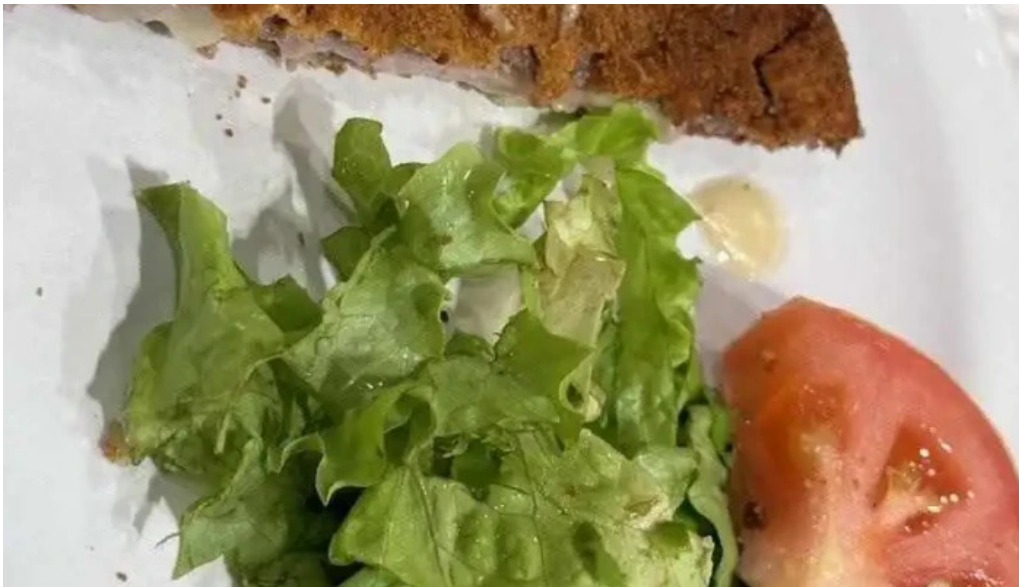
El fogon mas recientes