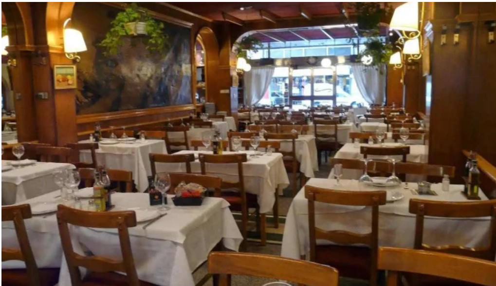
El fogon del propietario