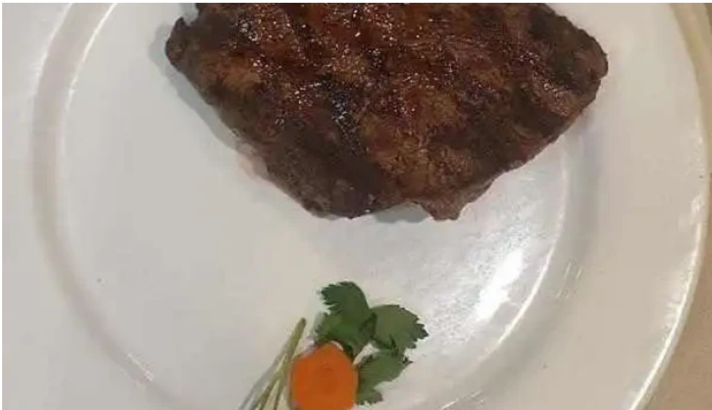
El fogon ribeye