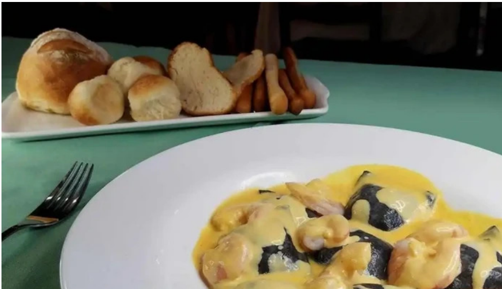
El fogon ravioli