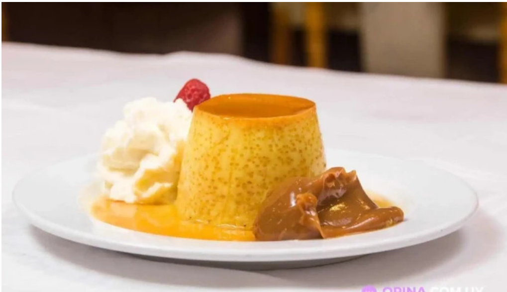
El fogon flan