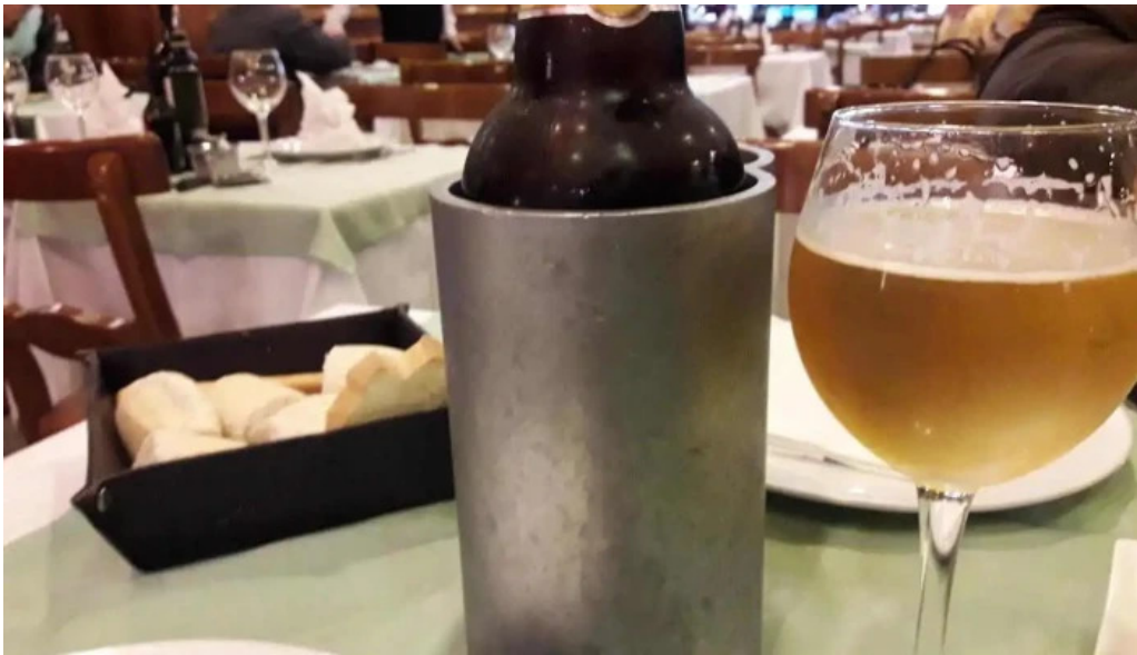
El fogon cerveza