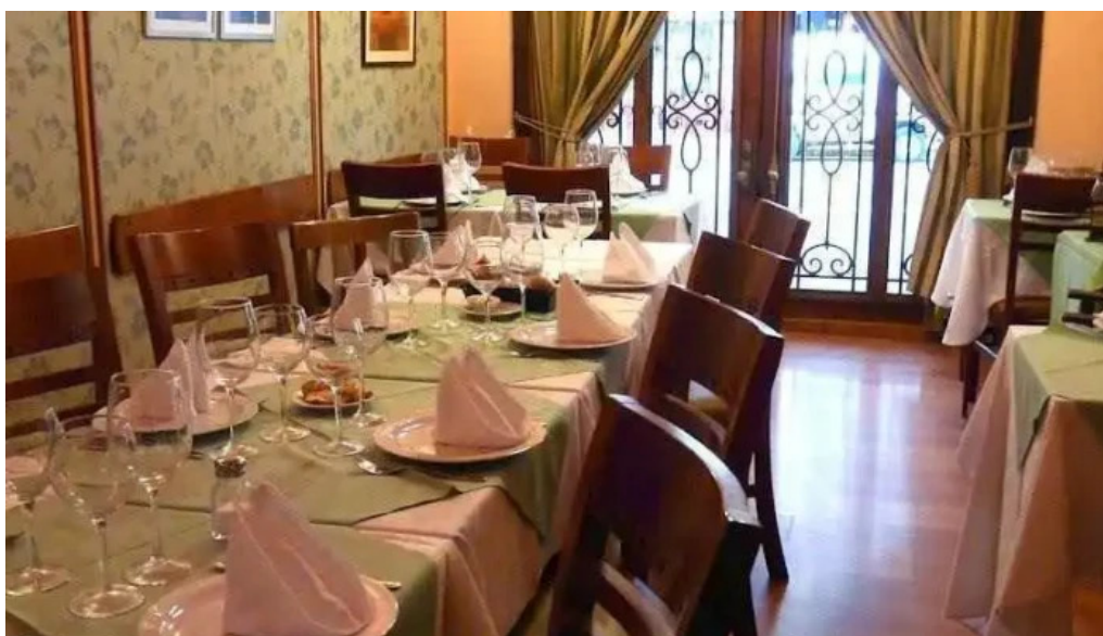
El fogon ambiente