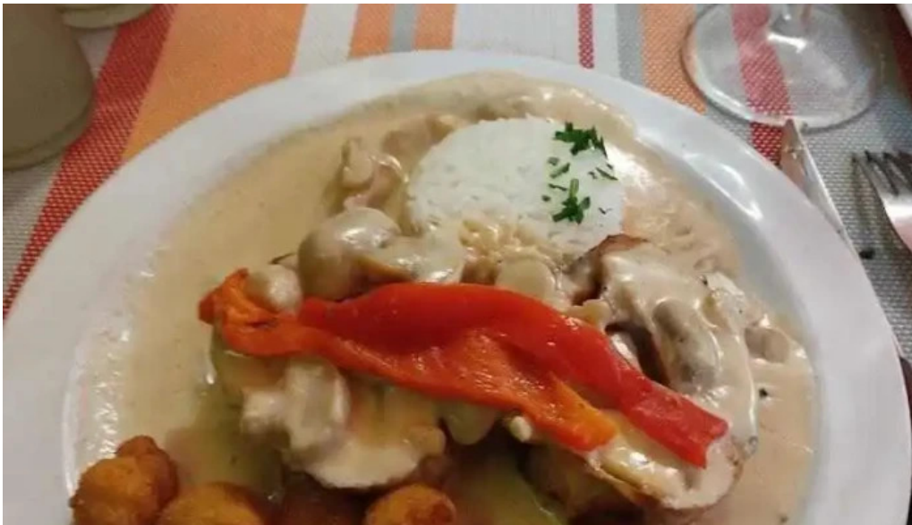
El fogon salsa de champinones