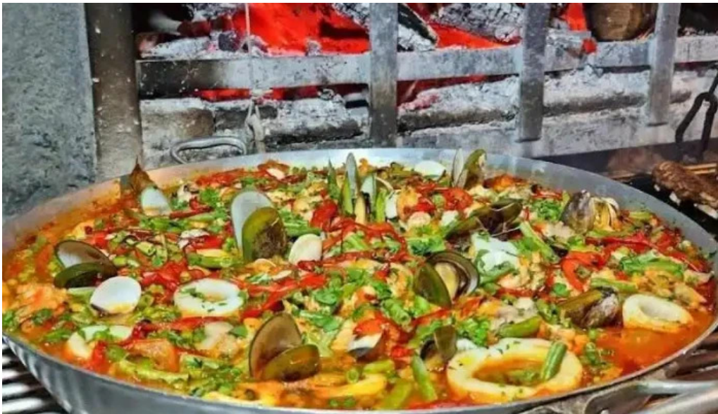
El fogon del propietario