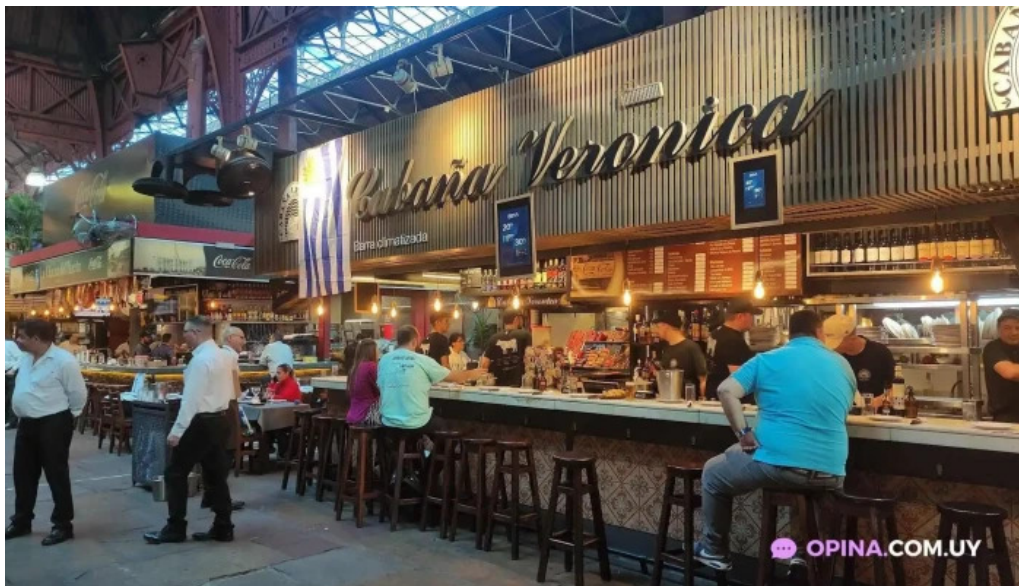
El fogon ambiente