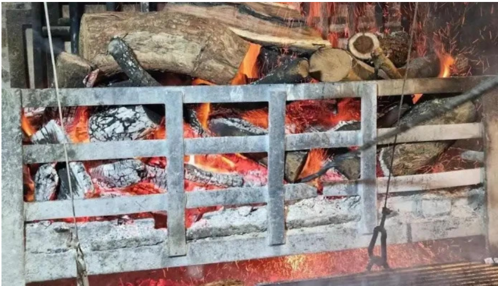
El fogan montevideo