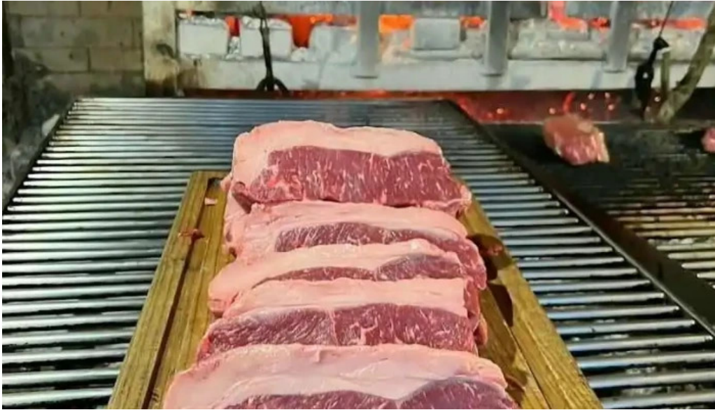
El fogon comida y bebida