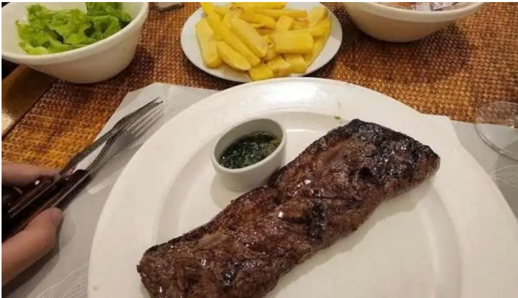
El fogan solomillo