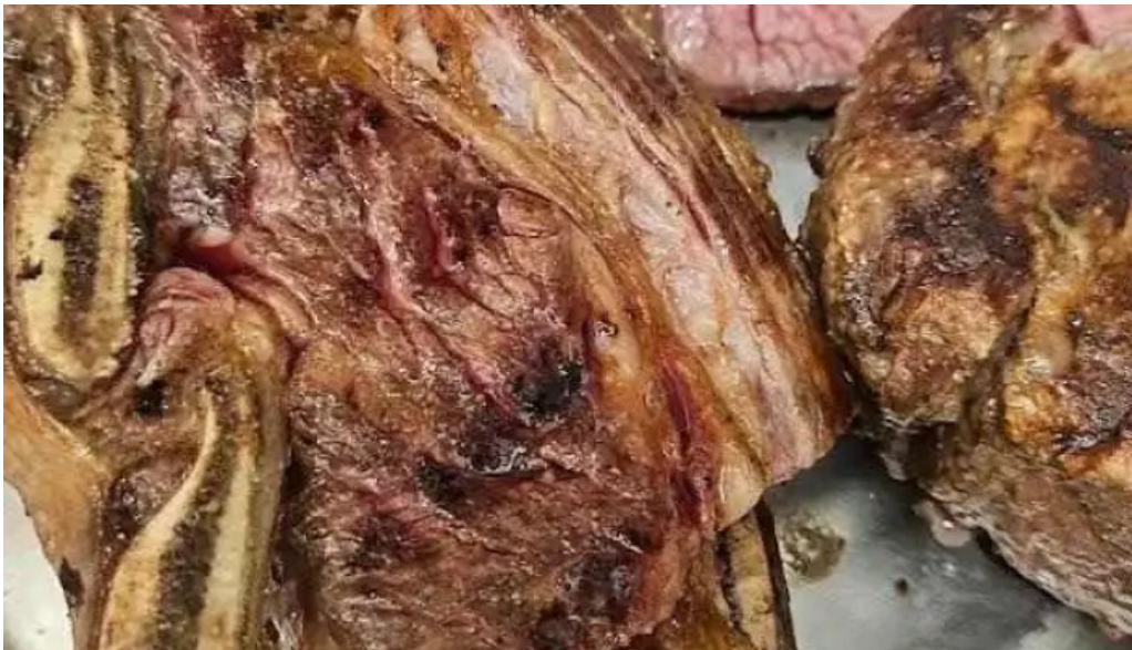
El fogon churrasco