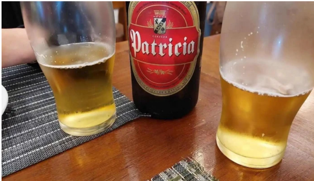
El fogon cerveza