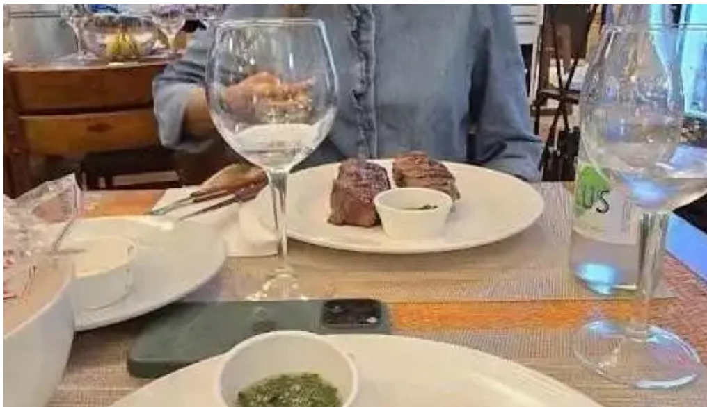
El fogon mas recientes