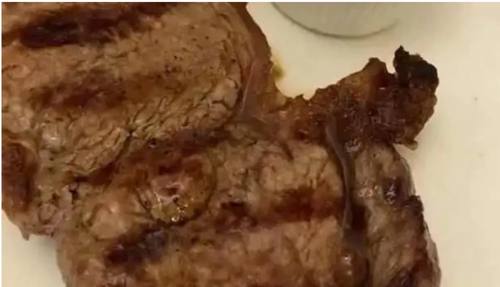
El fogon videos