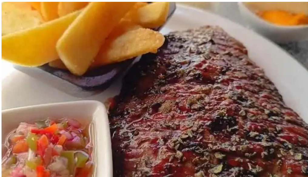
Carbonada mas recientes