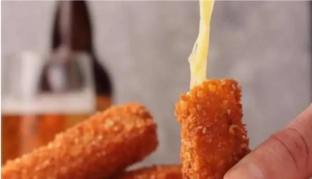
Carbonada comida y bebida