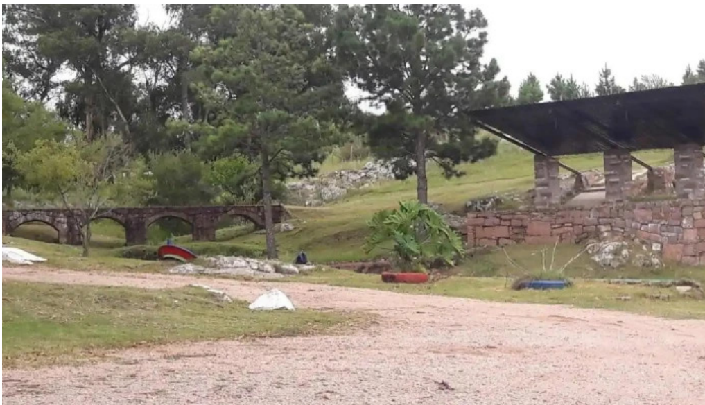
Parque nacientes del olimar santa clara de olimar