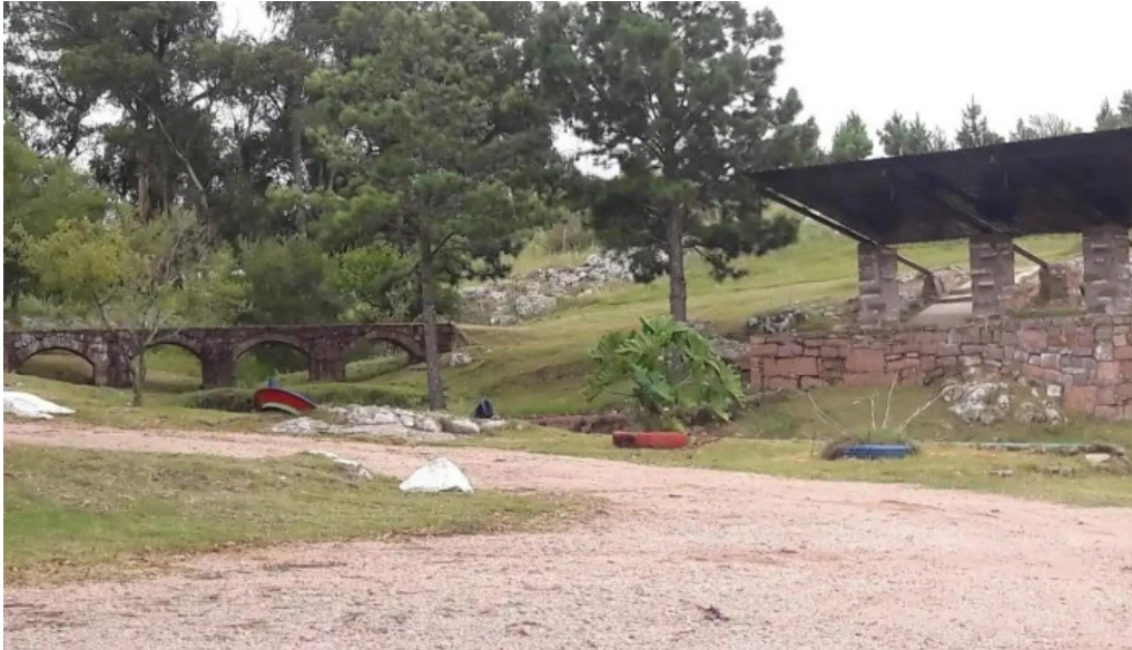
Parque nacientes del olimar todas