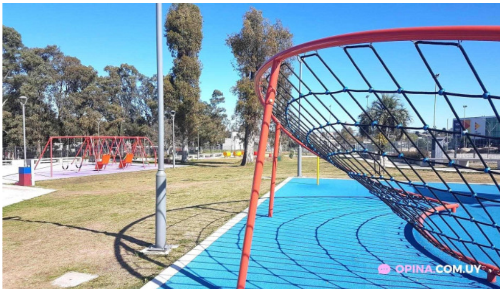
Parque artigas las piedras las piedras