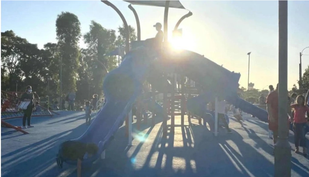
Parque artigas las piedras comentario 3