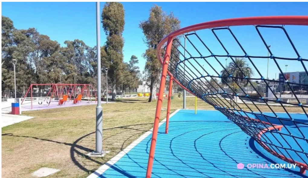
Parque artigas las piedras todo