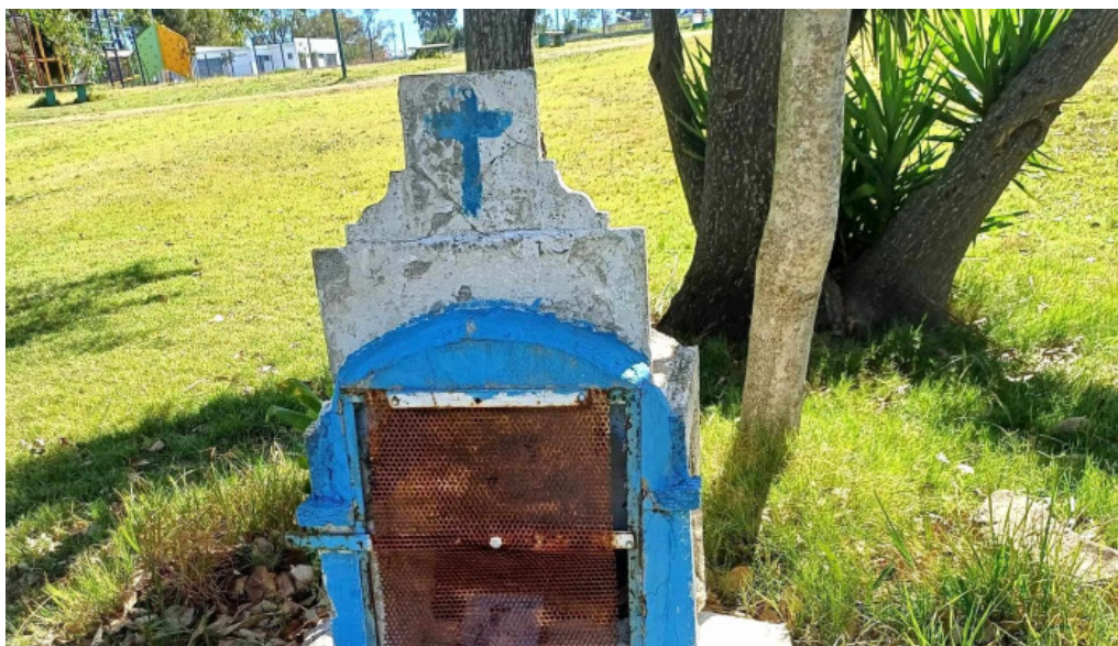
Parque artigas las piedras comentario 1