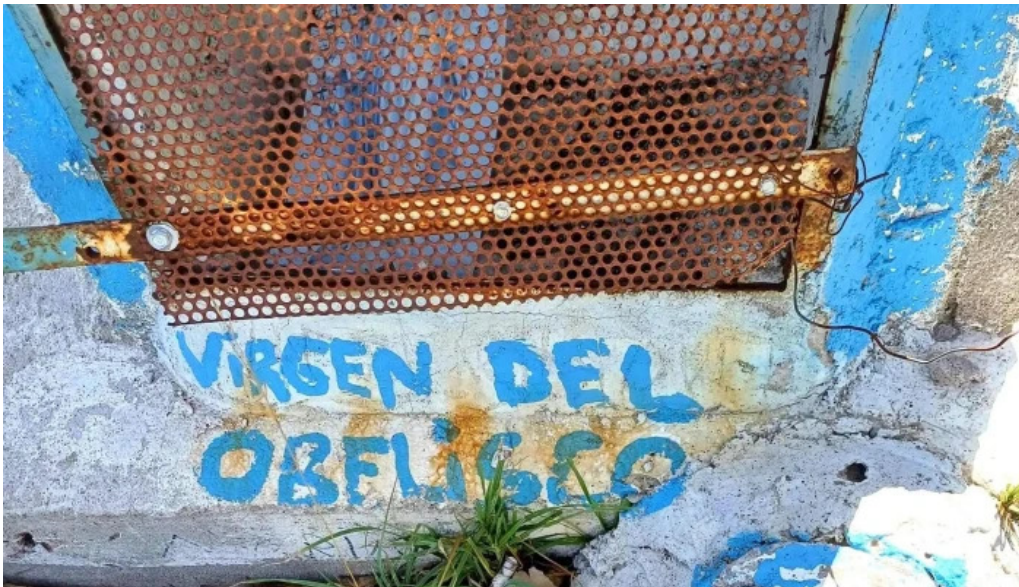
Parque artigas las piedras comentario 2