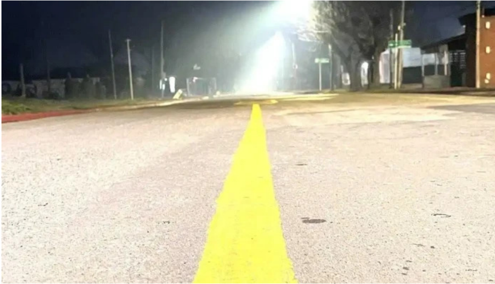
Parque artigas las piedras recientes