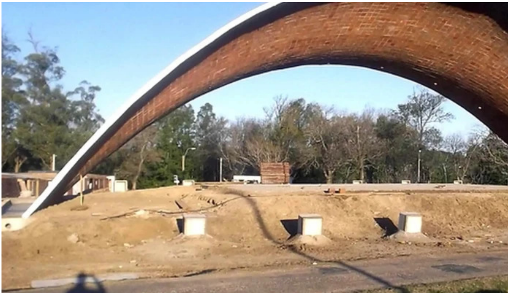
Parque artigas las piedras comentario 5