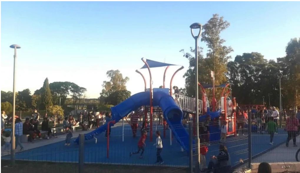
Parque artigas las piedras parque artigas batalla de las piedras