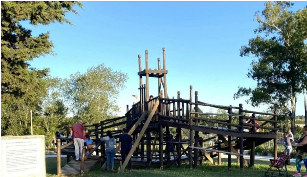
Parque artigas las piedras comentario 4