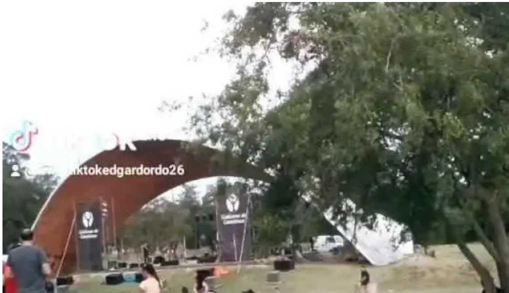
Parque artigas las piedras videos