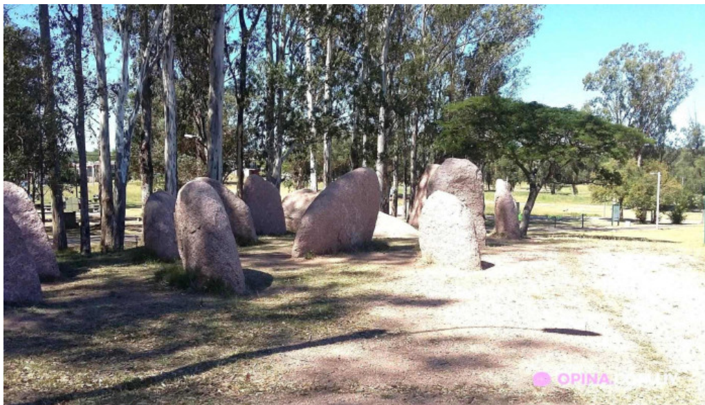
Parque artigas batalla de las piedras las piedras