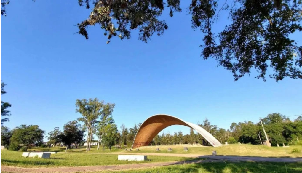
Parque artigas batalla de las piedras anfiteatro a don jose