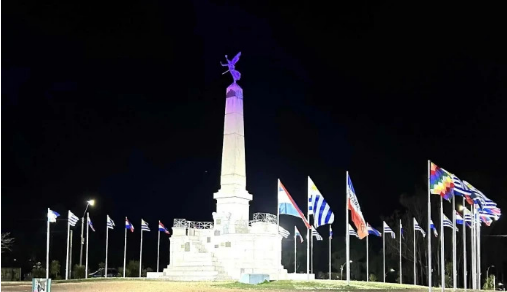
Parque artigas batalla de las piedras comentario 4