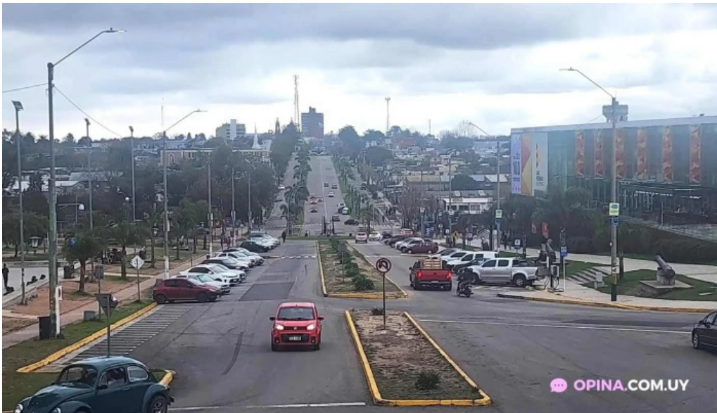
Parque artigas batalla de las piedras recientes