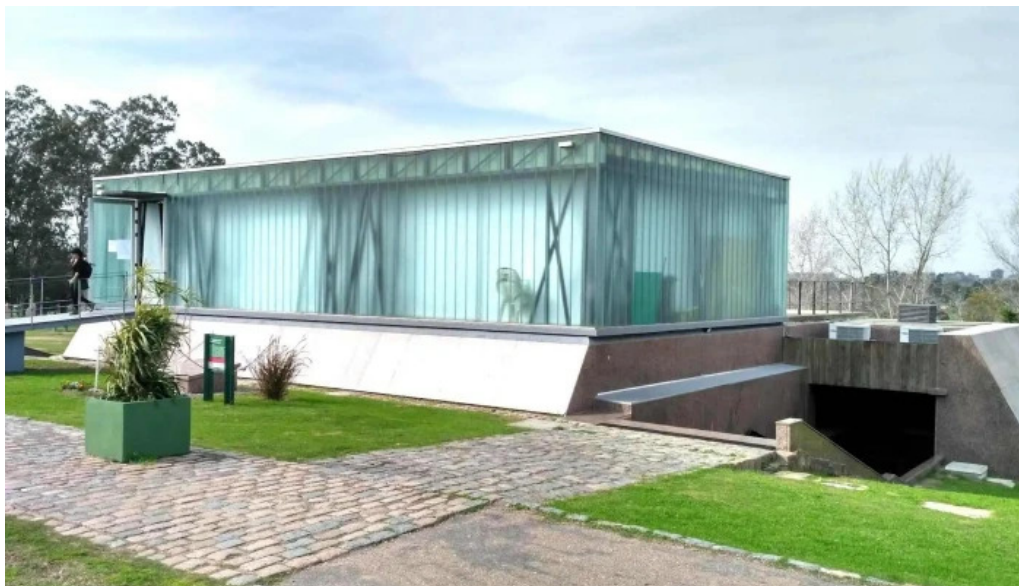
Parque artigas batalla de las piedras pabellon del bicentenario