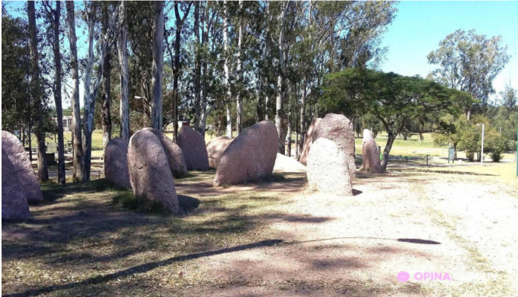
Parque artigas batalla de las piedras todo