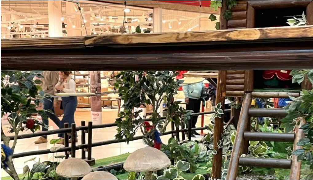
Parque artigas batalla de las piedras comentario 2