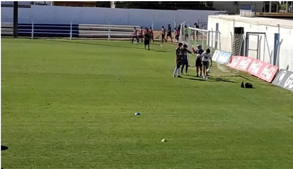
Parque artigas batalla de las piedras estadio parque artigas club atletico juventud