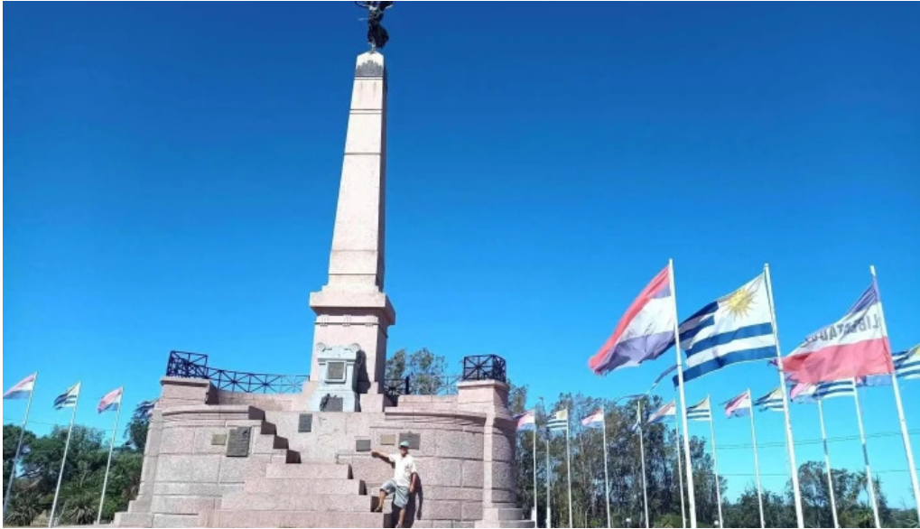
Parque artigas batalla de las piedras obelisco de las piedras