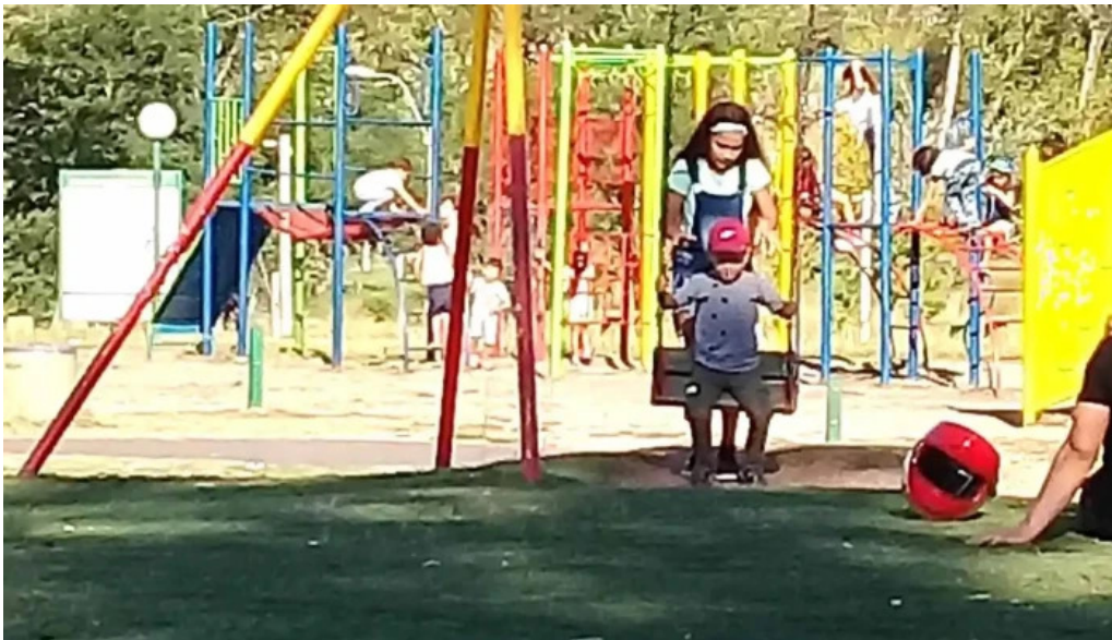
Parque artigas batalla de las piedras nuevo parque cerrado para niños