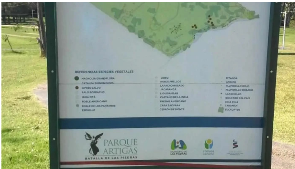
Parque artigas batalla de las piedras planos de la propiedad