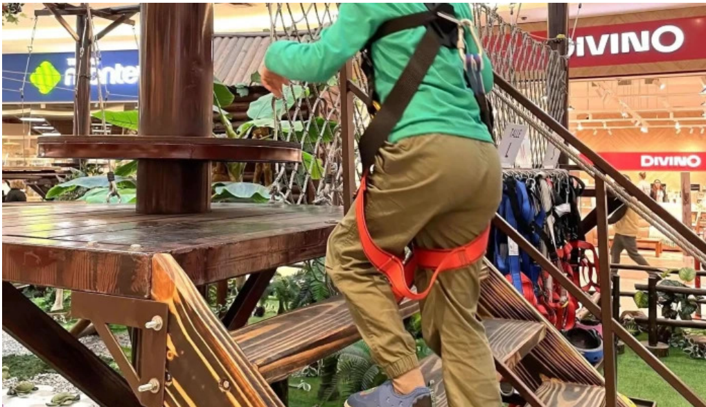
Parque artigas batalla de las piedras comentario 3