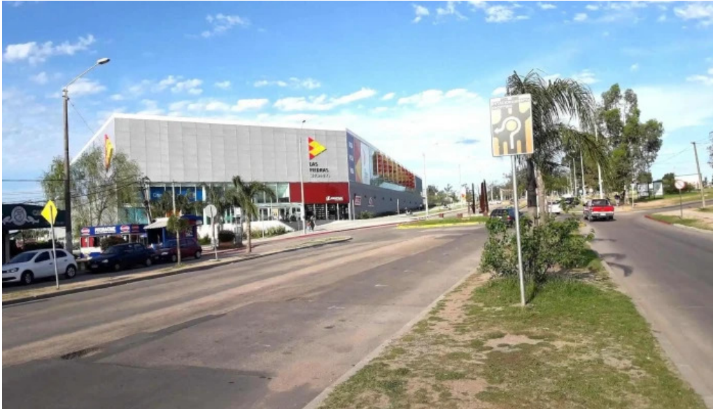
Parque artigas batalla de las piedras las piedras shopping