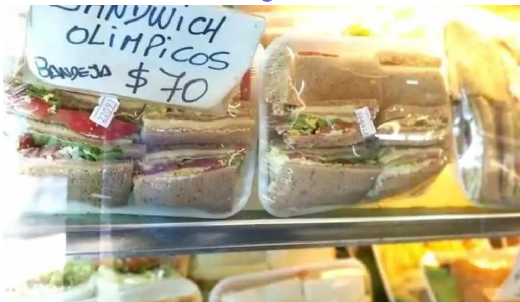
Socol panaderia confiteria vitrina