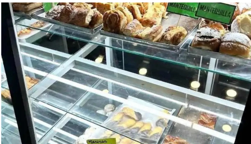
Socol panaderia confiteria ambiente