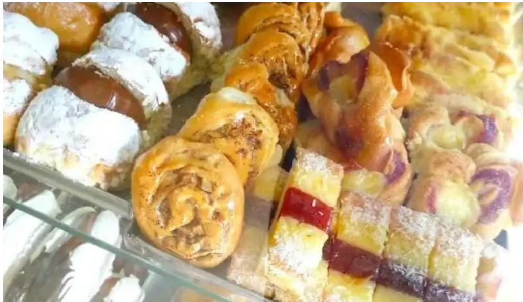
Socol panaderia confiteria comida y bebida