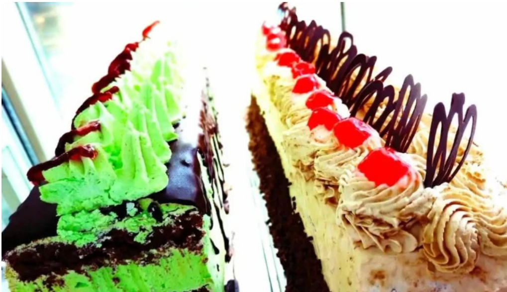
Socol panaderia confiteria pastel