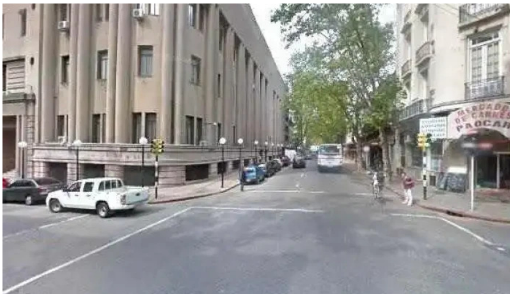
Socol panaderia confiteria street view y 360