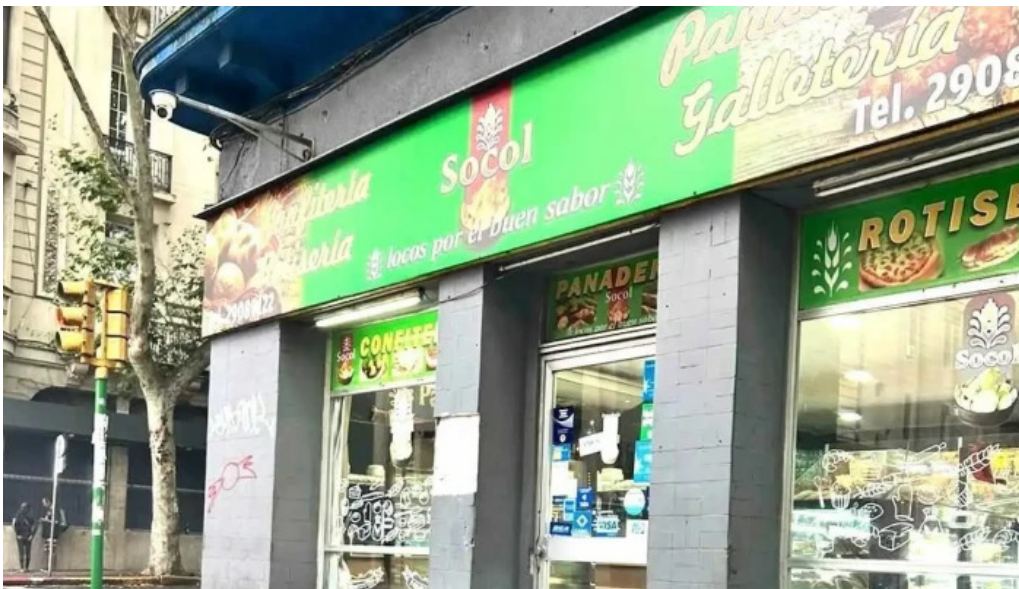
Socol panaderia confiteria montevideo