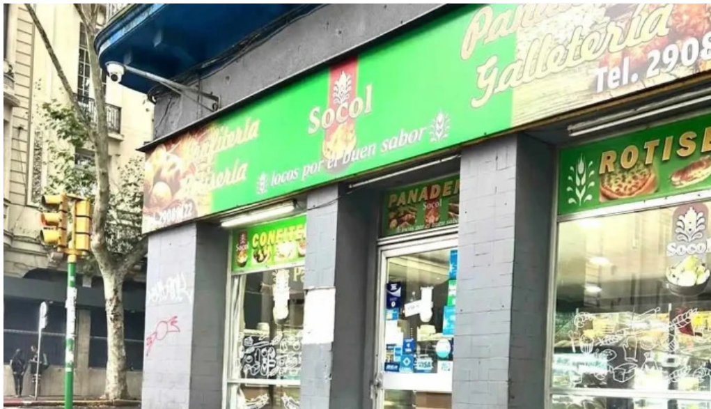
Socol panaderia confiteria todas