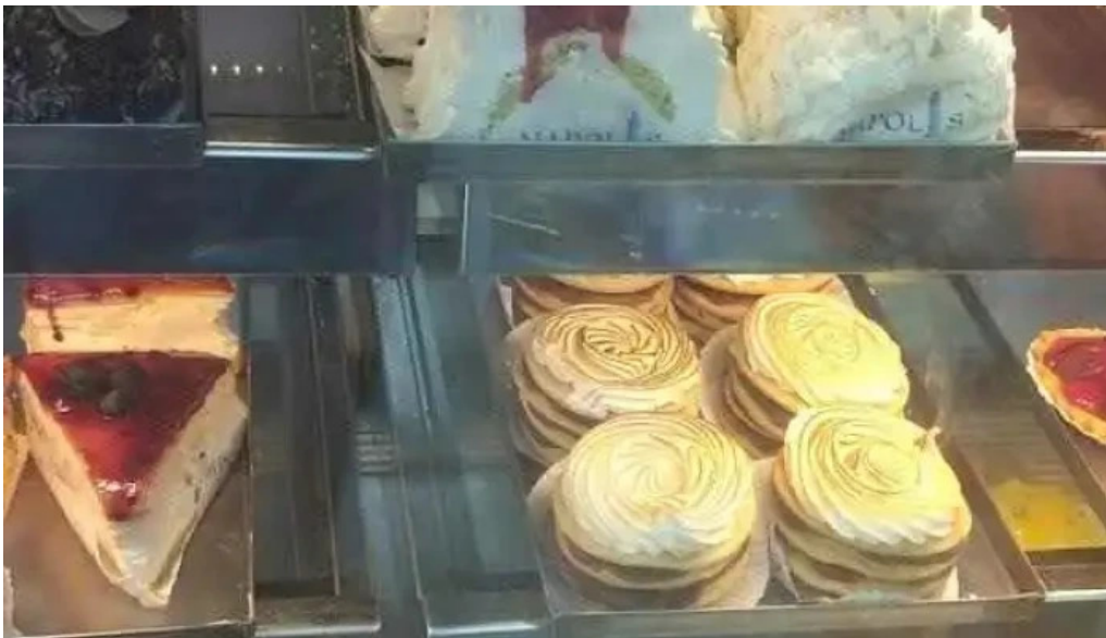
Napolis confiteria y panaderia vitrina