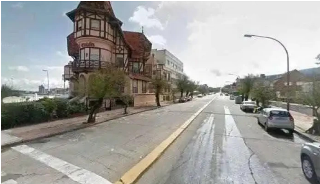
Napolis confiteria y panaderia street view y 360