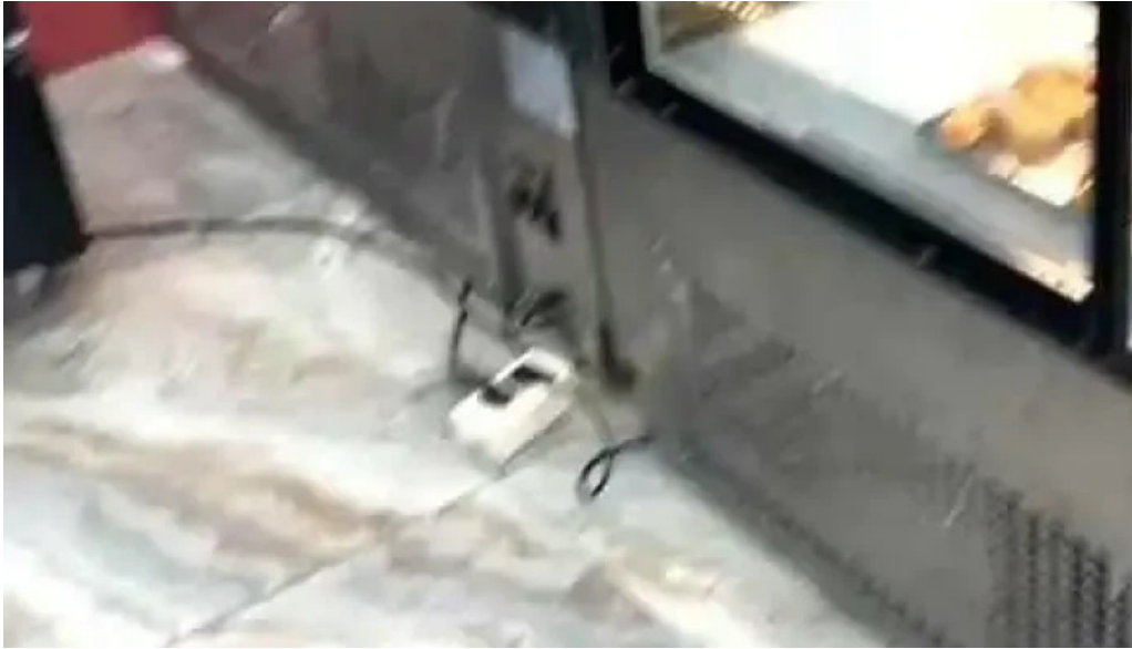
Napolis confiteria y panaderia videos