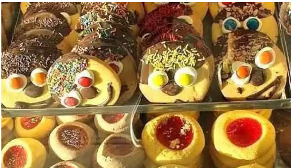
Napolis confiteria y panaderia comida y bebida