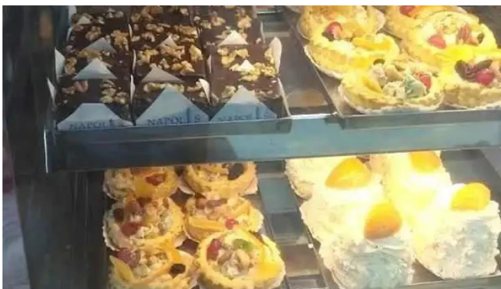
Napolis confiteria y panaderia ambiente