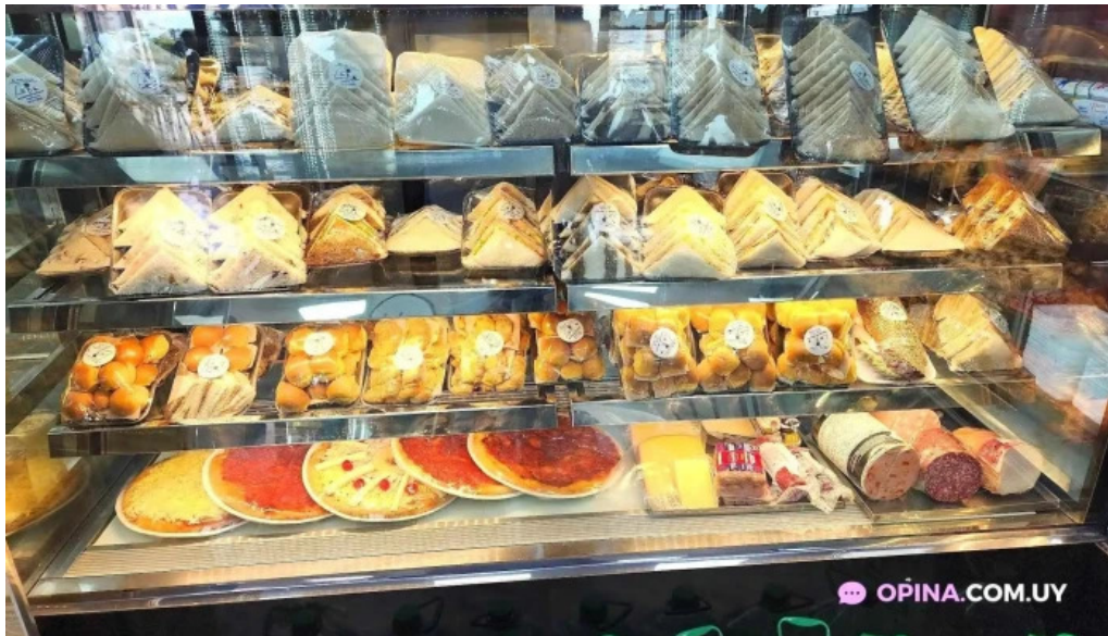
Napolis confiteria y panaderia pastel