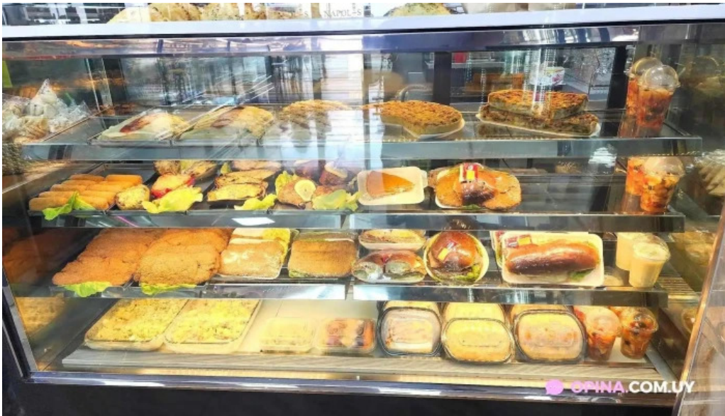
Napolis confiteria y panaderia todas