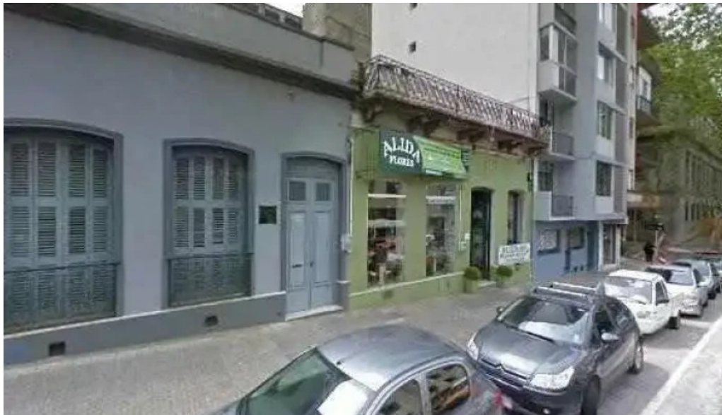
Petit fouruy street view y 360