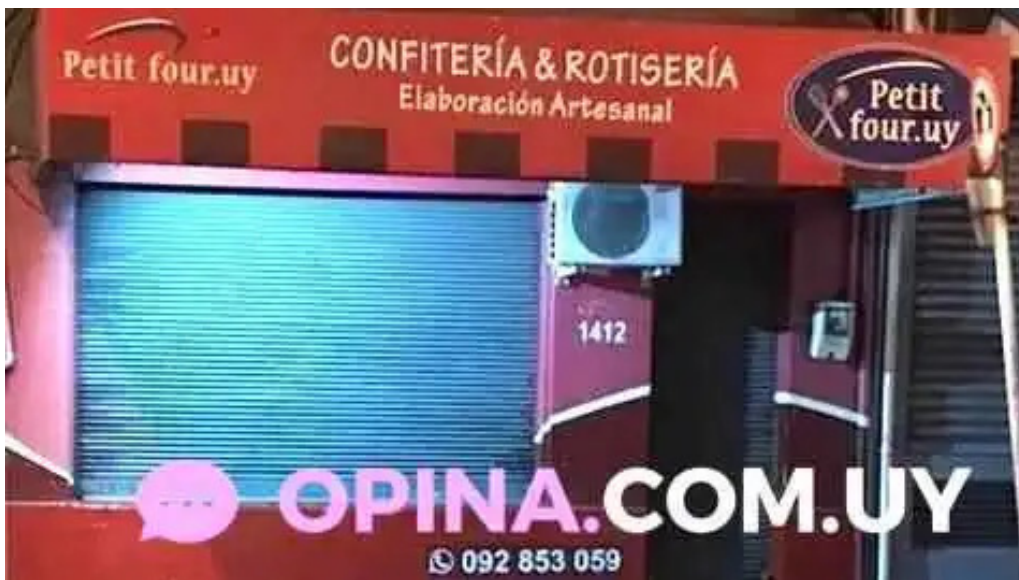
Petit four uy del propietario