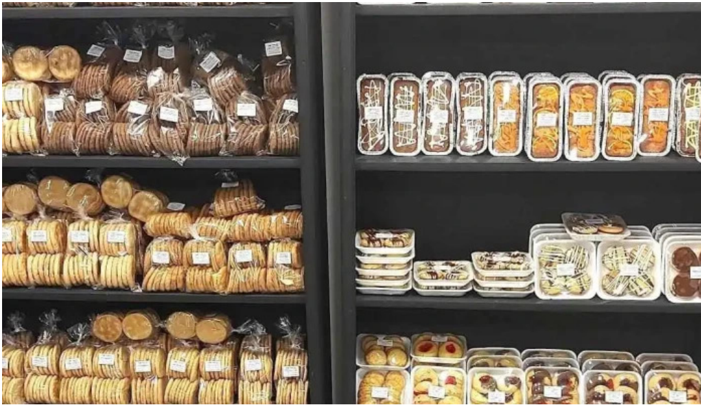
Petit fouruy ambiente