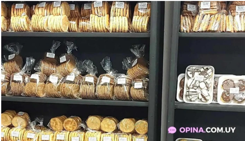
Petit fouruy todas