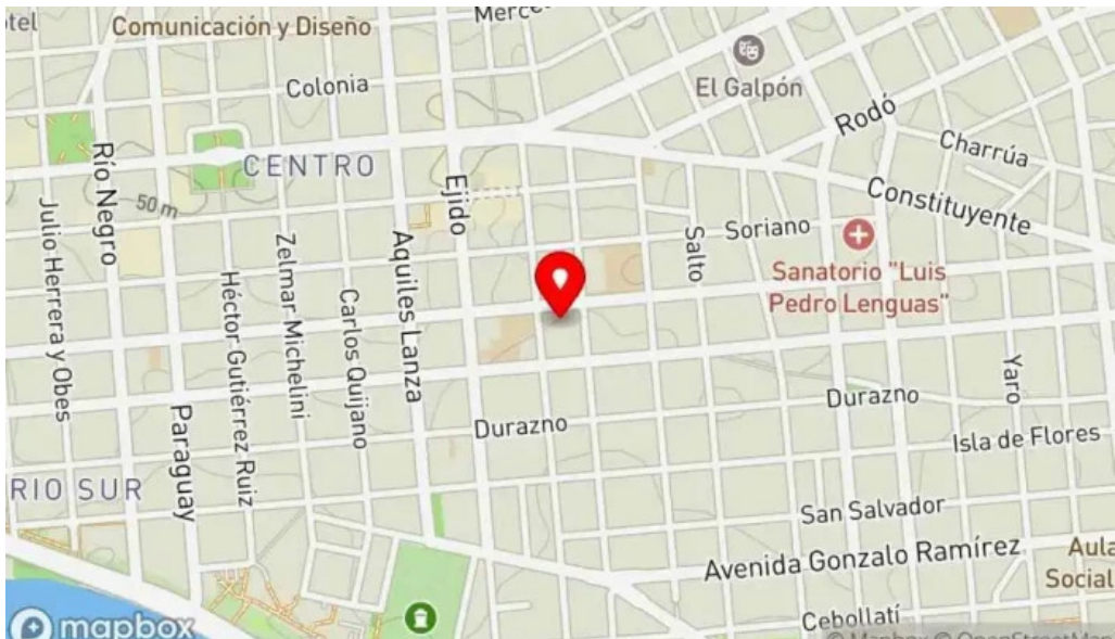
Petit four uy mapa