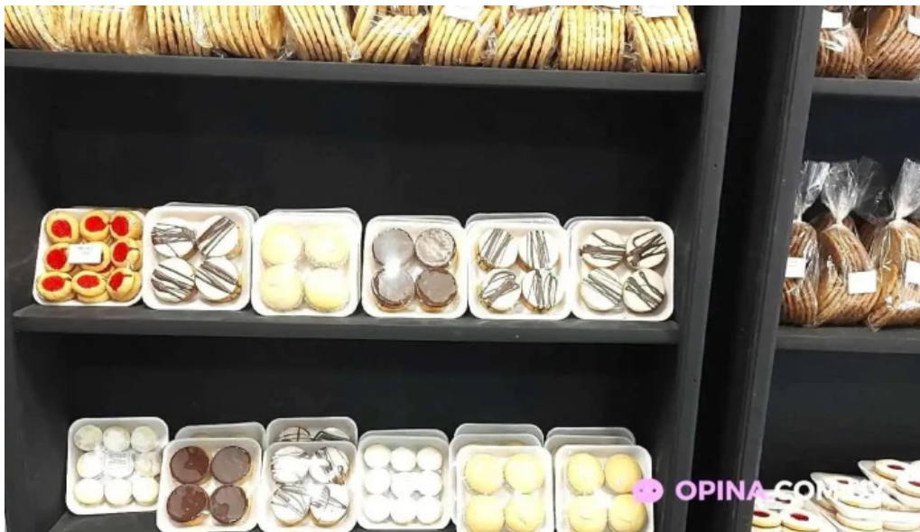
Petit fouruy vitrina