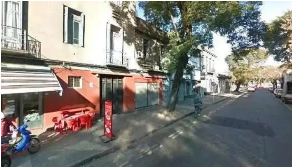
Panaderia y confiteria que bien street view y 360