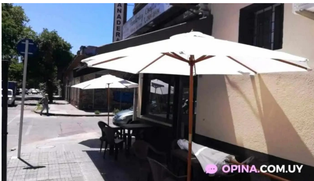
Panaderia y confiteria que bien ambiente