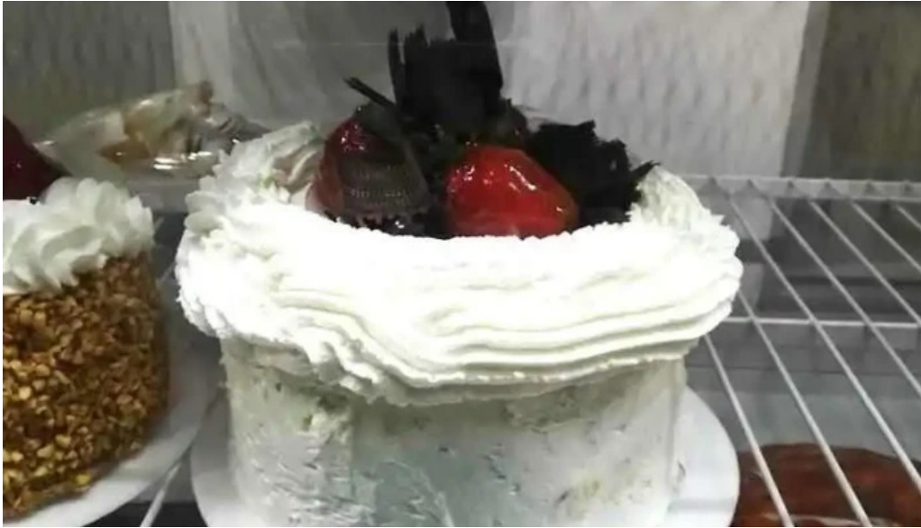
Panaderia y confiteria que bien pastel