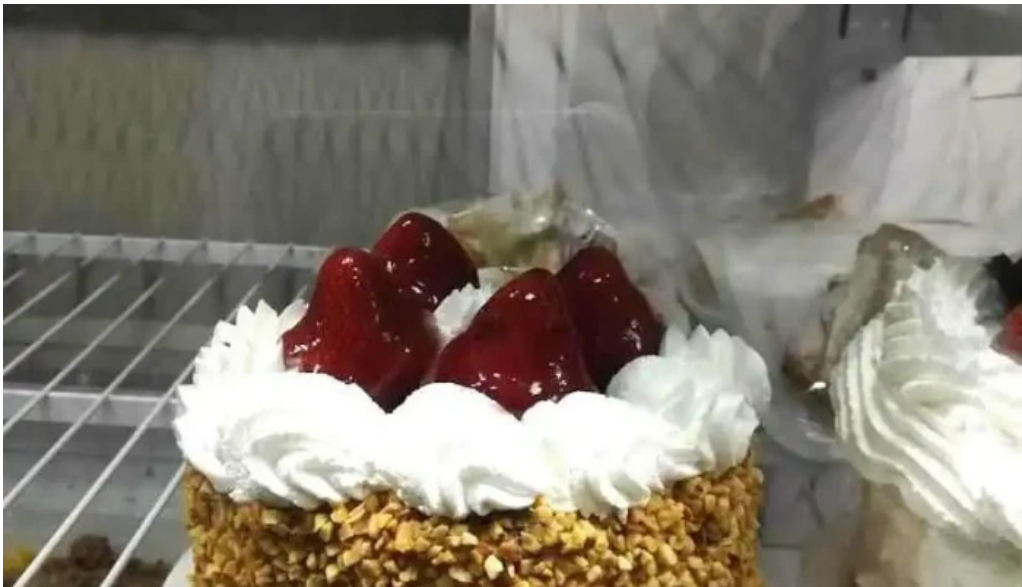
Panaderia y confiteria que bien montevideo