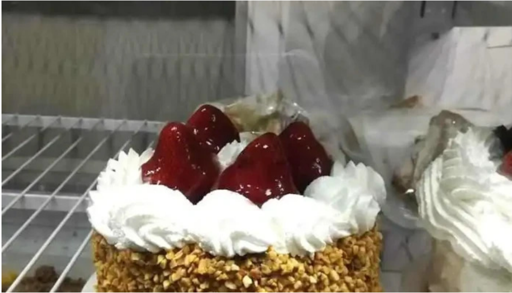
Panaderia y confiteria que bien todas