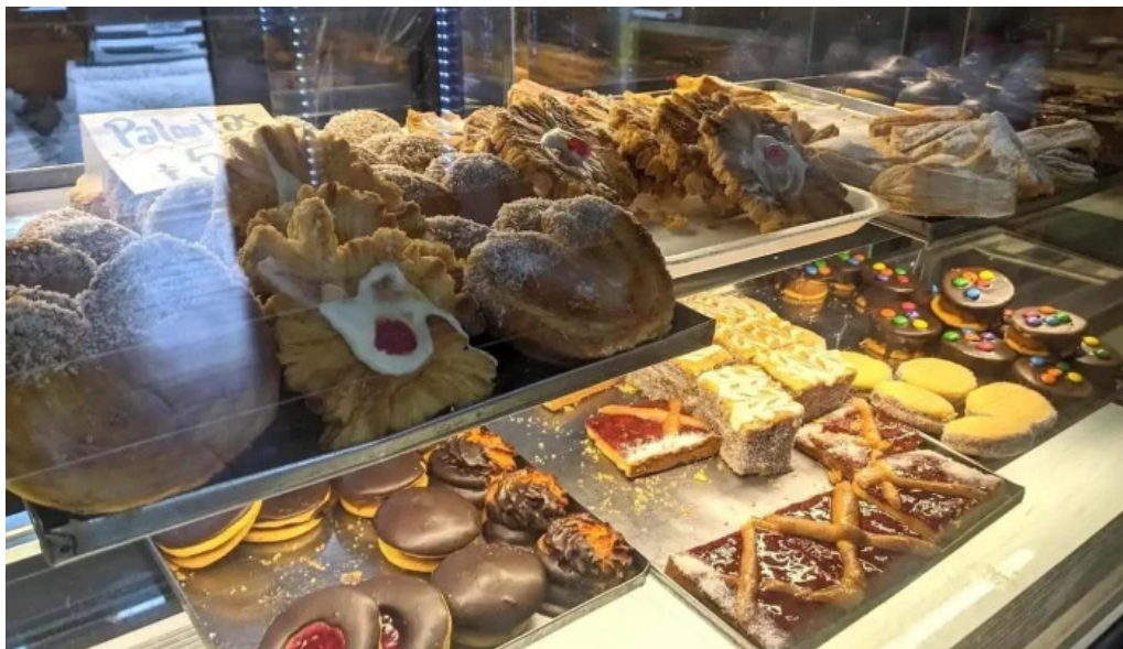
Panaderia y confiteria pronta luna comida y bebida