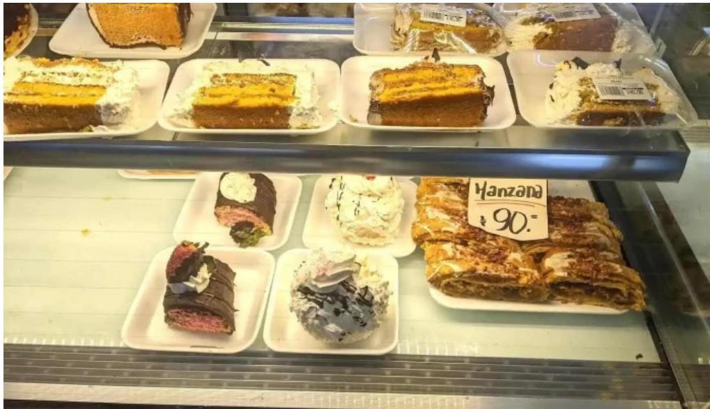
Panaderia y confiteria pronta luna ambiente