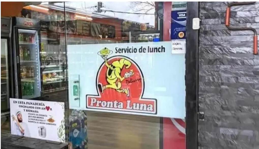
Panaderia y confiteria pronta luna montevideo