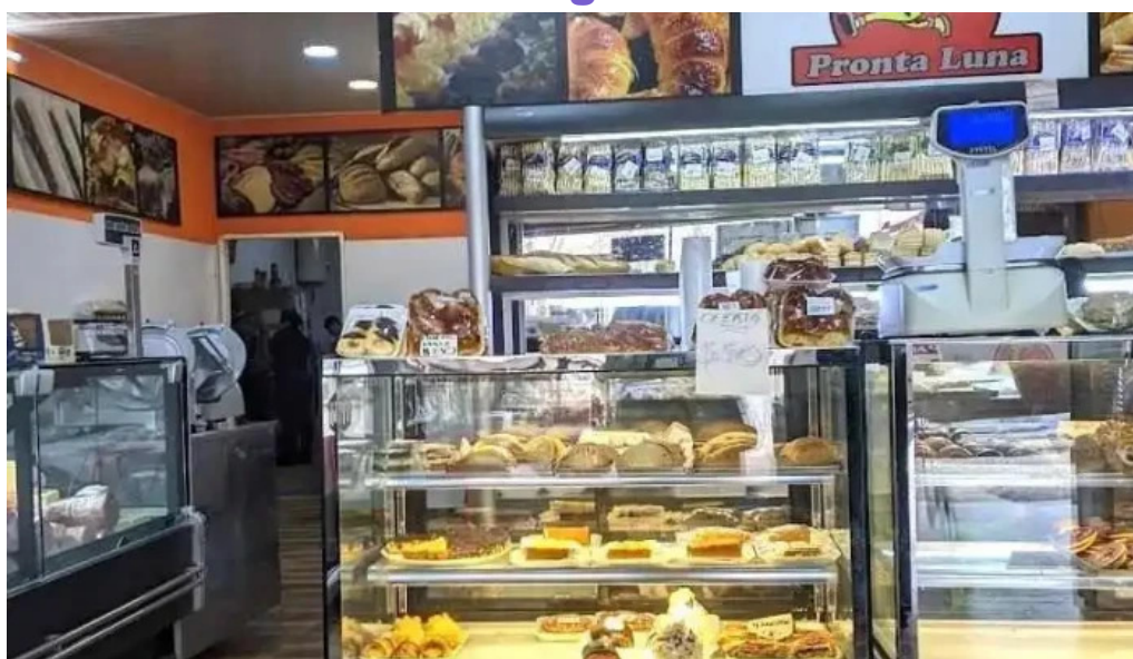
Panaderia y confiteria pronta luna vitrina