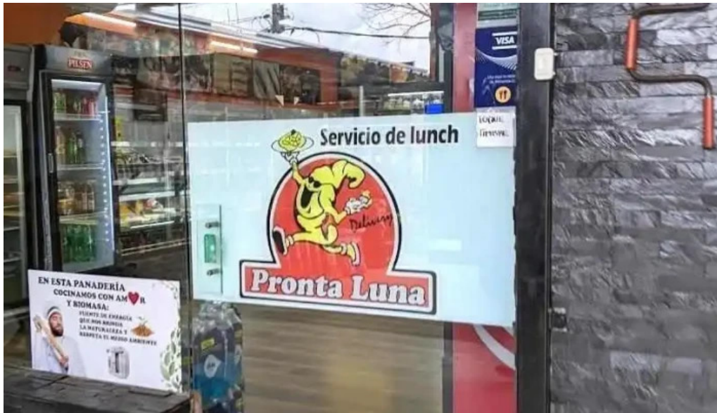
Panadería y confitería pronto luna todas