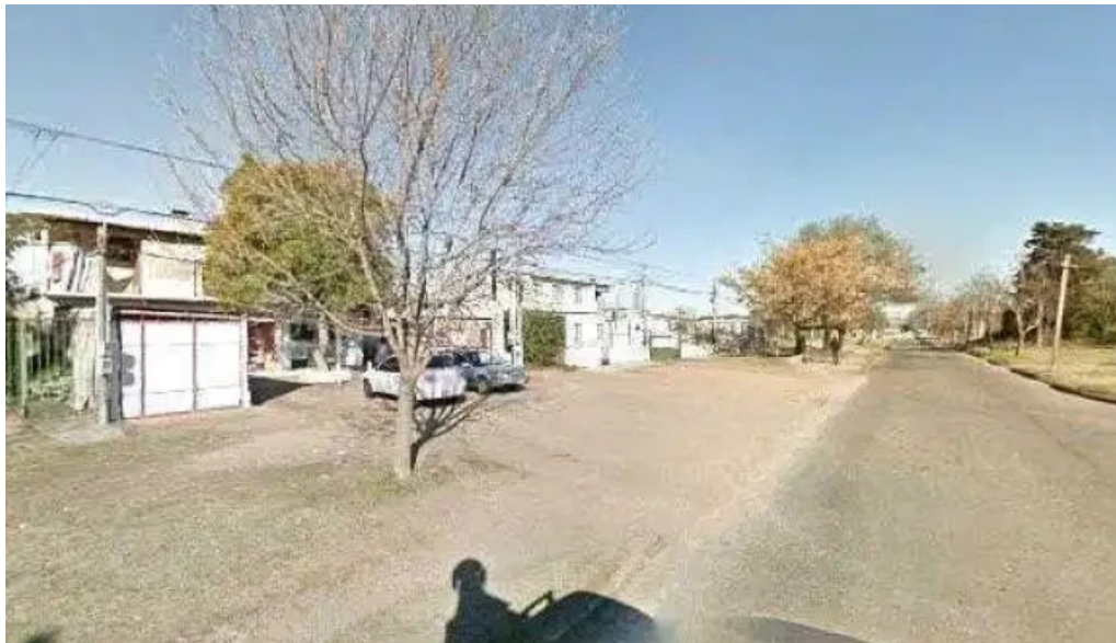
Panadería y confitería pronto luna street view y 360