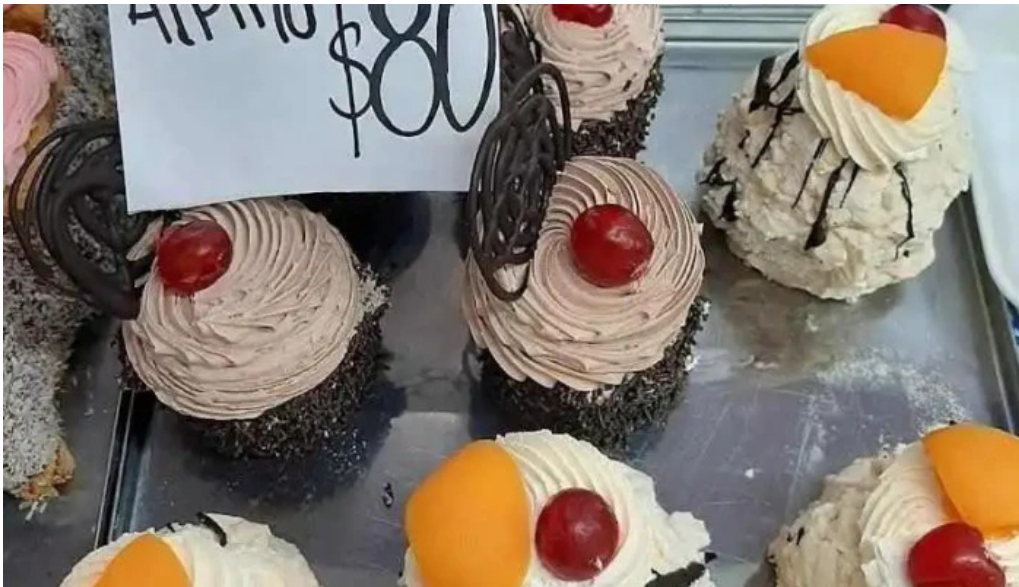
Panaderia y confiteria pronta luna pastel