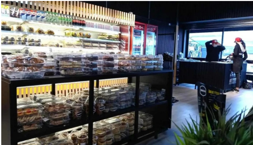
Panaderia y confiteria colon montevideo