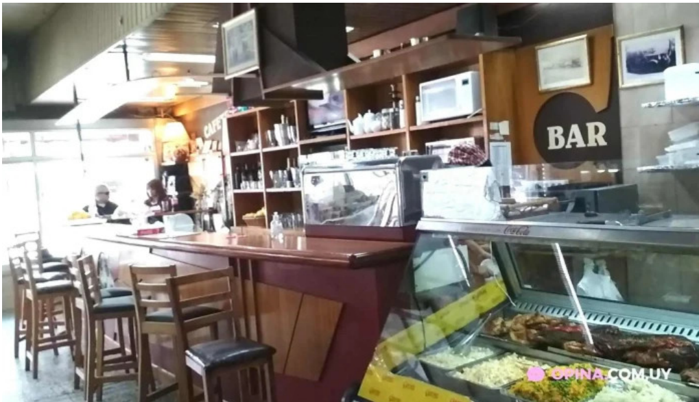
Panaderia y confiteria colon ambiente