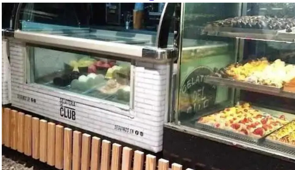
Panaderia y confiteria colon vitrina