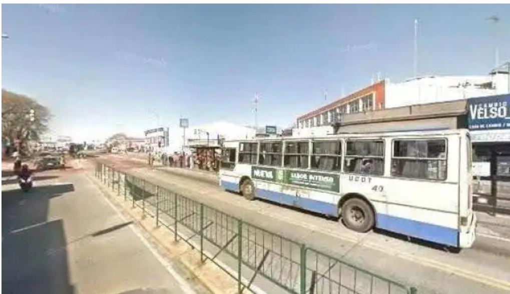
Panaderia y confiteria colon street view y 360