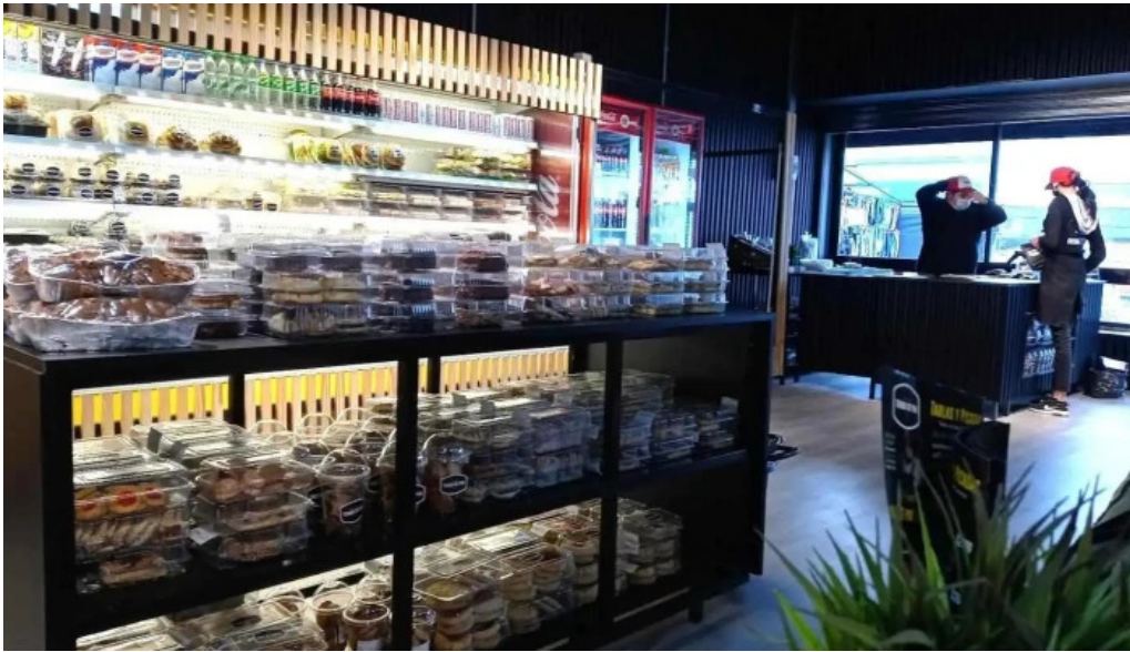
Panaderia y confiteria colon todas