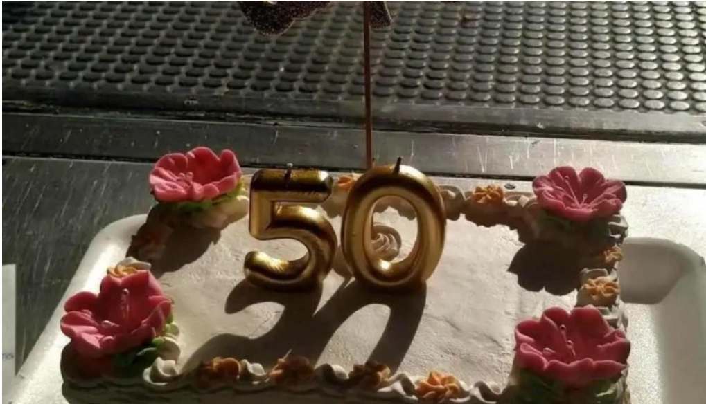
Panaderia y confiteria colon comida y bebida