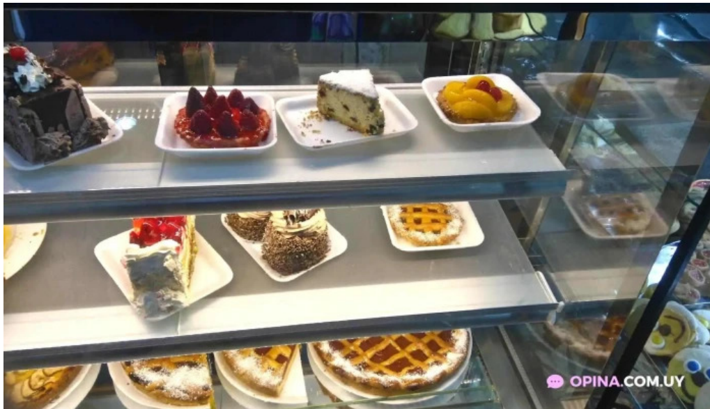
Panaderia el manjar pastel