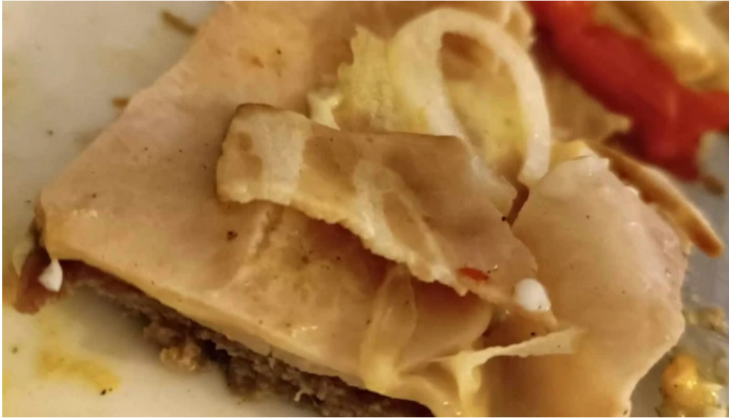
Panaderia el manjar comentario 6