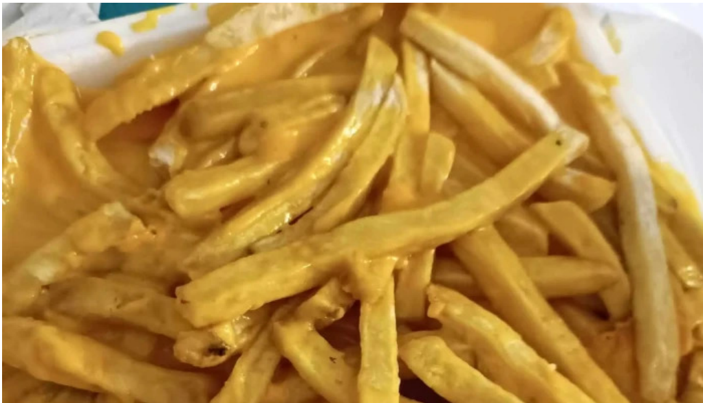
Panaderia el manjar comentario 5