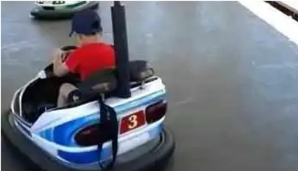
Panaderia el manjar videos