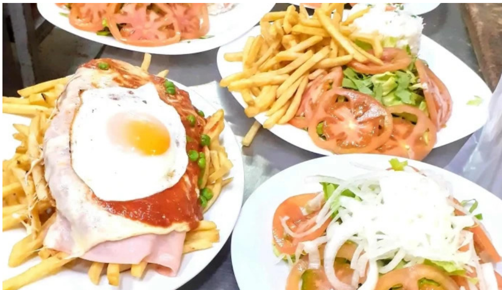
Panaderia el manjar comidas y bebidas