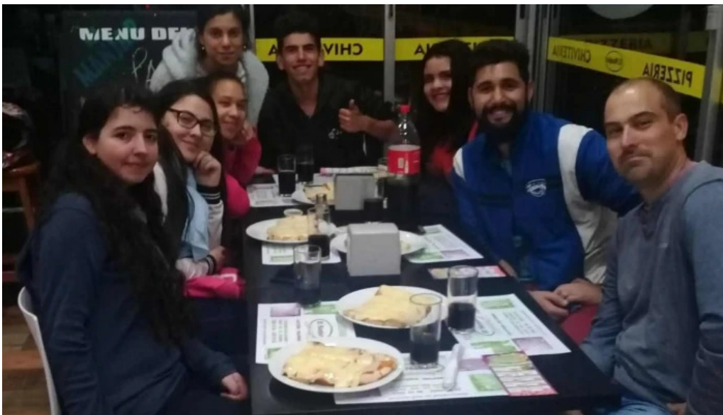
Panaderia el manjar comentario 7