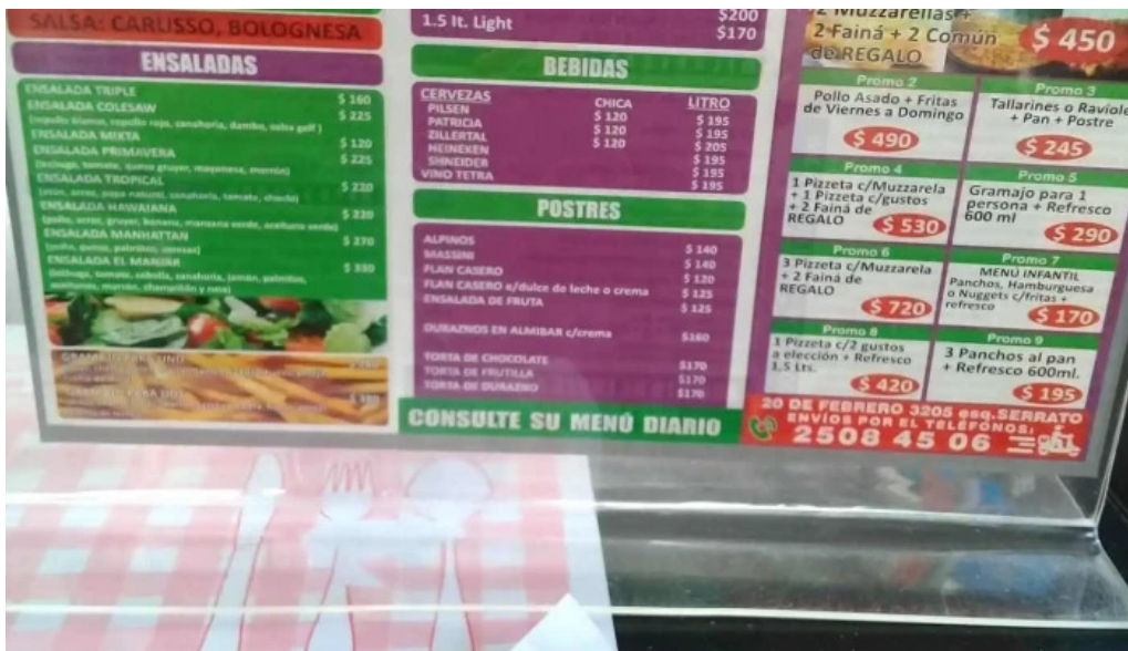
Panaderia el manjar menu