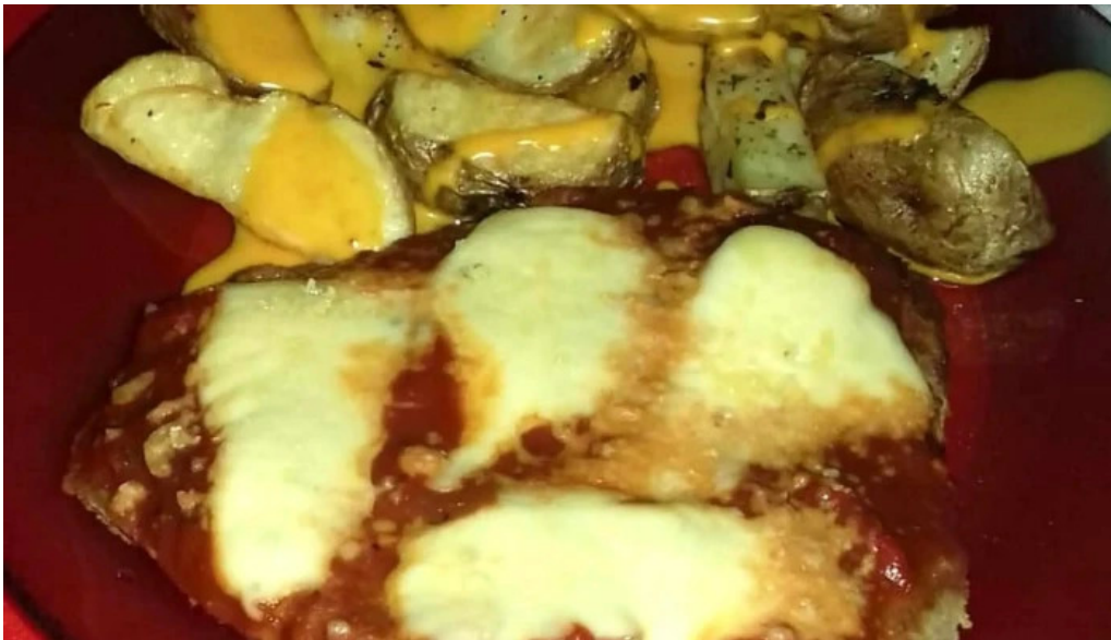
Panaderia el manjar comentario 8