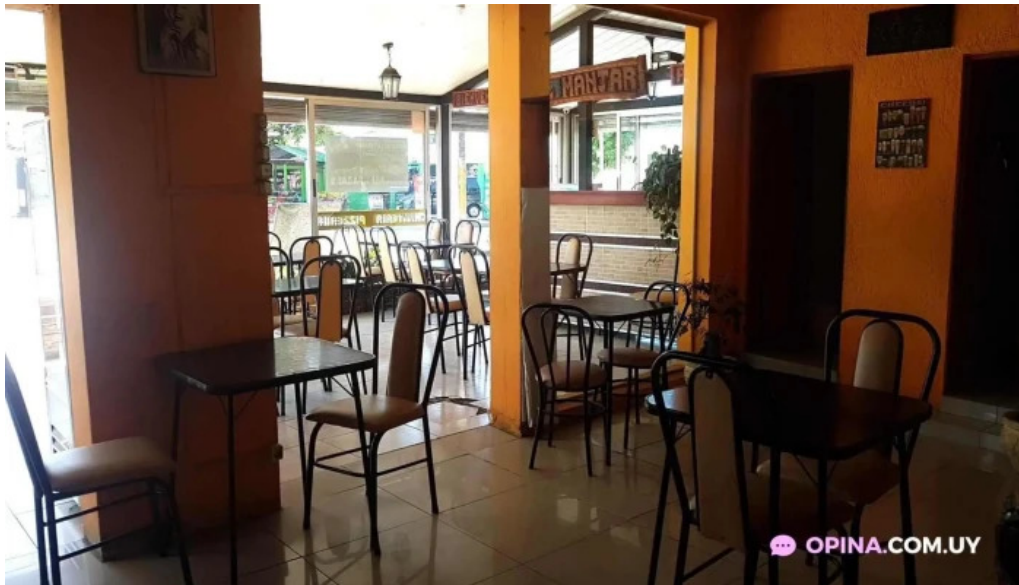
Panaderia el manjar montevideo