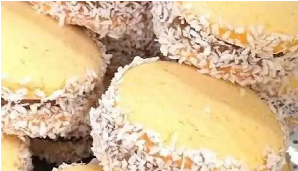
Panaderia dona blanca comida y bebida