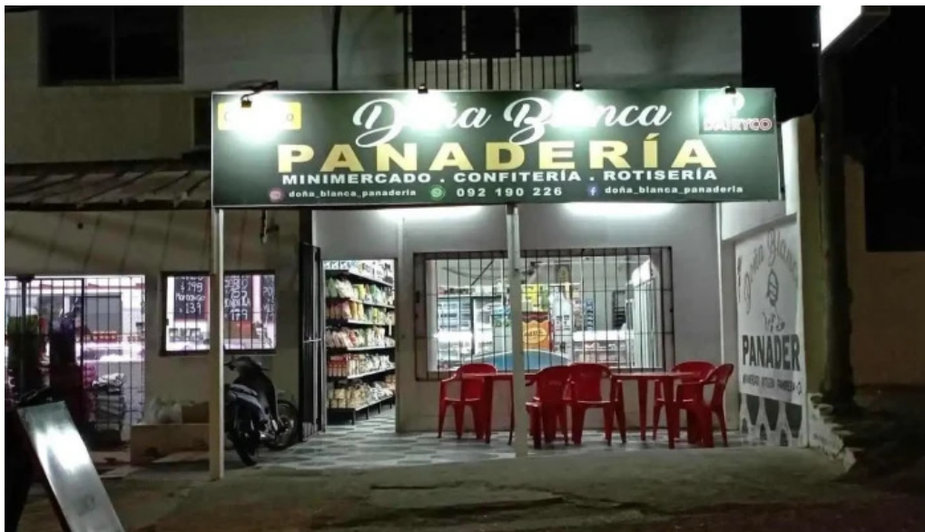
Panaderia dona blanca maldonado