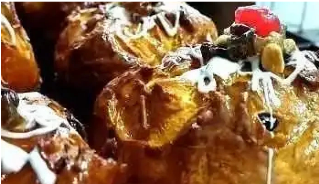
Panaderia dona blanca videos