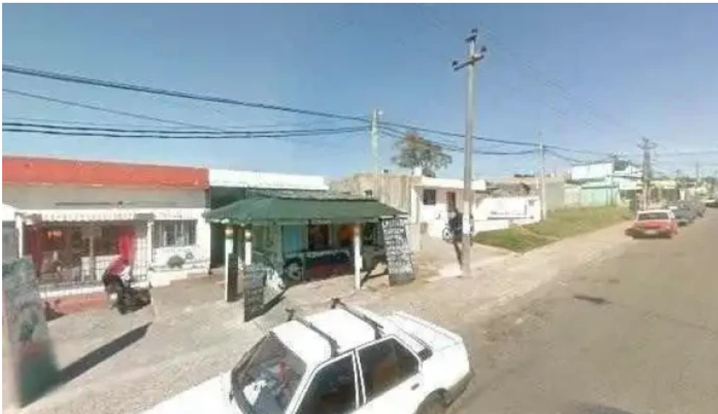
Panaderia dona blanca street view y 360