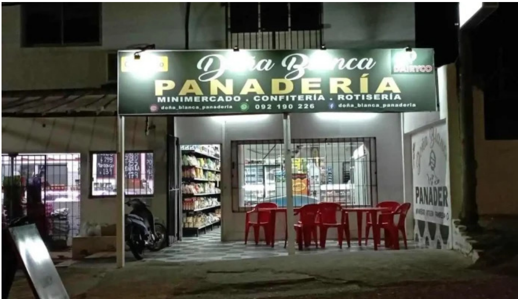
Panaderia dona blanca todas