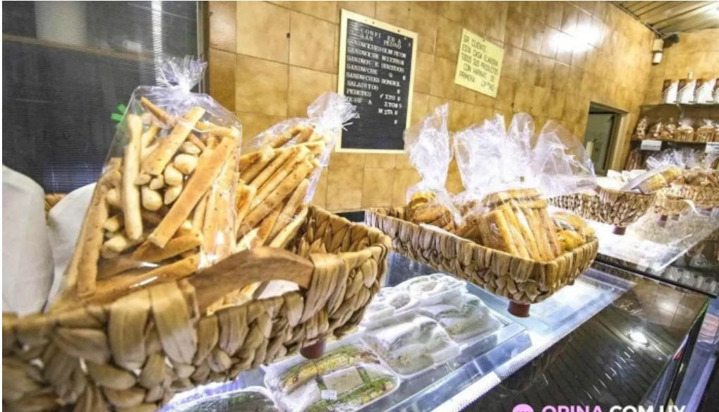
Panaderia san pedro comida y bebida