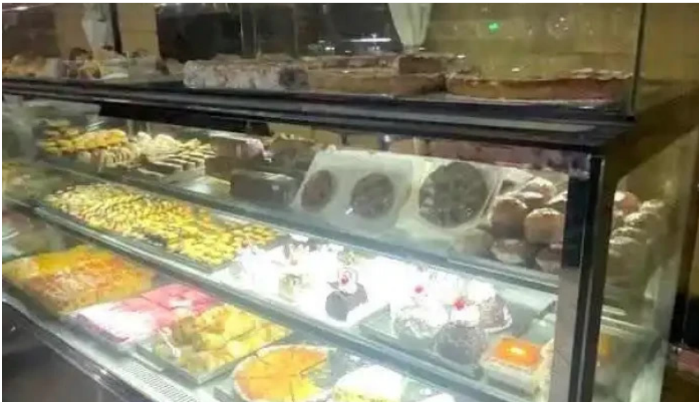
Panaderia san pedro videos