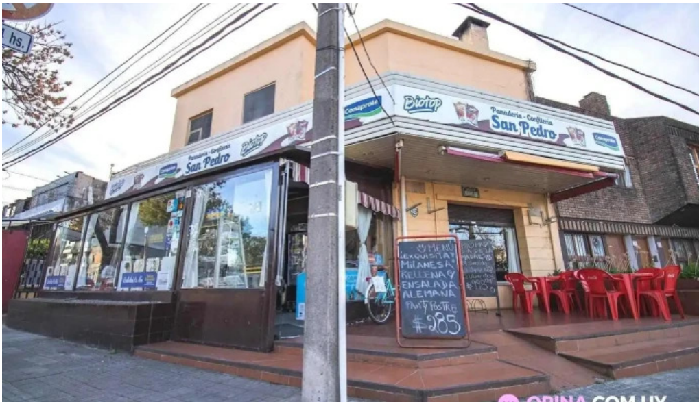
Panaderia san pedro todas