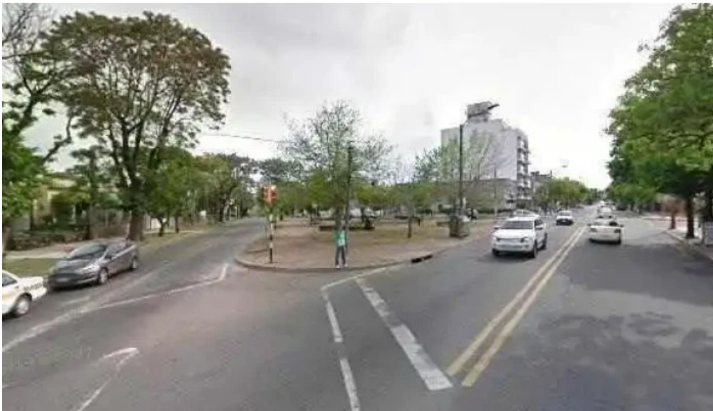
Panaderia san pedro street view y 360