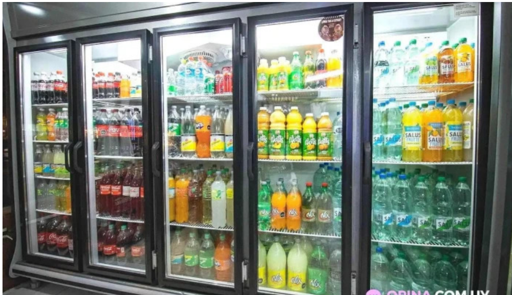
Panaderia san pedro ambiente