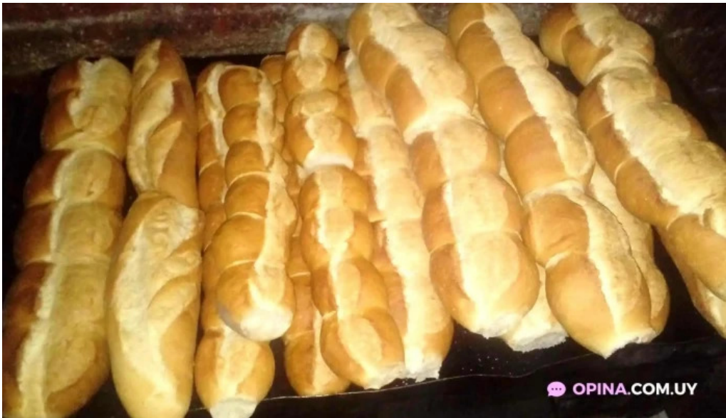
Panaderia san pedro baguette