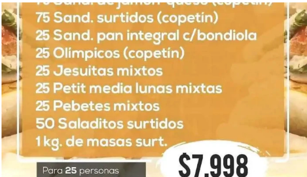
Panaderia san pedro menu