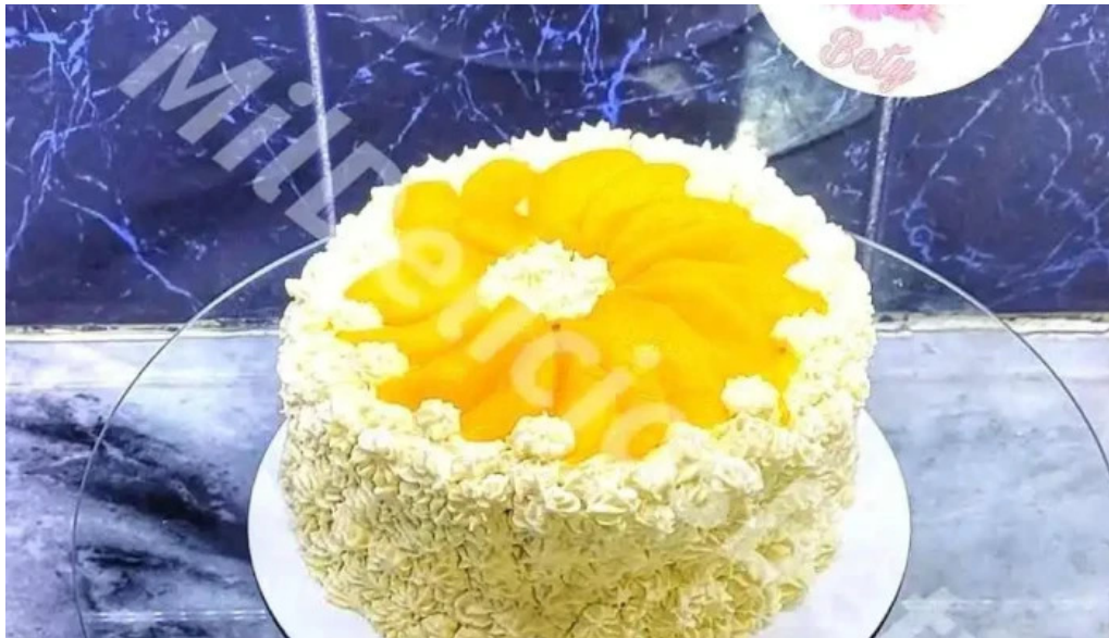
Mil delicias bety comida y bebida