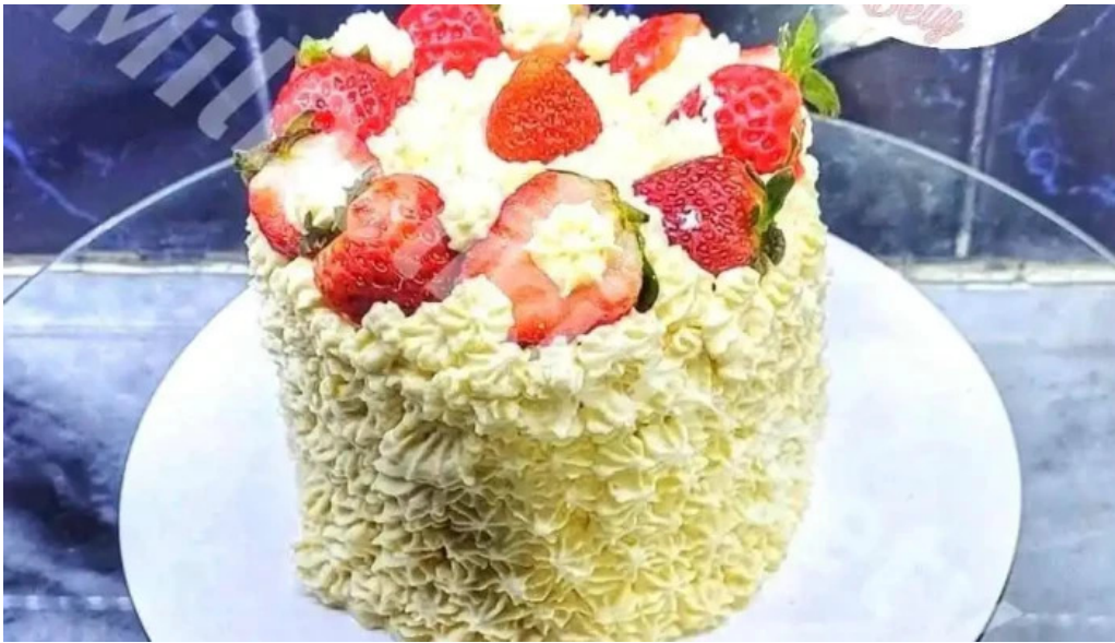
Mil delicios bety todas