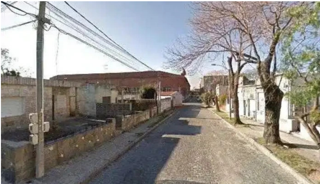
Mil delicios bety street view y 360