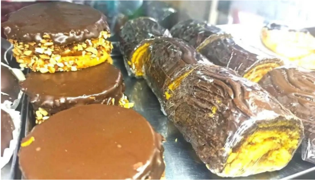
Don croissant masa