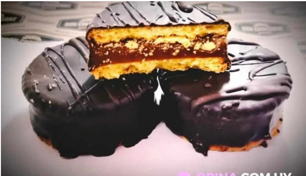
Don croissant pastel