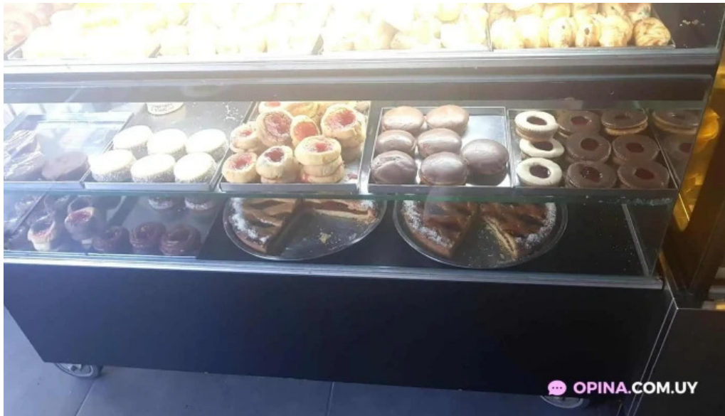
Don croissant ambiente