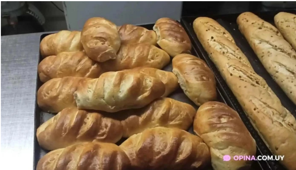
Don croissant videos