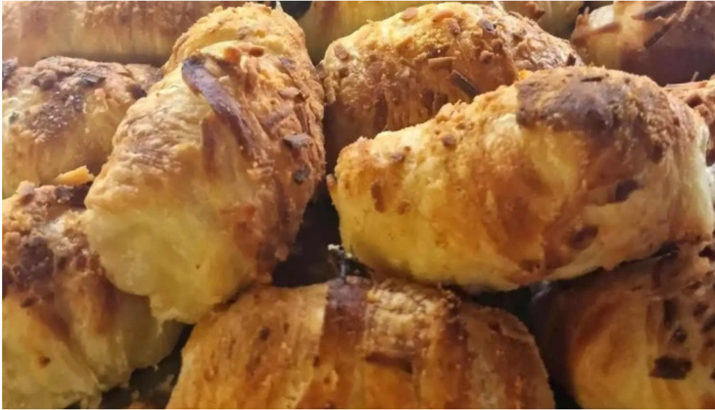
Don croissant del propietario