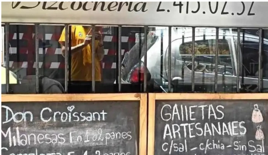
Don croissant menu