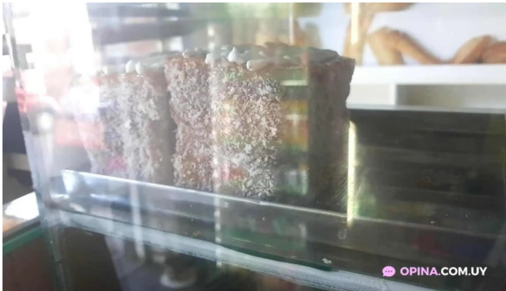
Don croissant vitrina