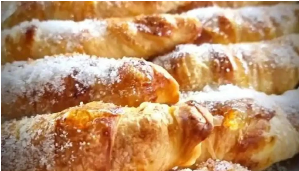
Don croissant comida y bebida