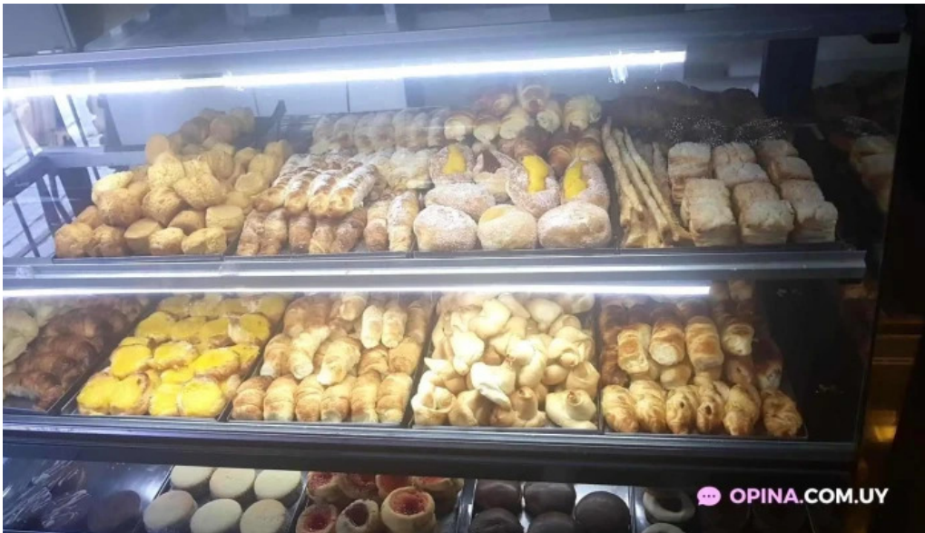
Don croissant todas