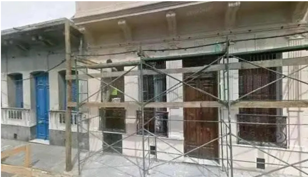
Don croissant street view y 360