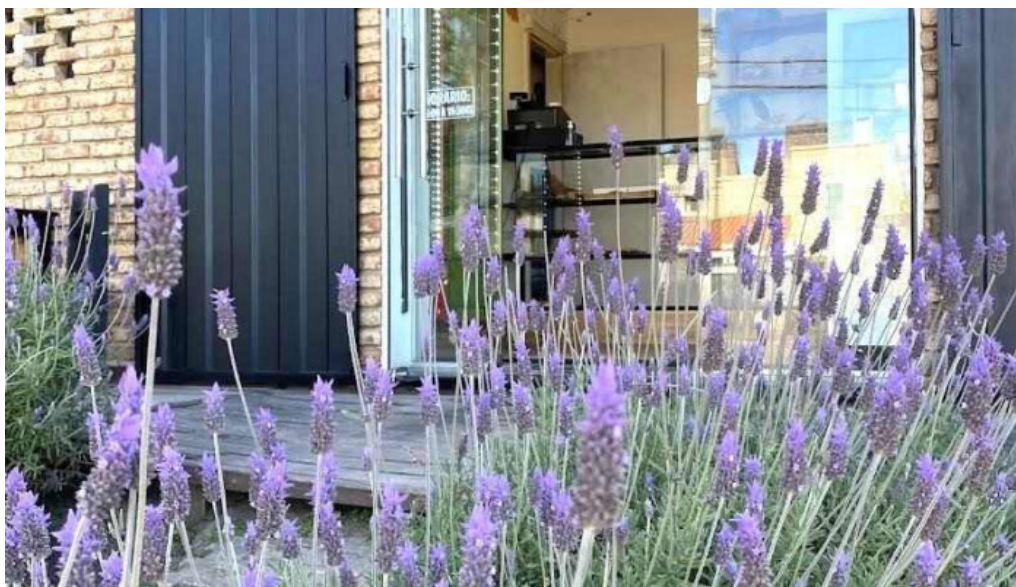
Atelier del sabor del propietario