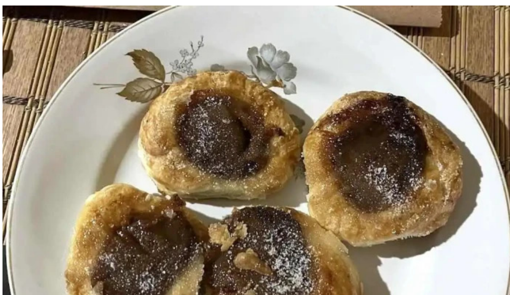
Atelier del sabor comida y bebida