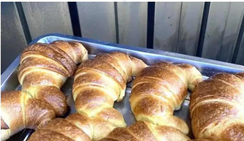
Atelier del sabor todas