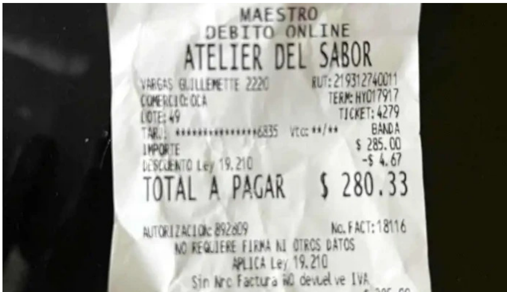
Atelier del sabor mas recientes