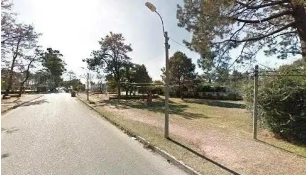
Atelier del sabor street view y 360