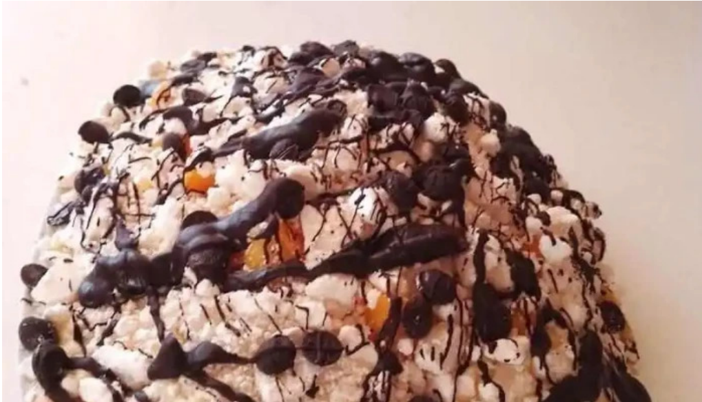
Malu panaderia confiteria y rotiseria comida y bebida