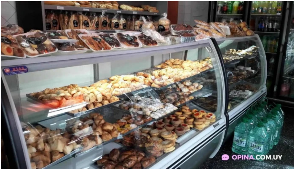
Malu panaderia confiteria y rotiseria ambiente