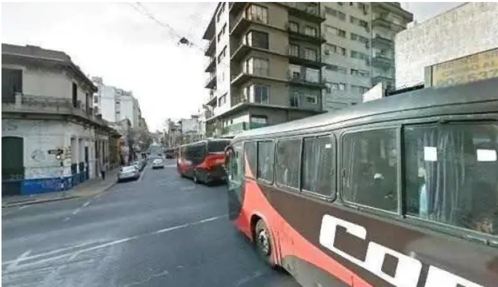
Malu panaderia confiteria y rotiseria street view y 360