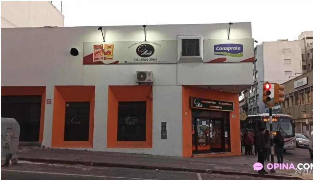
Malu panaderia confiteria y rotiseria todas