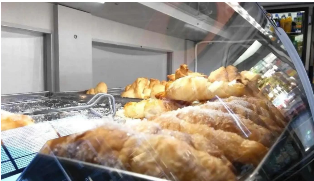
Malu panaderia confiteria y rotiseria vitrina