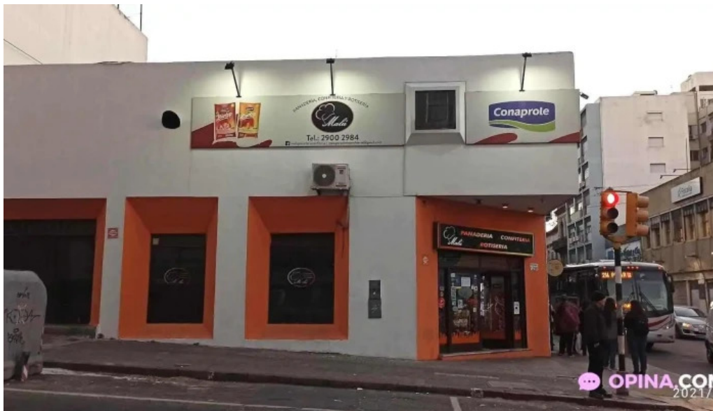
Malu panaderia confiteria y rotiseria montevideo