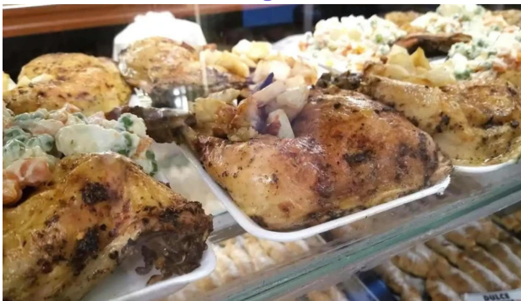
La reina del pan vitrina