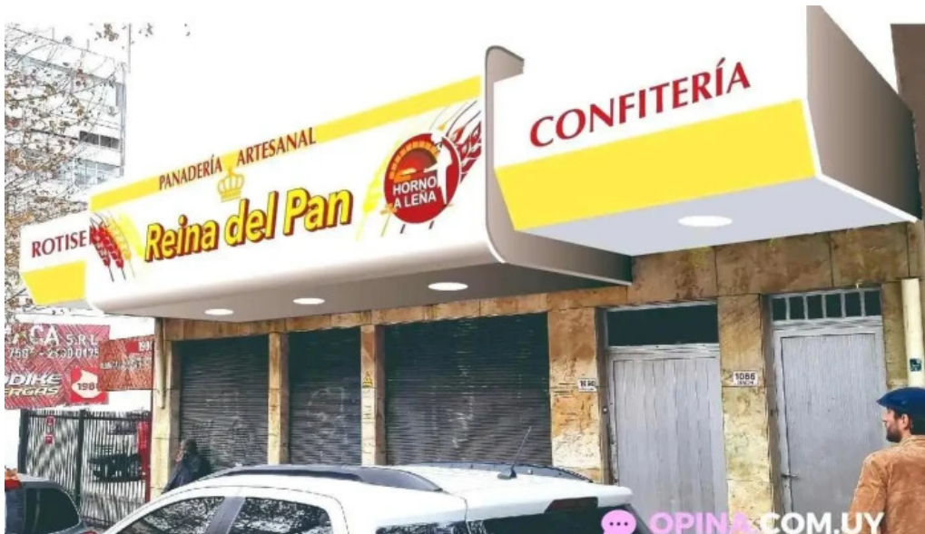
La reina del pan mas recientes