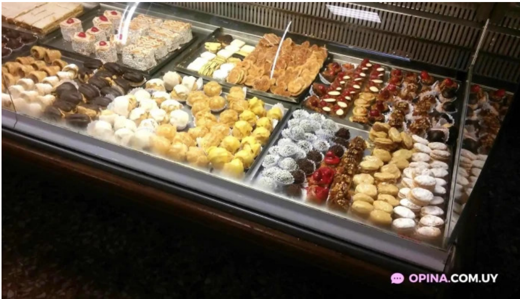
La reina del pan pastel