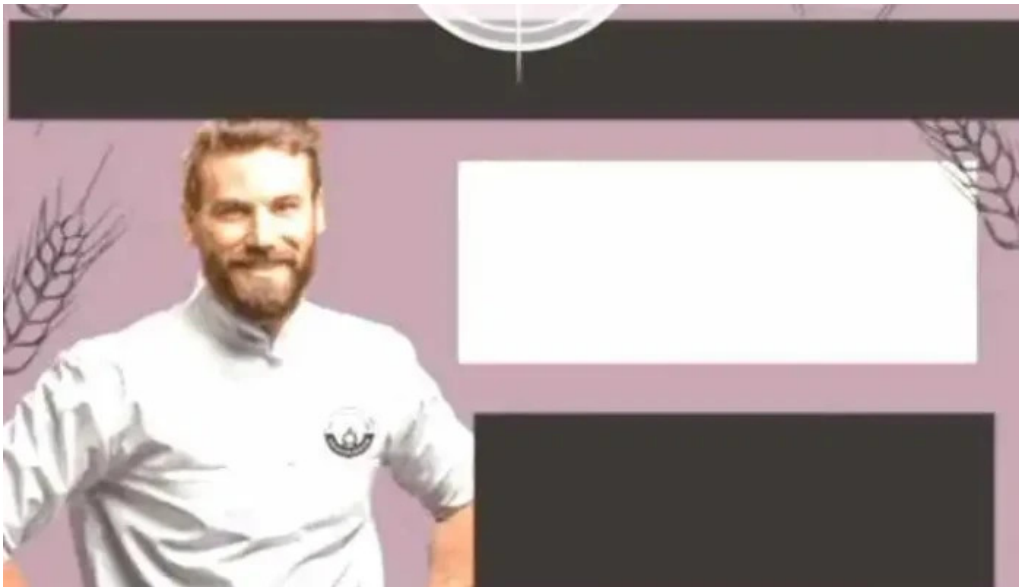
La reina del pan videos