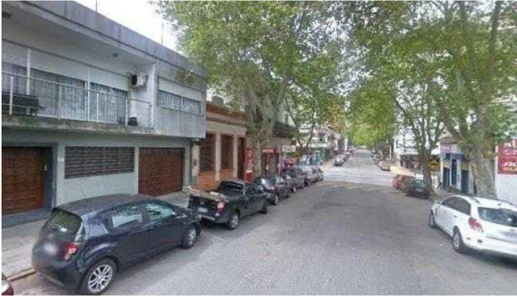
La reina del pan street view y 360