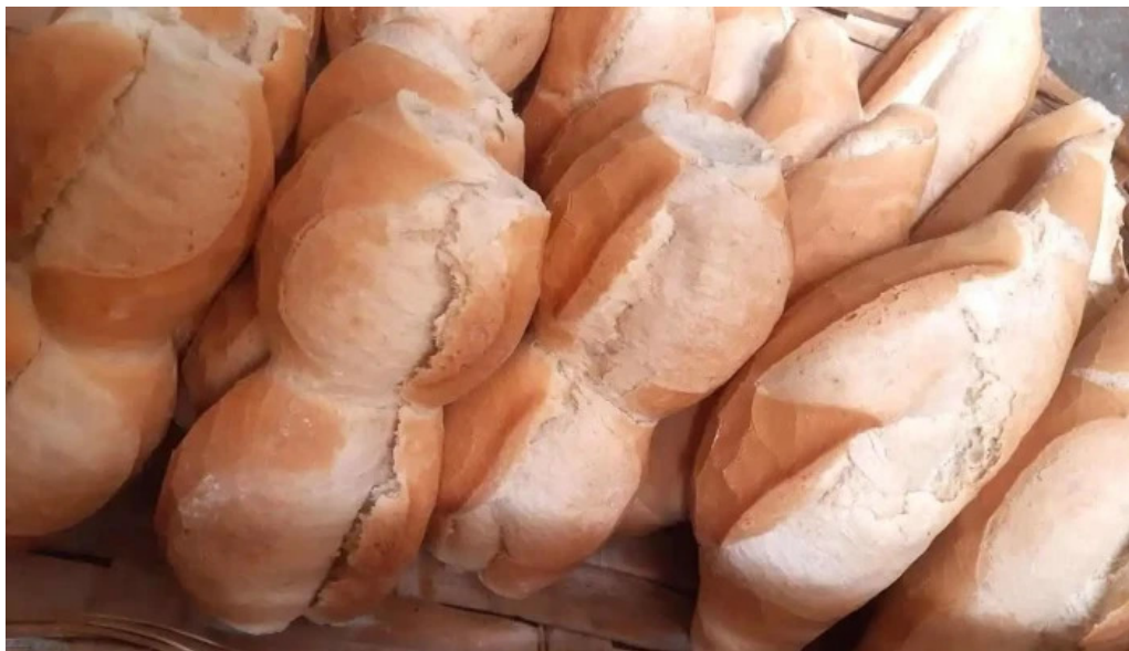
La reina del pan del propietario