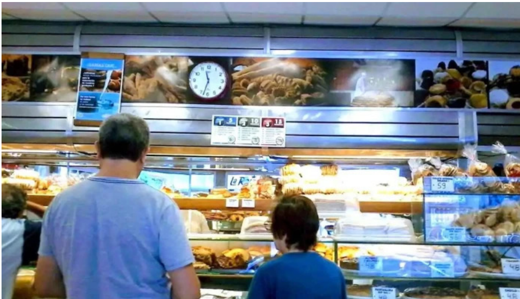
La reina del pan ambiente