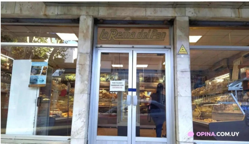
La reina del pan todas