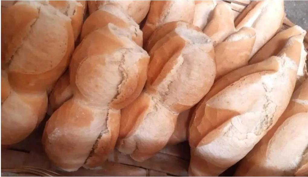
La reina del pan comida y bebida