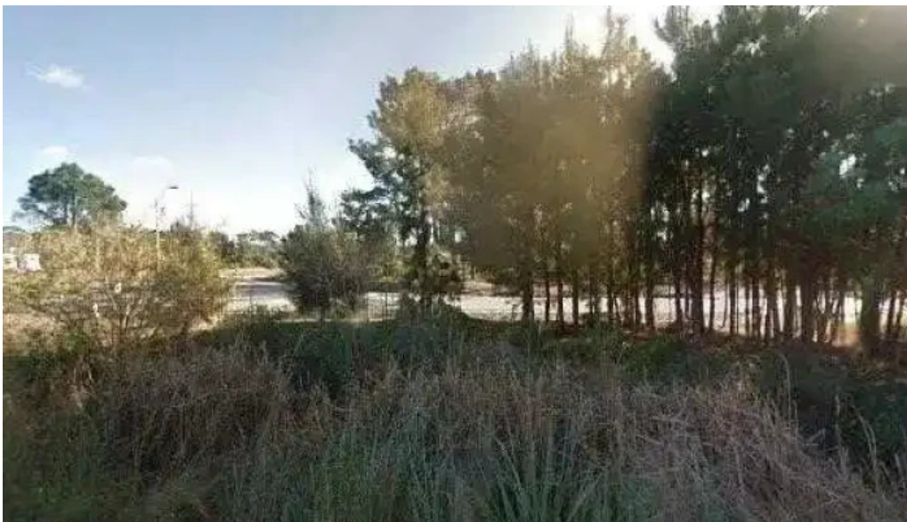
Pan y co street view y 360