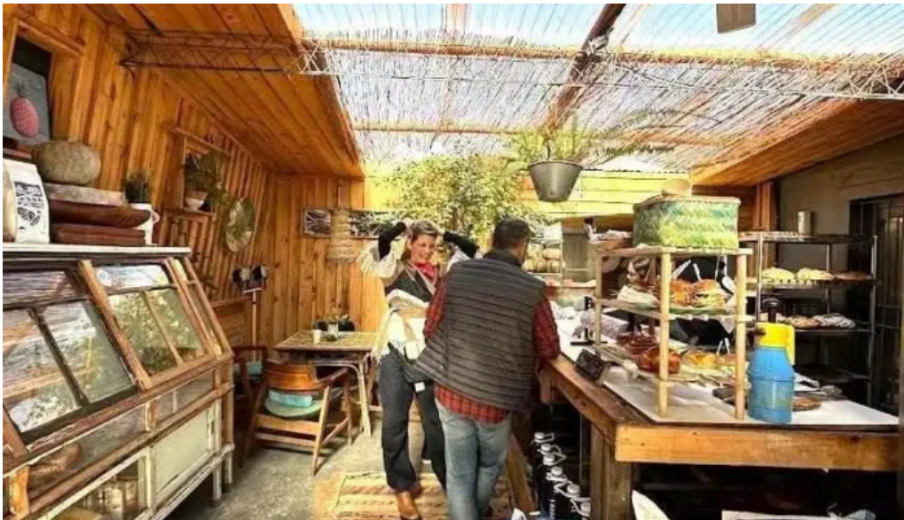
Pan y co ciudad de la costa