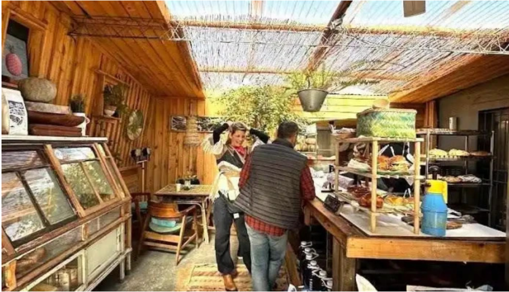
Pan y co todas