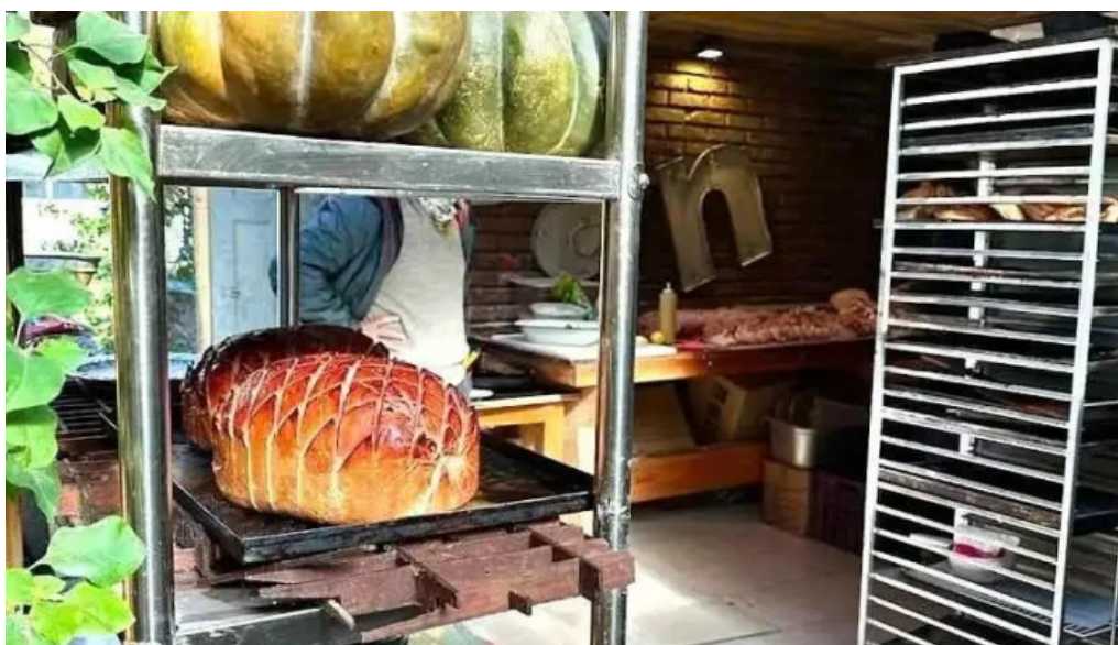
Pan y co ambiente