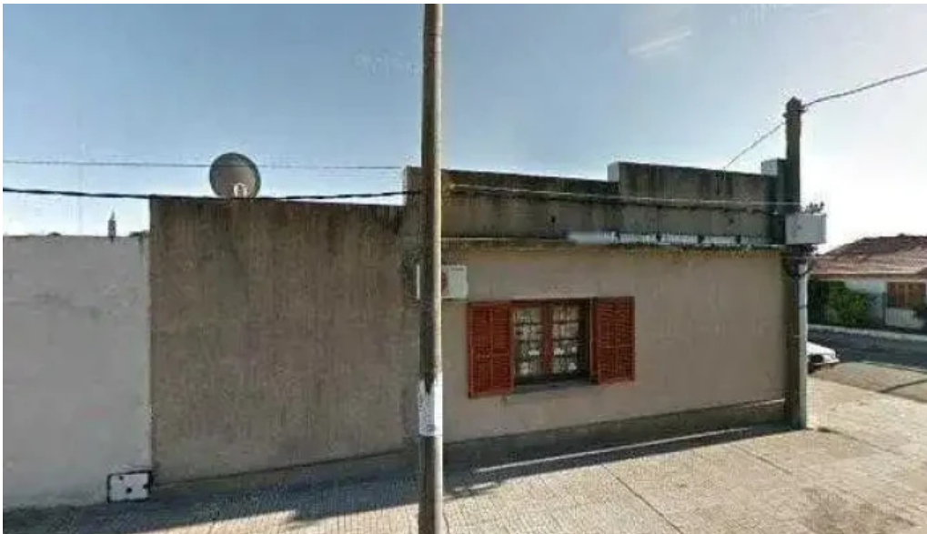
Adeom rio negro descuentos