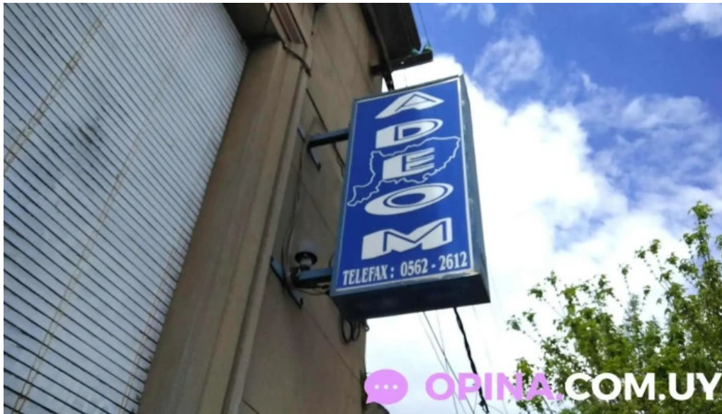
Adeom rio negro fray bentos