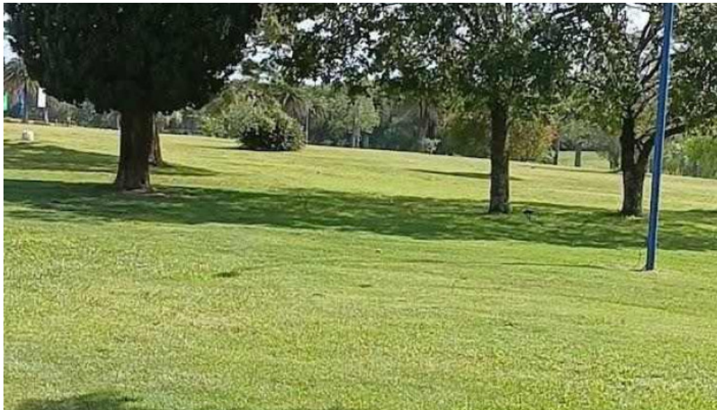
Granja arenas mas recientes