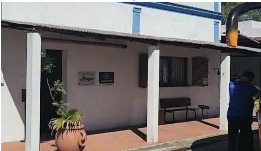
Granja arenas videos