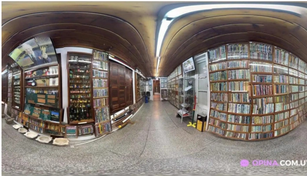
Granja arenas street view y 360