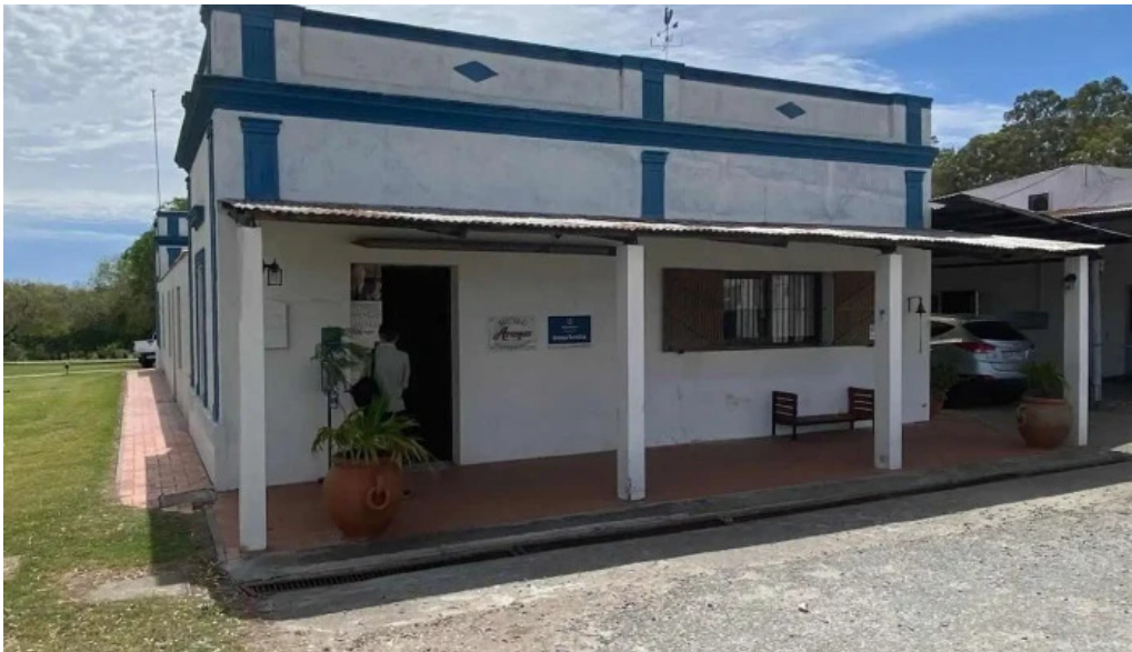
Granja arenas el quinton