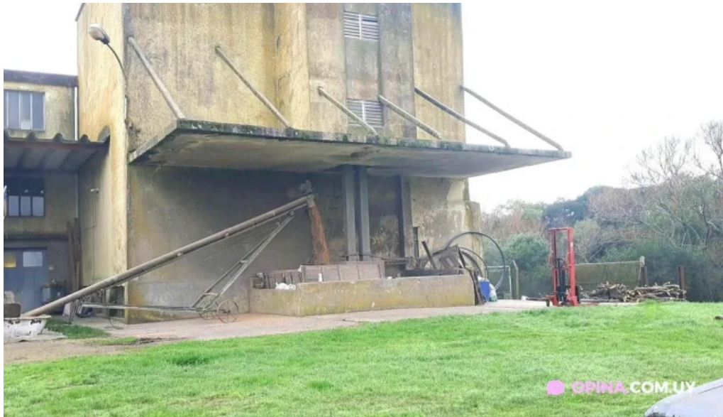
Molino viejo pan de azucar pan de azucar