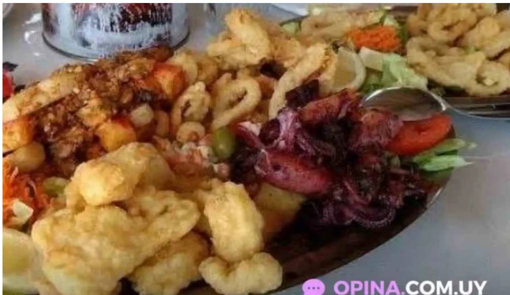
Puertito don anselmo picada