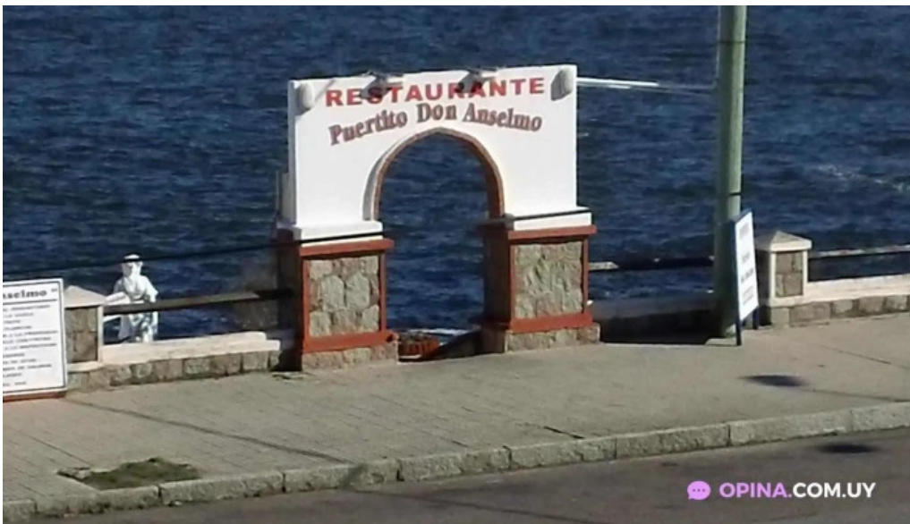
Puertito don anselmo todas