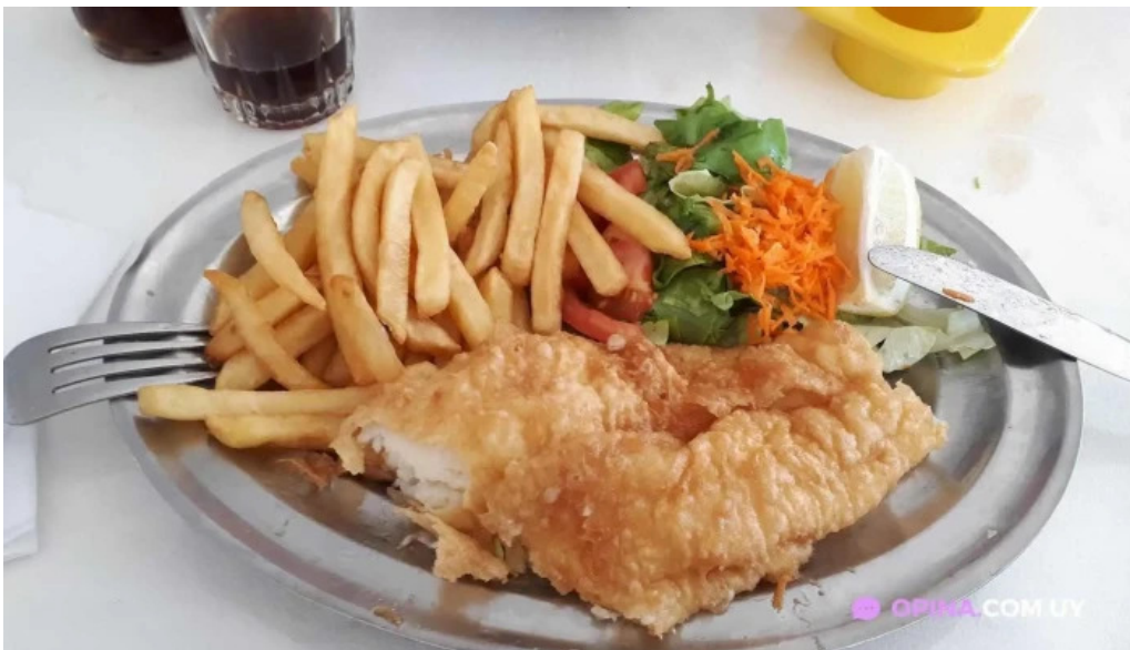
Puertito don anselmo fish and chips