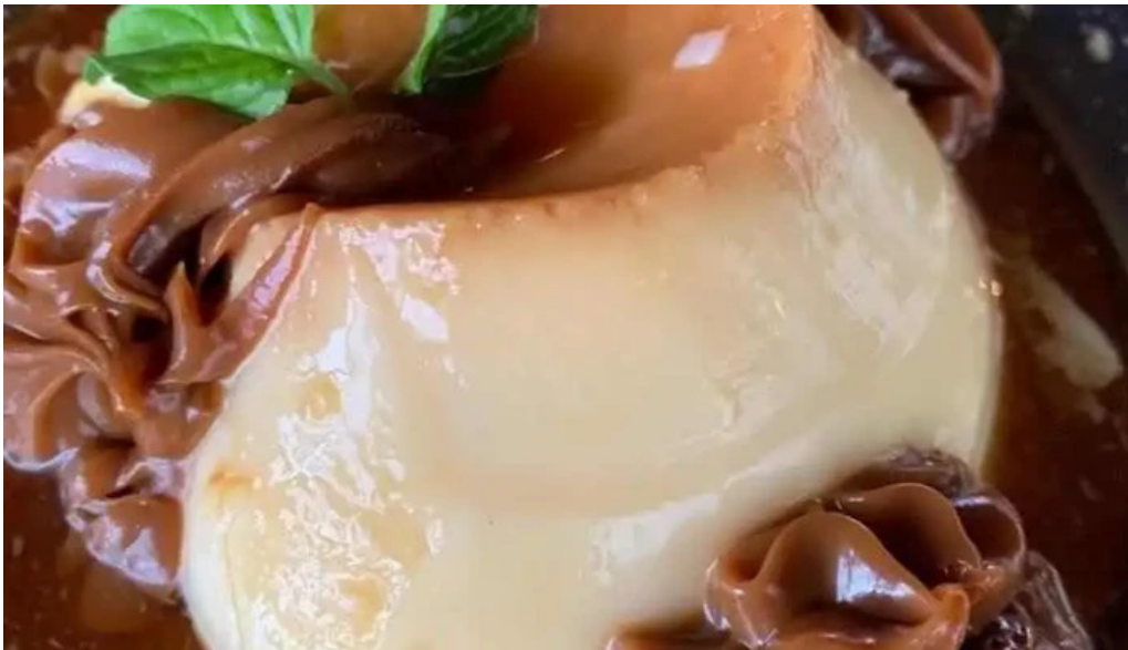
Puertito don anselmo flan