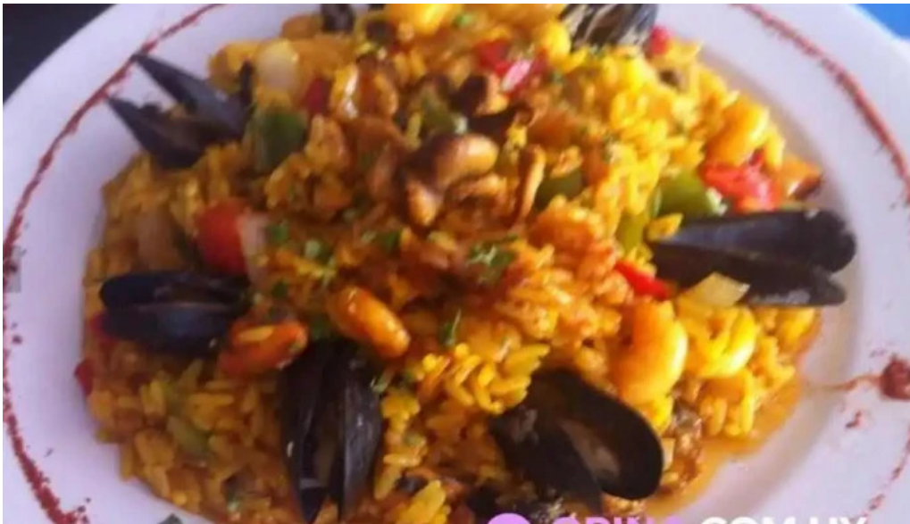
Puertito don anselmo paella