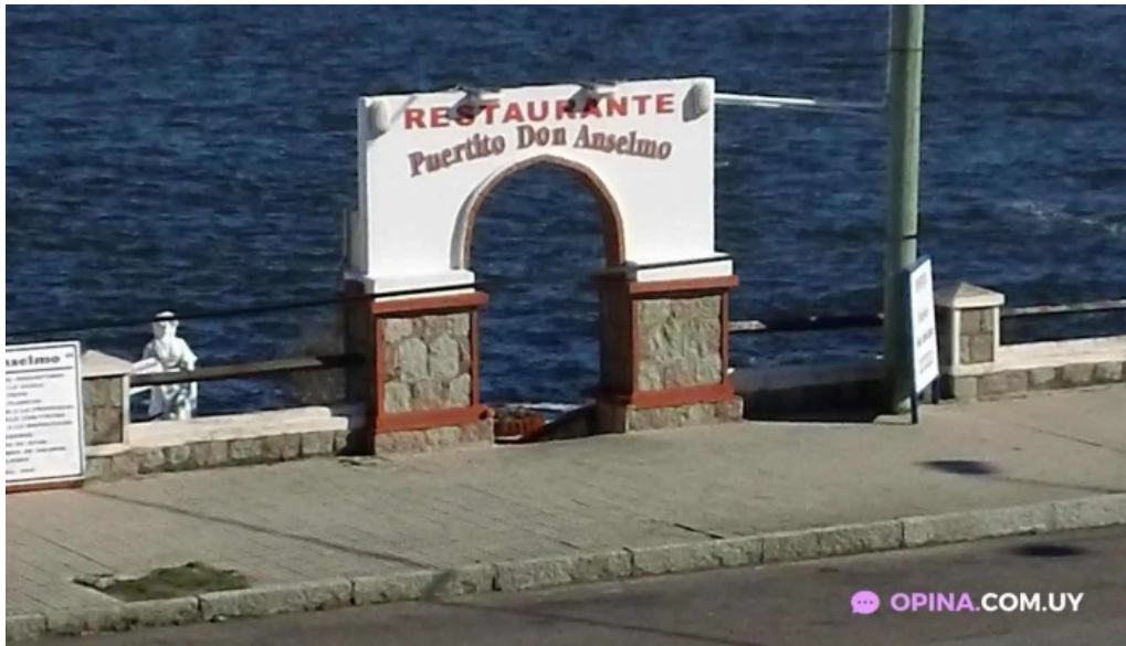
Puertito don anselmo piriapolis