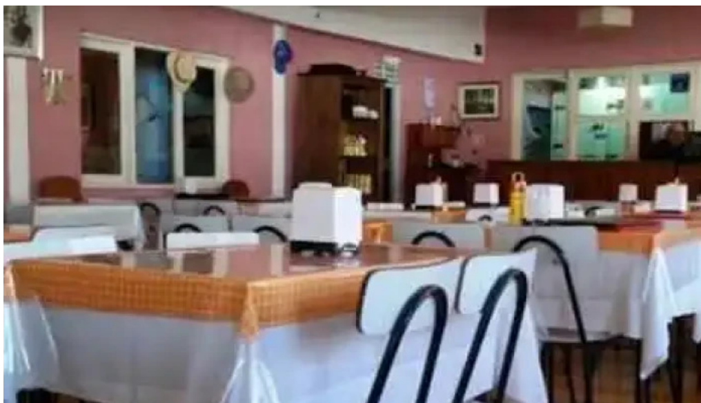
Puertito don anselmo ambiente