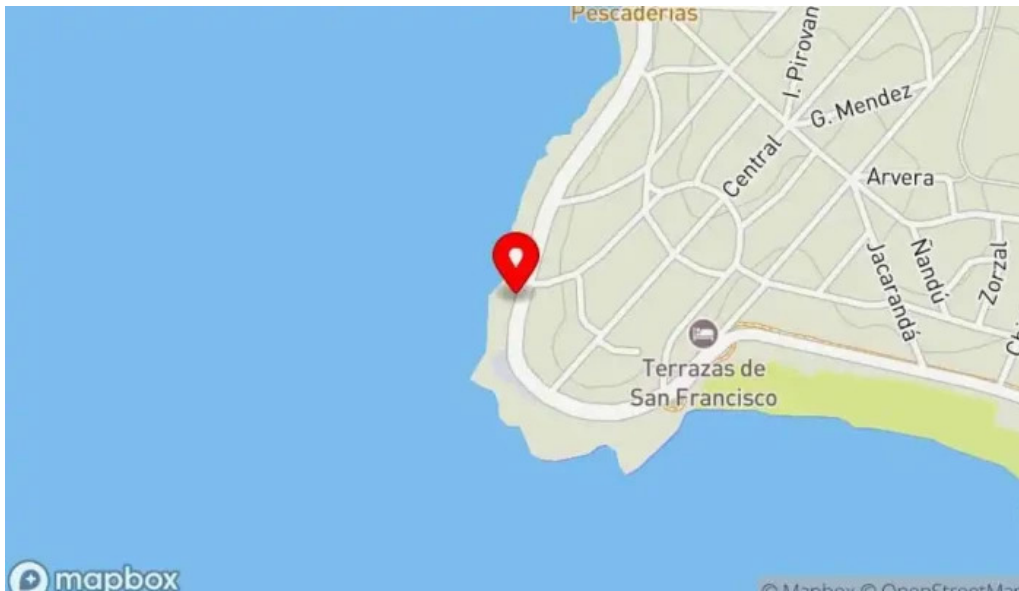
Puertito don anselmo mapa