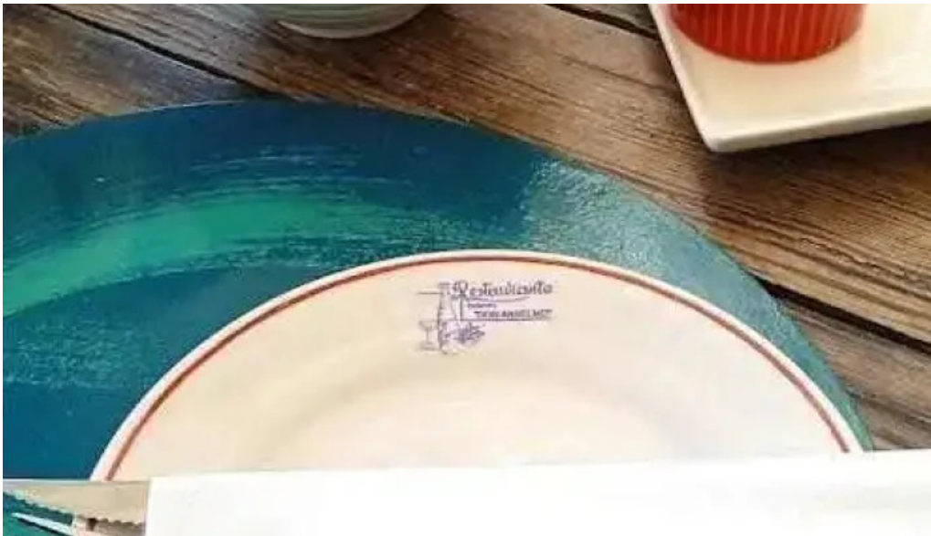
Puertito don anselmo mas recientes