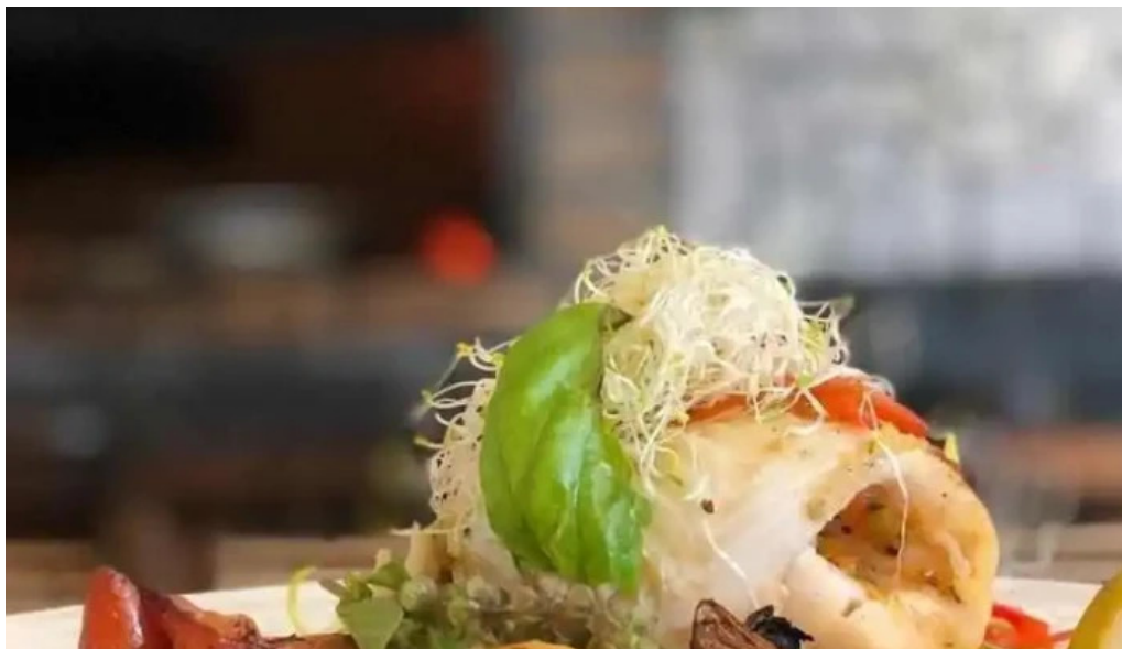
Puertito don anselmo comida y bebida