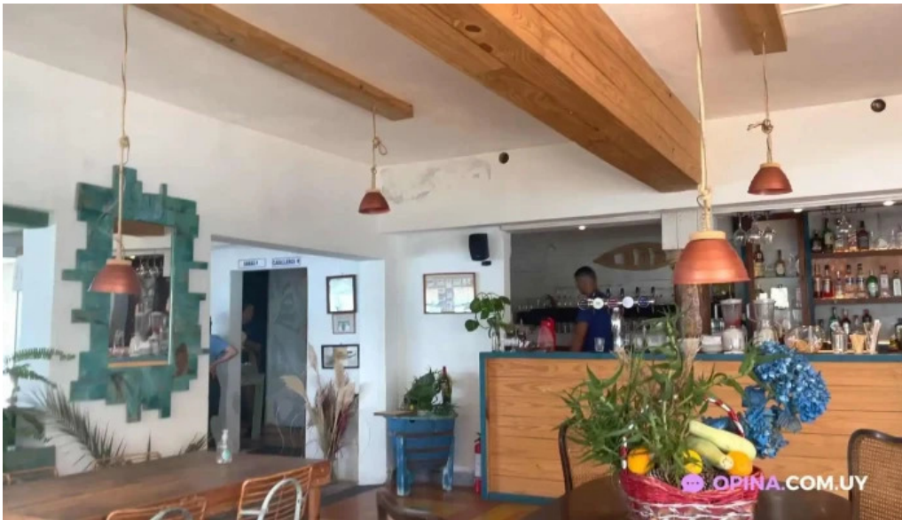
Puertito don anselmo videos