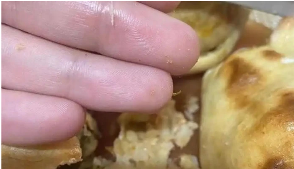
Fresco mar comida y bebida