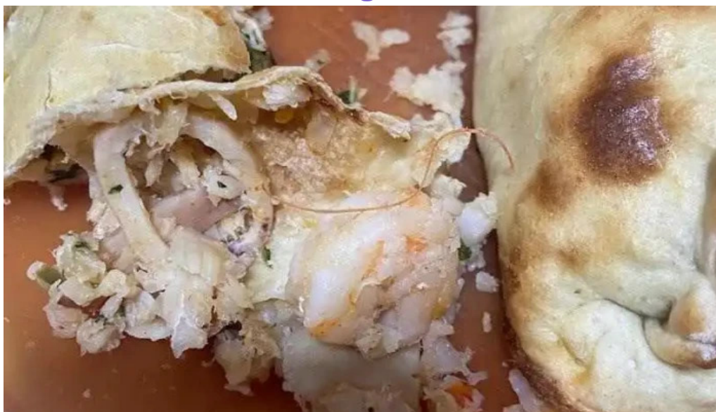
Fresco mar todas