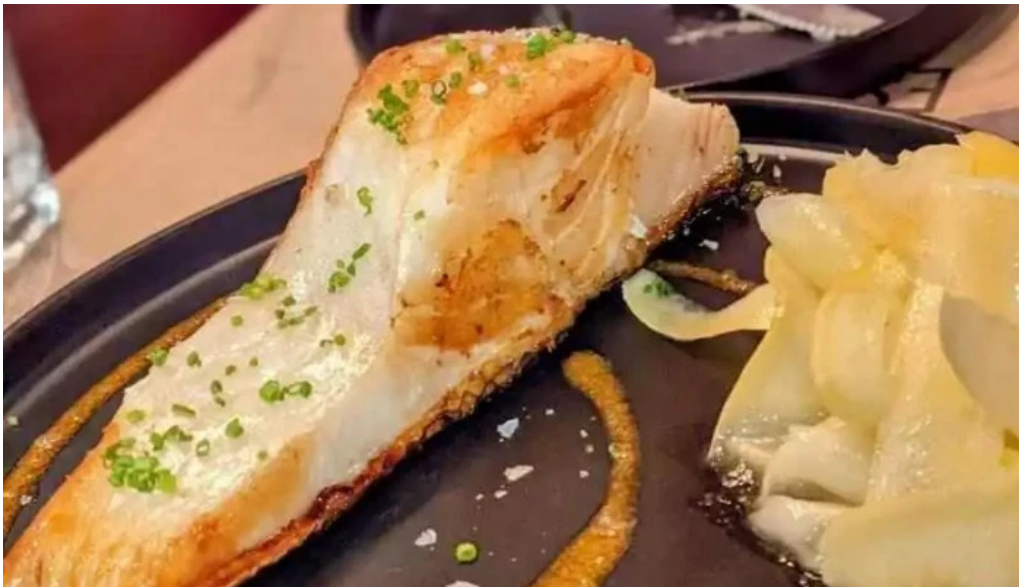
Es mercat ceviche