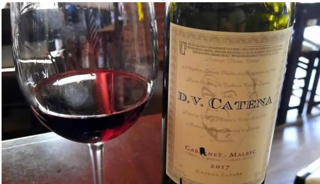
Es mercat vino