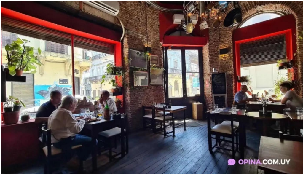
Es mercat todas