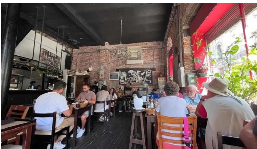
Es mercat ambiente