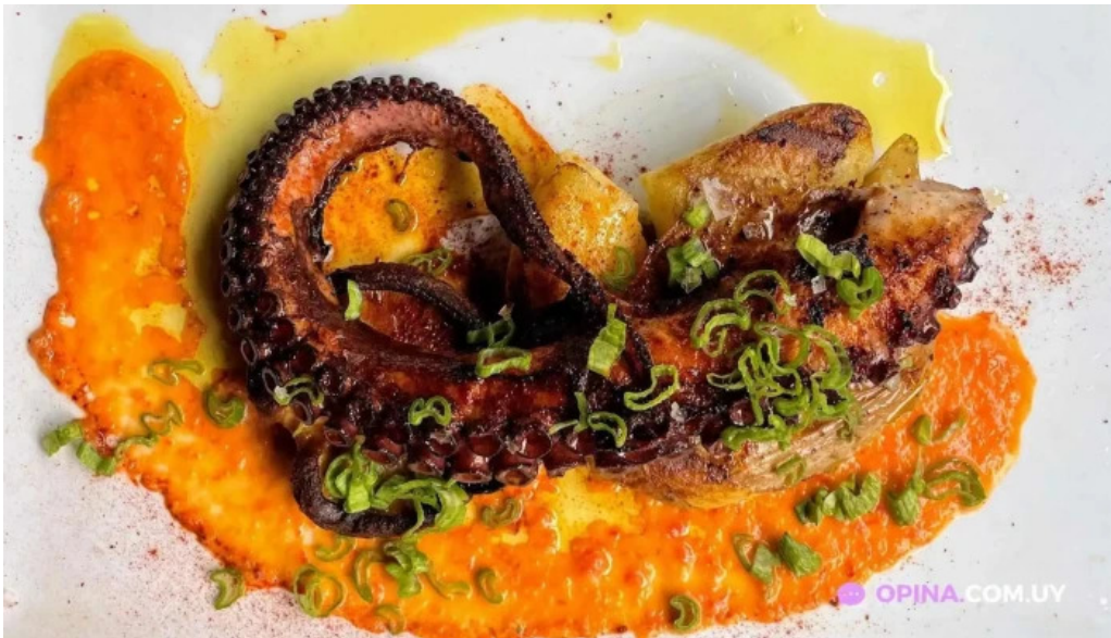
Es mercat pulpo