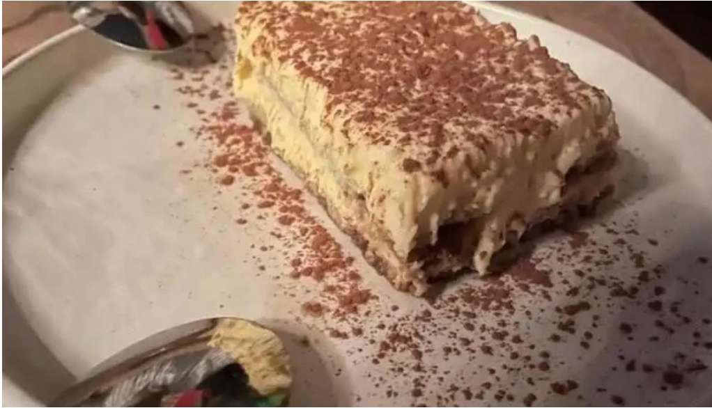
Es mercat tiramisu