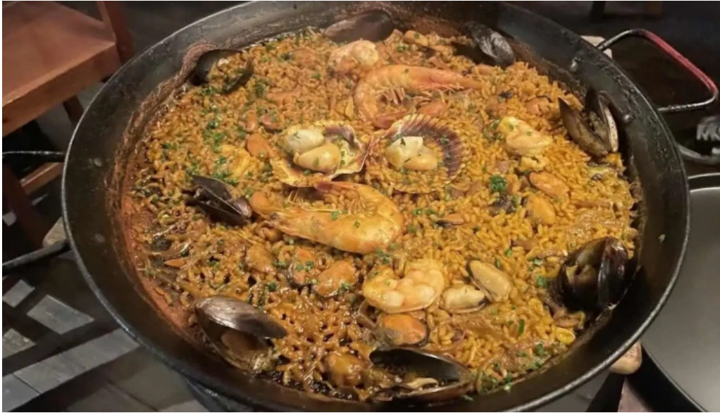
Es mercat paella