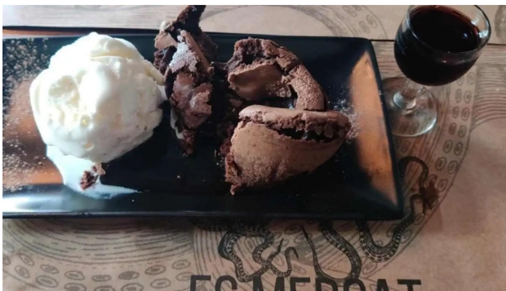
Es mercat brownie