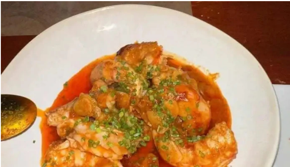
Es mercat gambas al ajillo