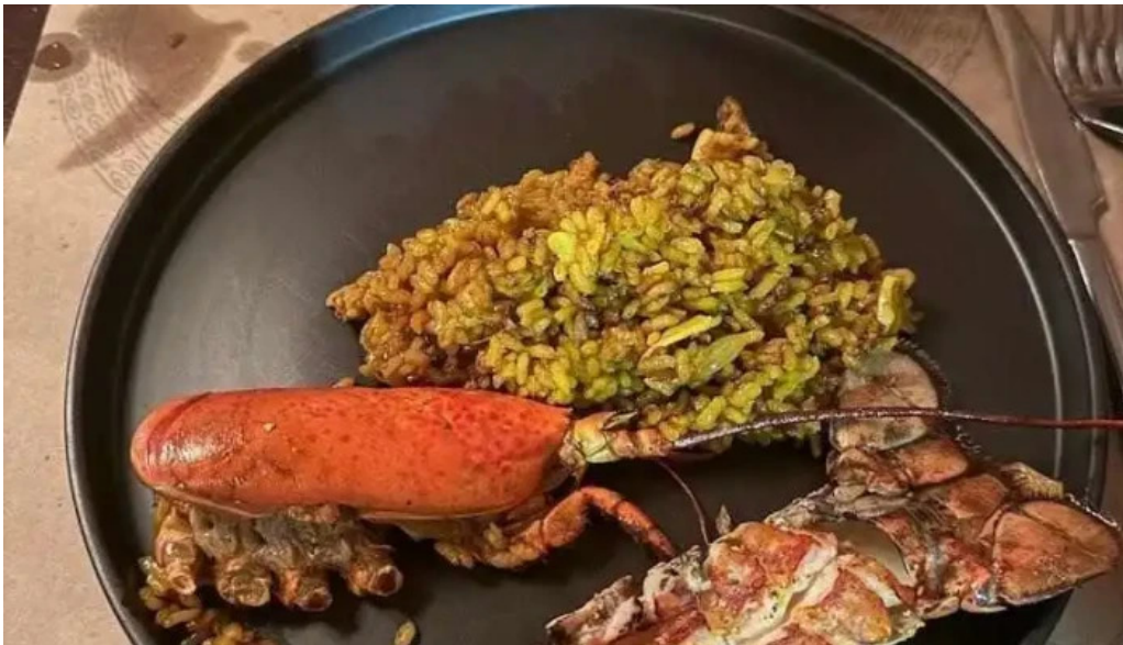
Es mercat filete