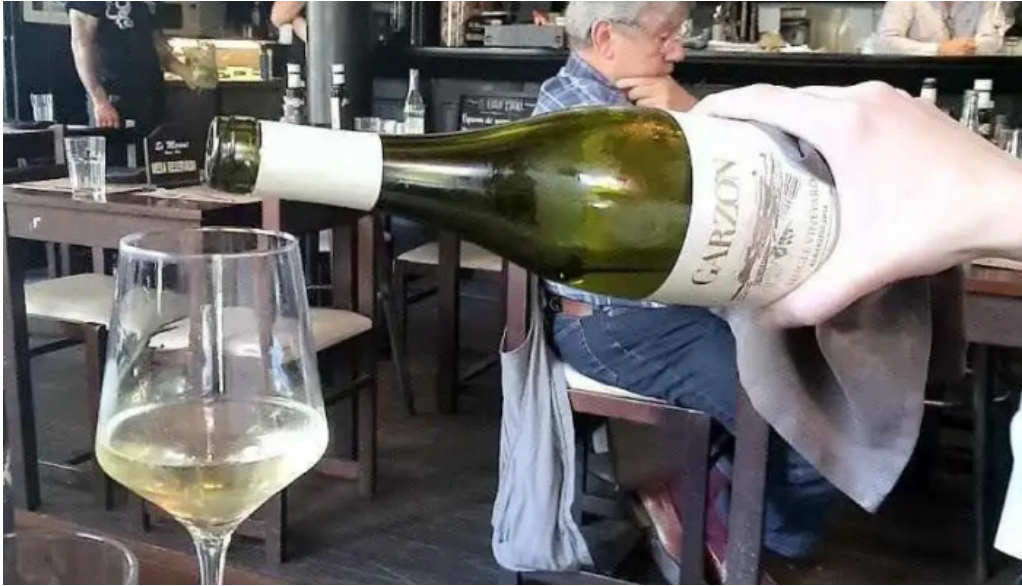
Es mercat videos