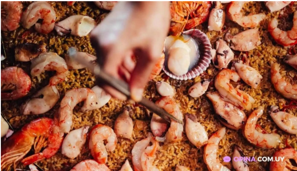
Es mercat del propietario