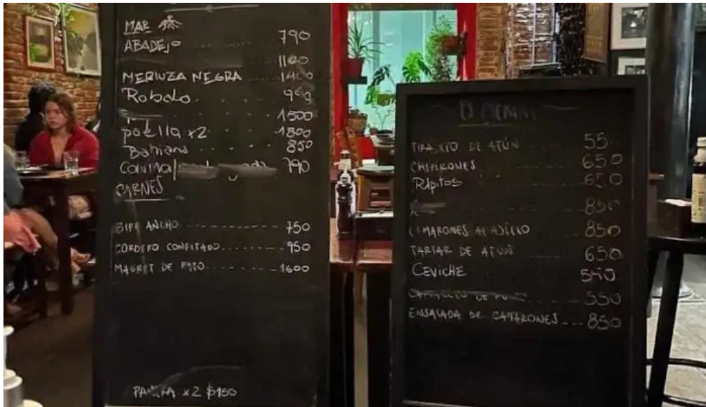
Es mercat menu