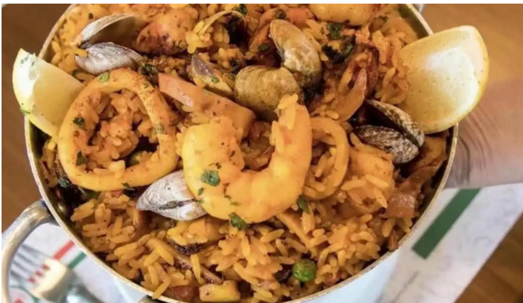
El italiano paella