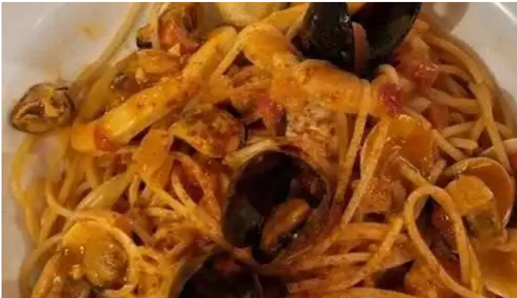
El italiano espagueti