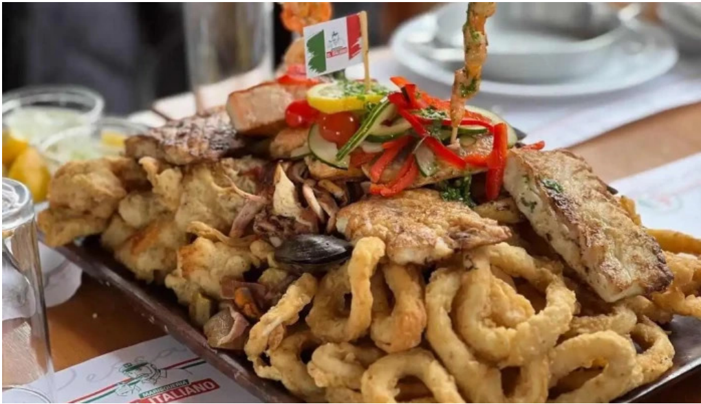
El italiano picada