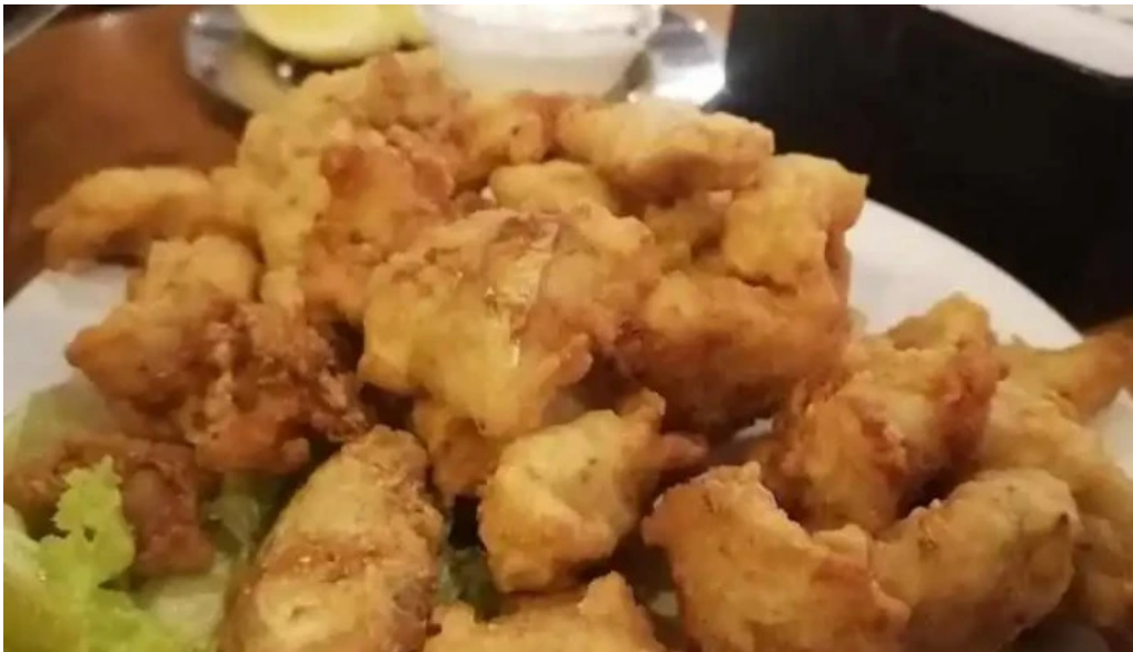
El italiano gamba frita