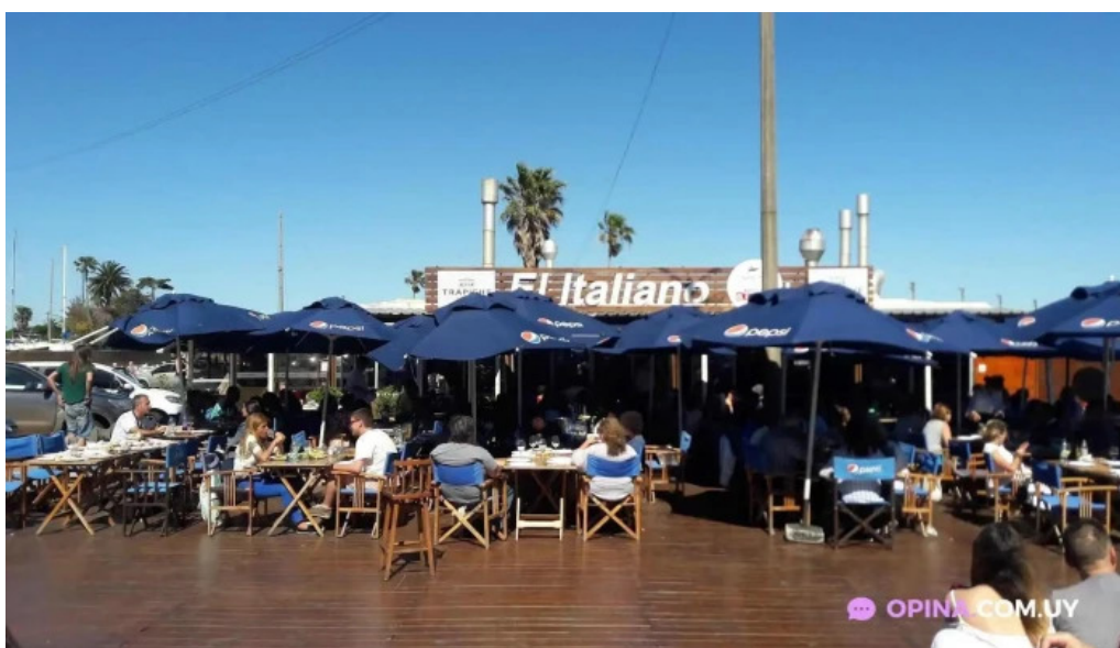
El italiano ambiente