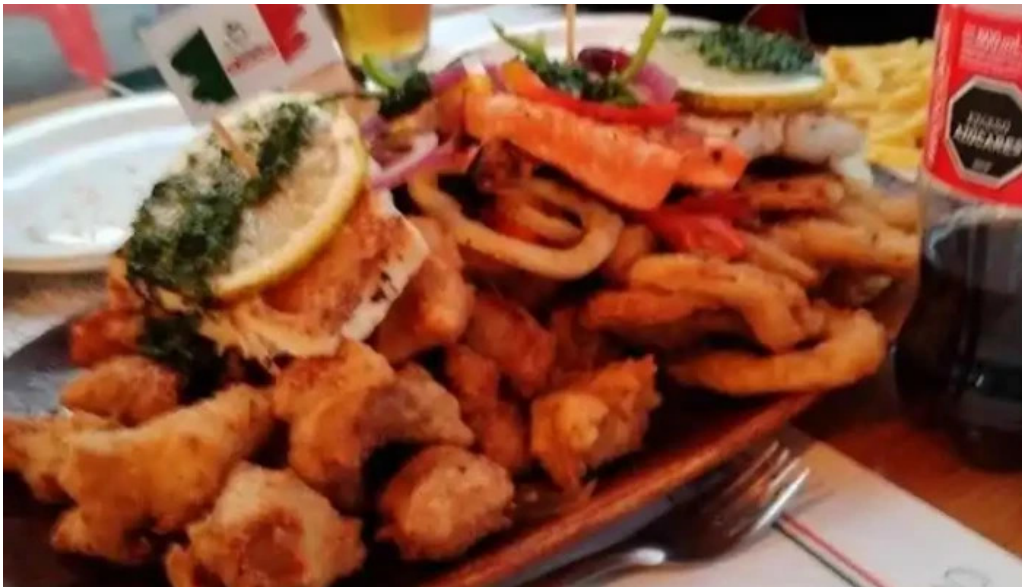
El italiano mas recientes