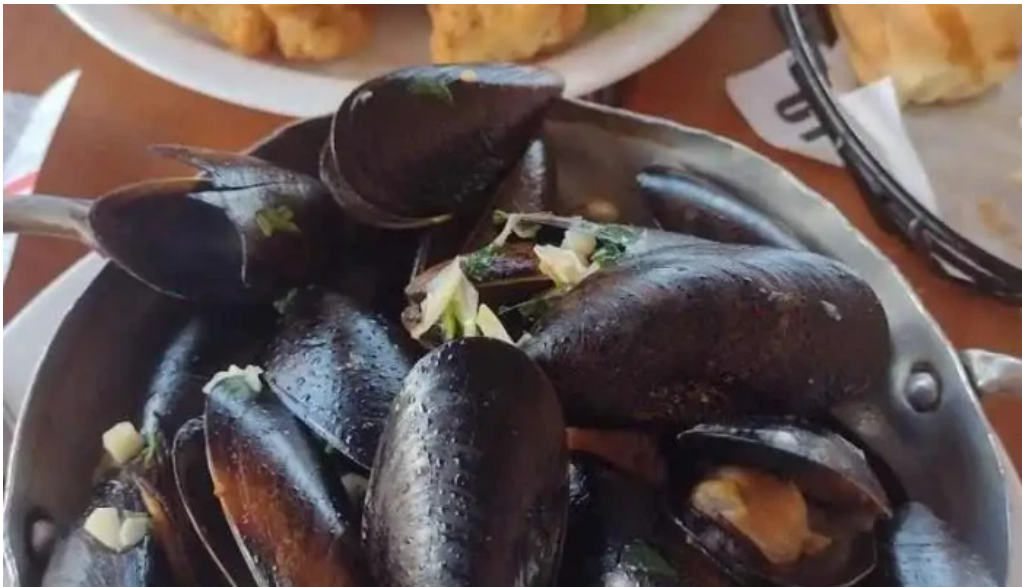
El italiano mejillon