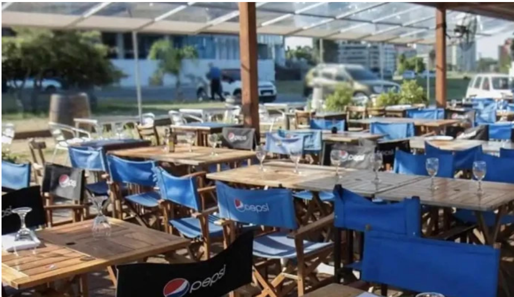
El italiano montevideo