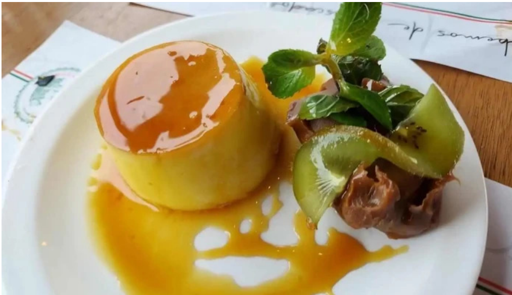
El italiano flan