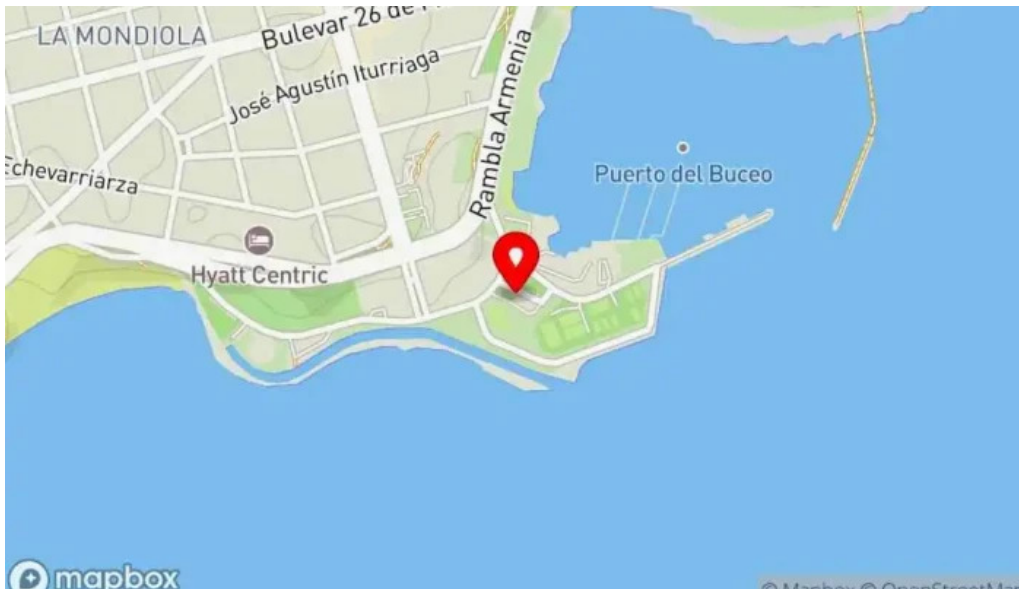
El italiano mapa