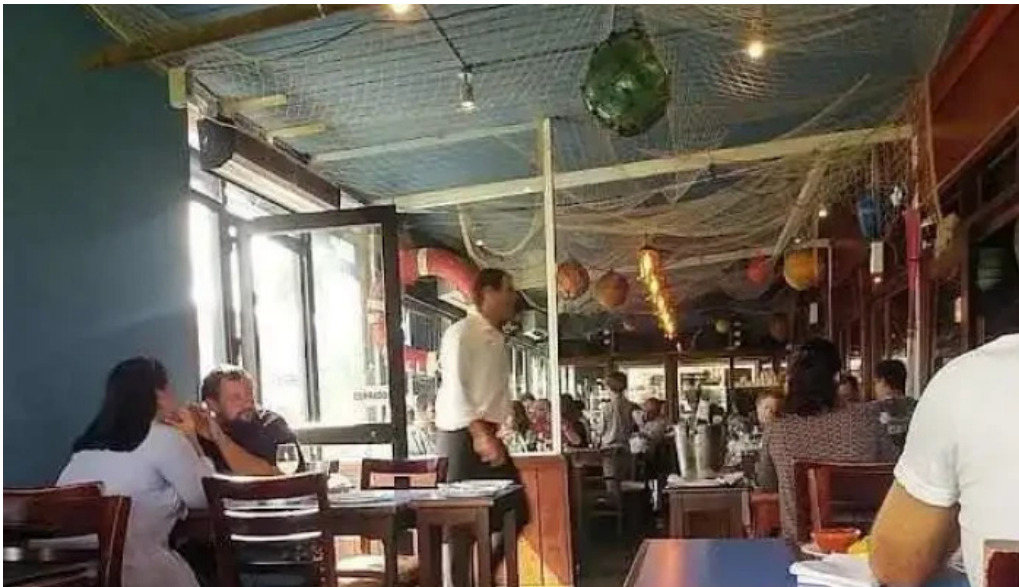
El italiano comida y bebida