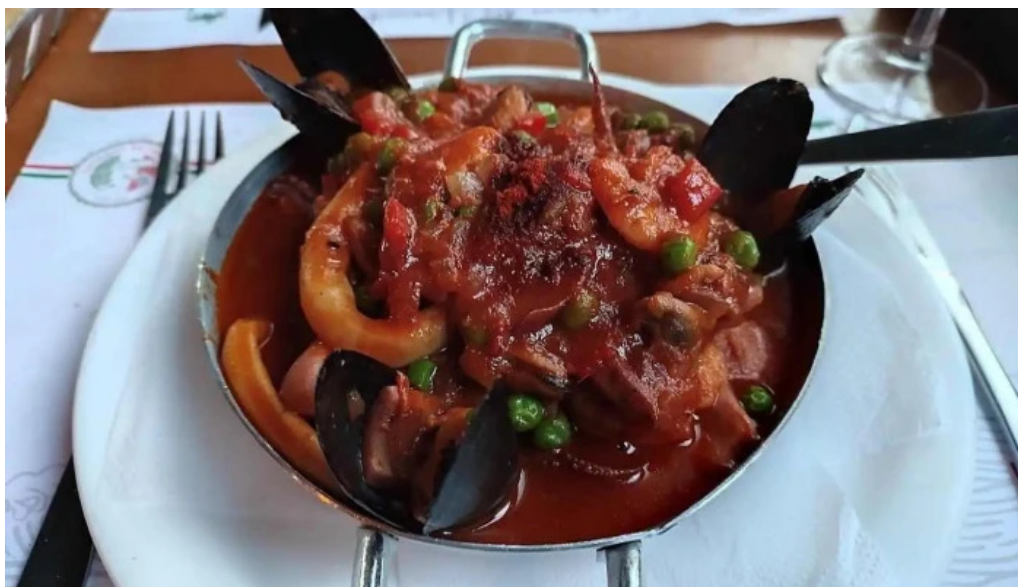
El italiano comida de mar