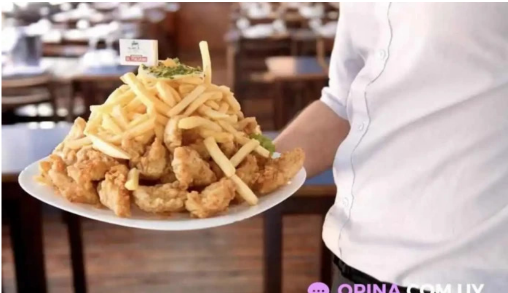
El italiano del propietario