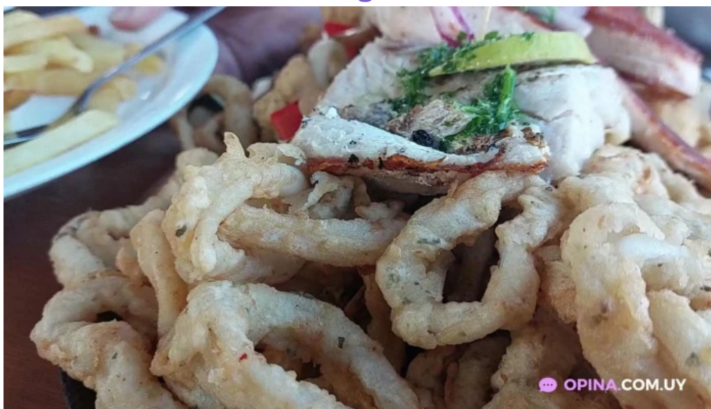
El italiano videos