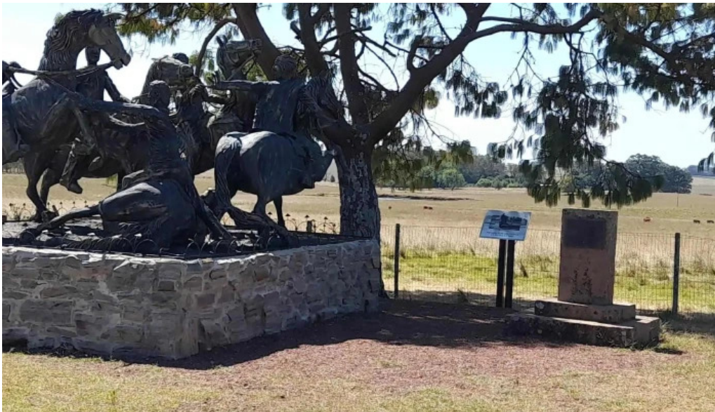
Monumento a la batalla de tupambae comentario 1