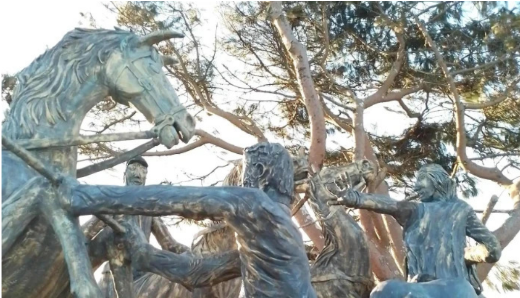
Monumento a la batalla de tupambae comentario 5