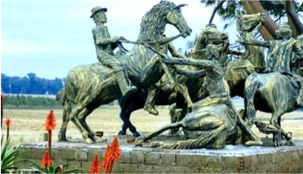
Monumento a la batalla de tupambae comentario 2