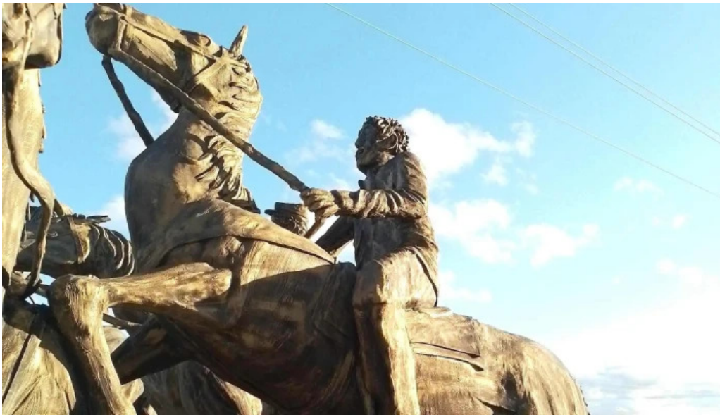
Monumento a la batalla de tupambae comentario 3