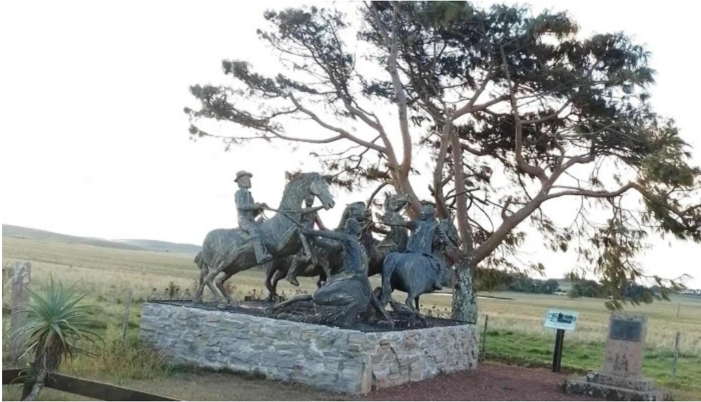
Monumento a la batalla de tupambae comentario 4