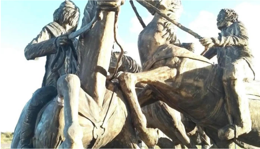
Monumento a la batalla de tupambae todo