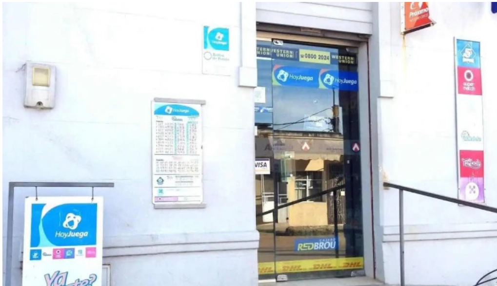
Abitab 1240 exterior