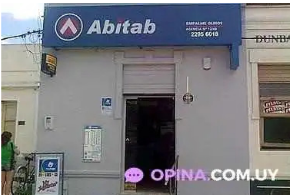
Abitab 12 40 empalme olmos