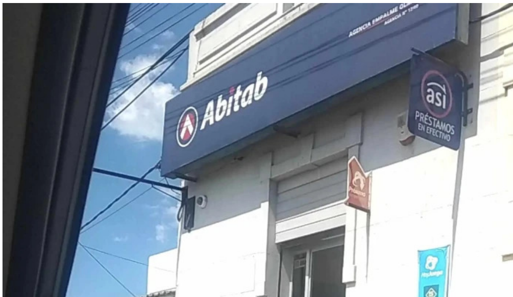
Abitab 1240 empalme olmos