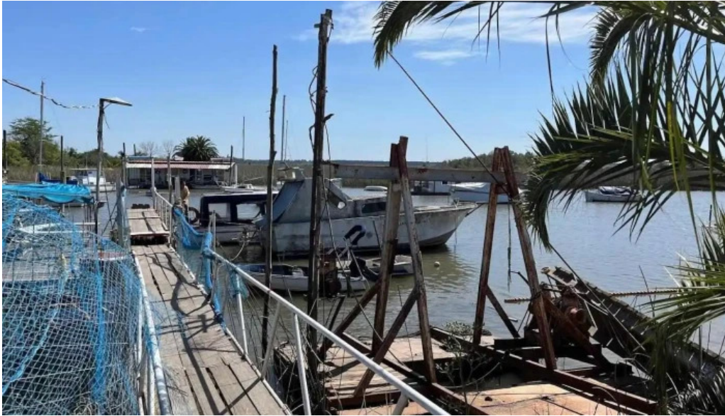
Club aleman de remo montevideo santiago vazquez