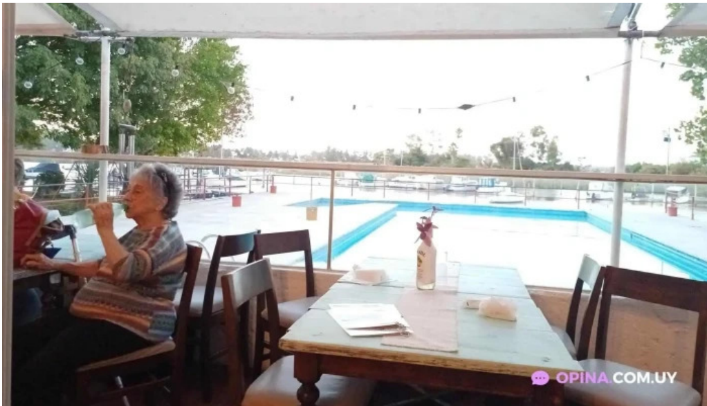
Club aleman de remo montevideo mas recientes