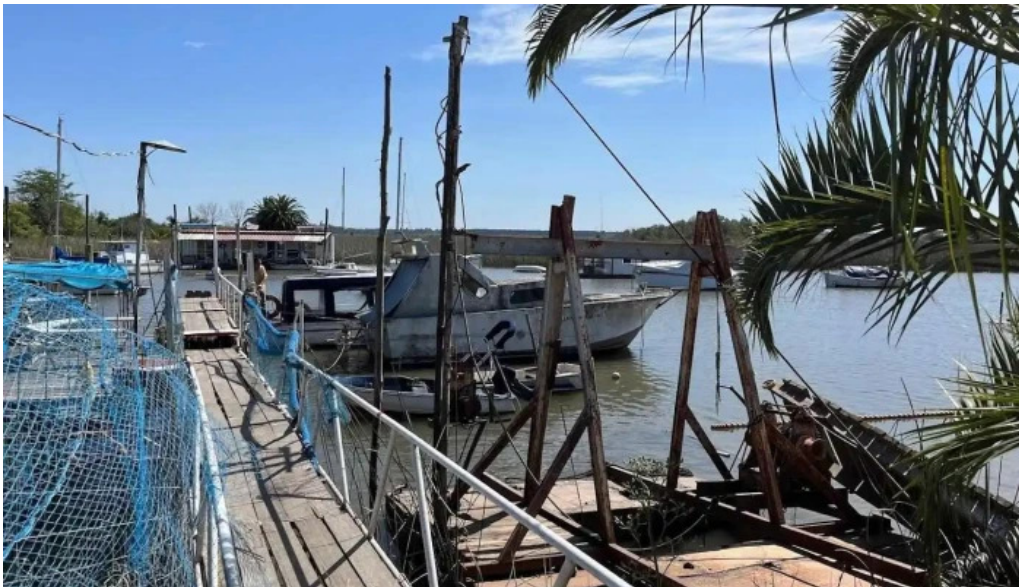
Club aleman de remo montevideo todas