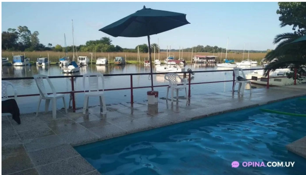
Club aleman de remo montevideo diversion