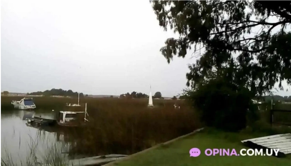
Club aleman de remo montevideo videos