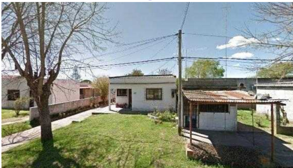
Inmobiliaria ferraro opiniones