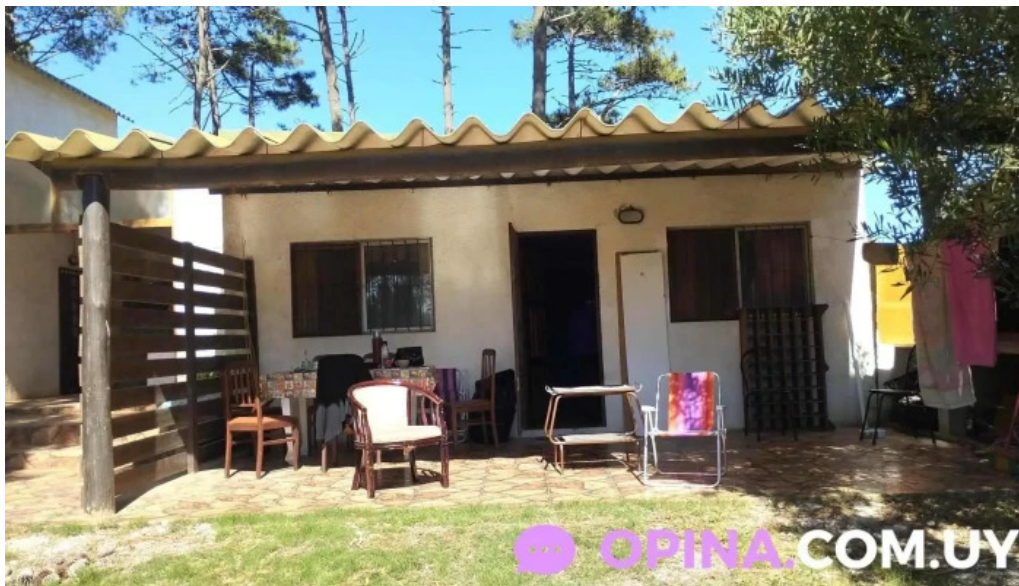
Casa barrio parque la paloma