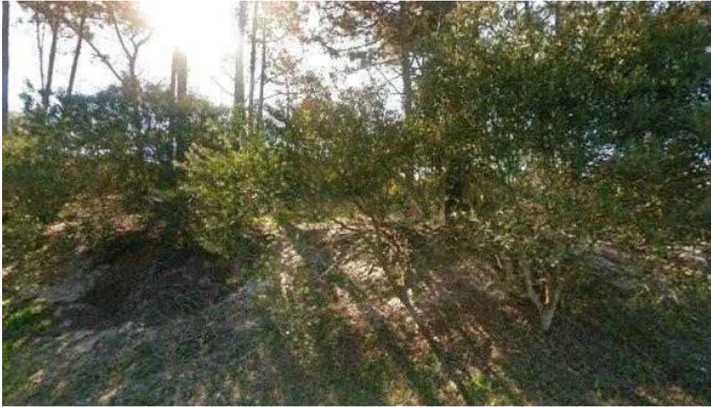
Casa barrio parque opinionesdeg