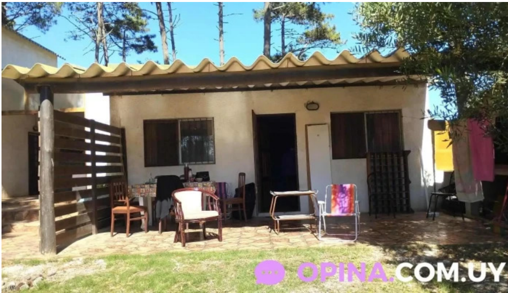
Casa barrio parque opiniones