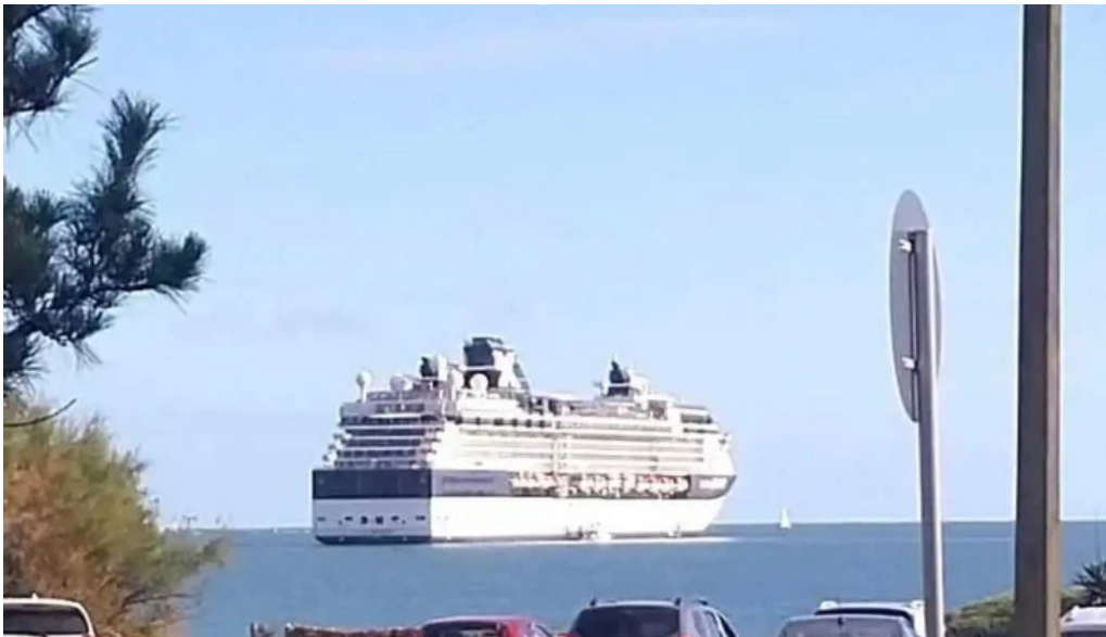
Rincon del diario todas