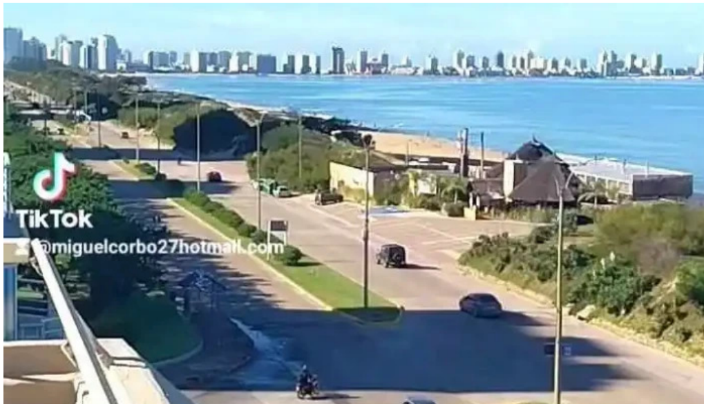
Rincon del diario de los visitantes