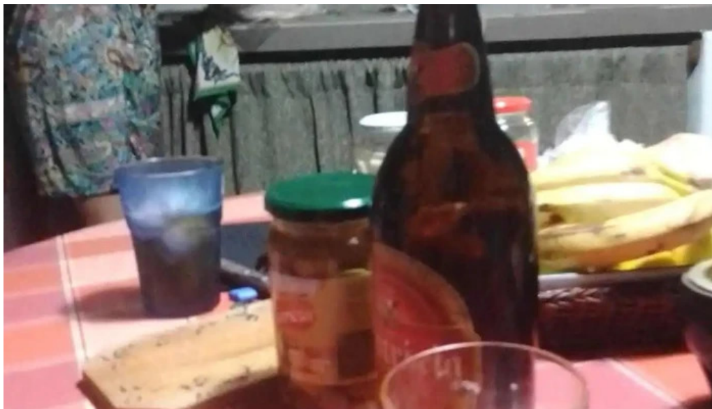
Rincon del diario comida y bebida