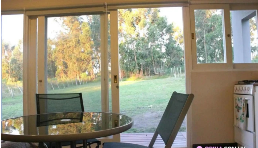
Rincon del diario habitaciones