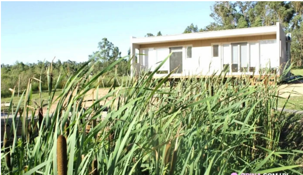
Rincon del diario exterior