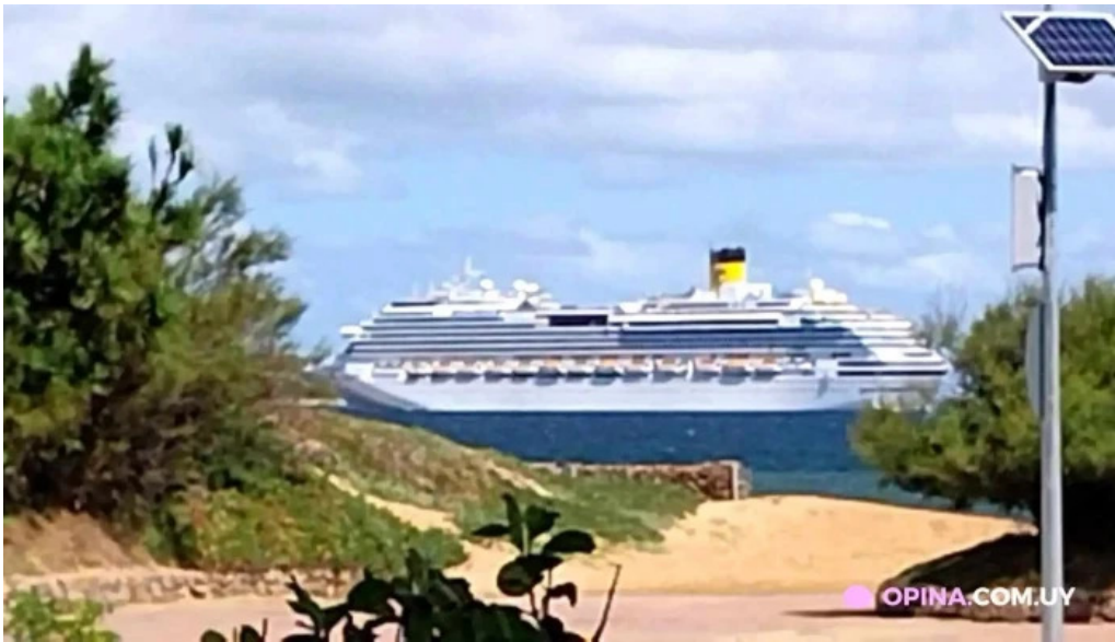
Rincon del diario videos