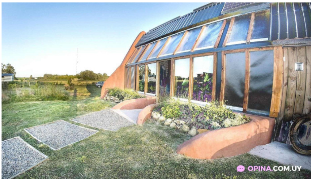
Caliu earthship restaurant y ecolodge col del sacramento