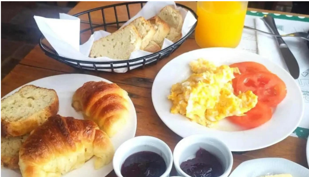
Caliu earthship restaurant y ecolodge comidas y bebidas