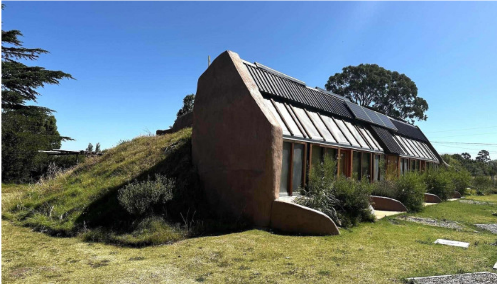
Caliu earthship restaurant y ecolodge de los visitantes