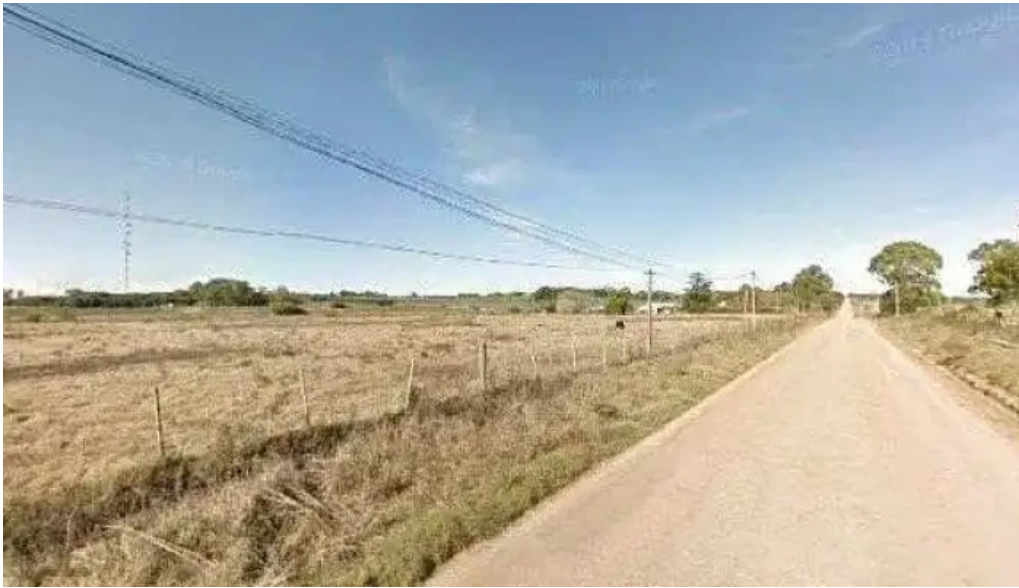
Caliu earthship restaurant y ecolodge street view y 360