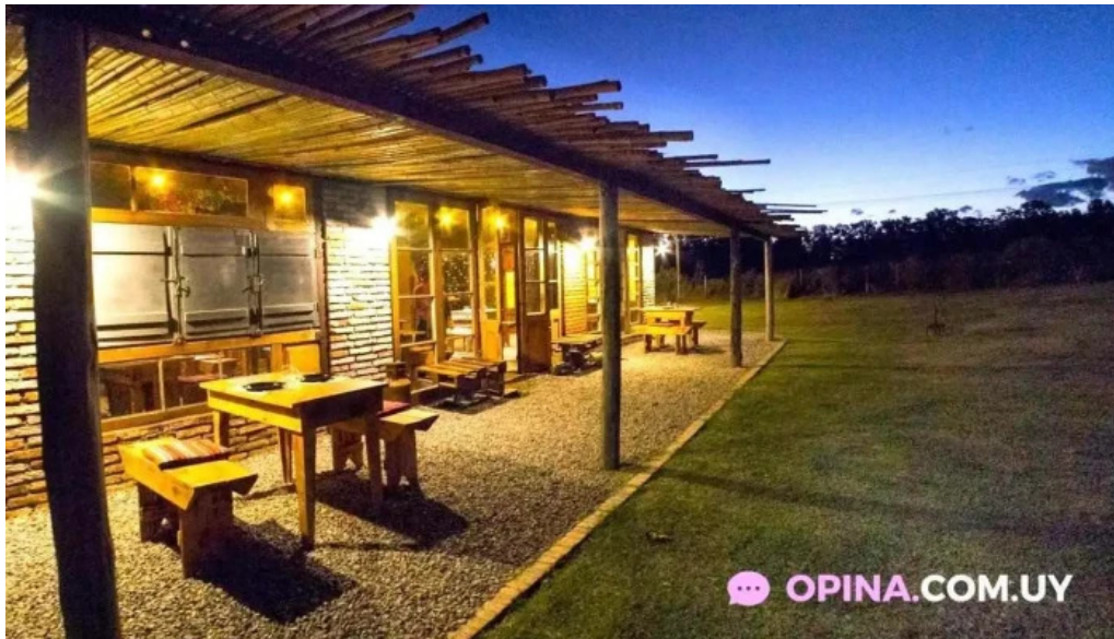
Caliu earthship restaurant y ecolodge exterior