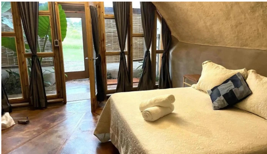
Caliu earthship restaurant y ecolodge habitaciones