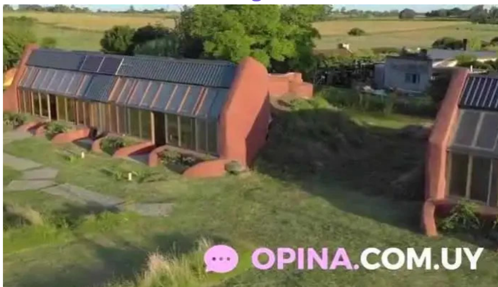
Caliu earthship restaurant y ecolodge videos