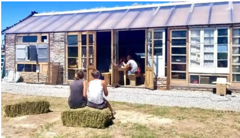
Caliu earthship restaurant y ecolodge del propietario