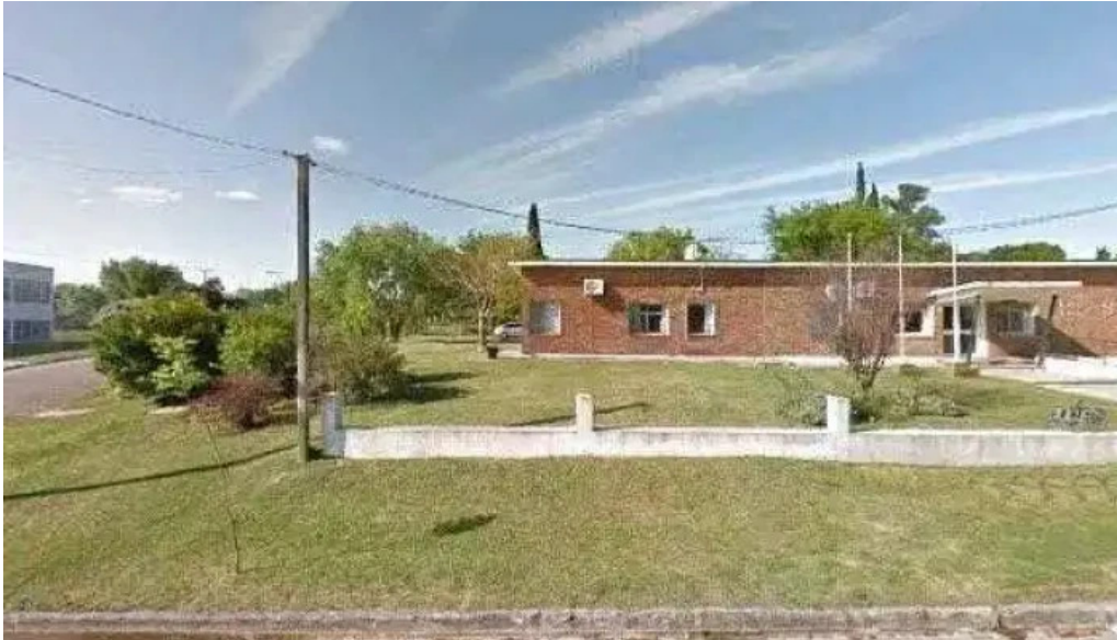
Policlinica tarariras abierto ahora