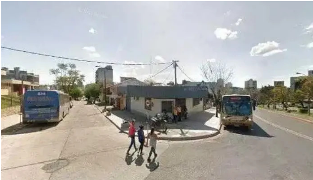
Semeco srl telefonodeg