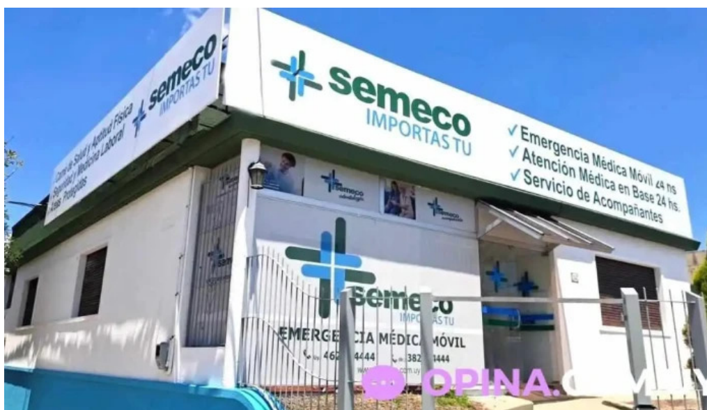
Semeco s r l rivera