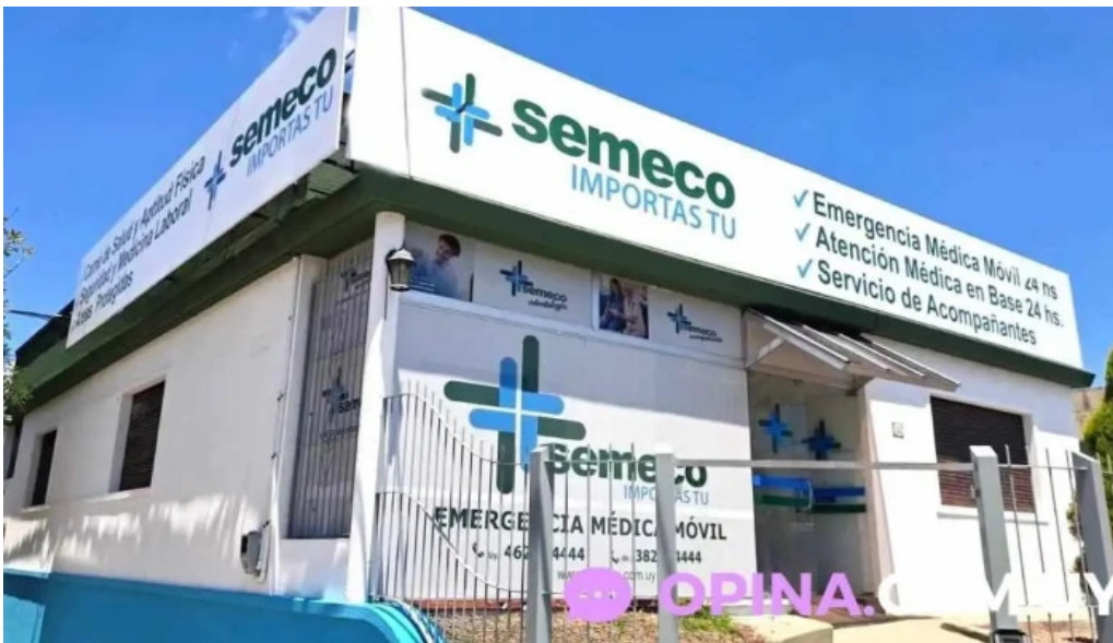
Semeco srl telefono