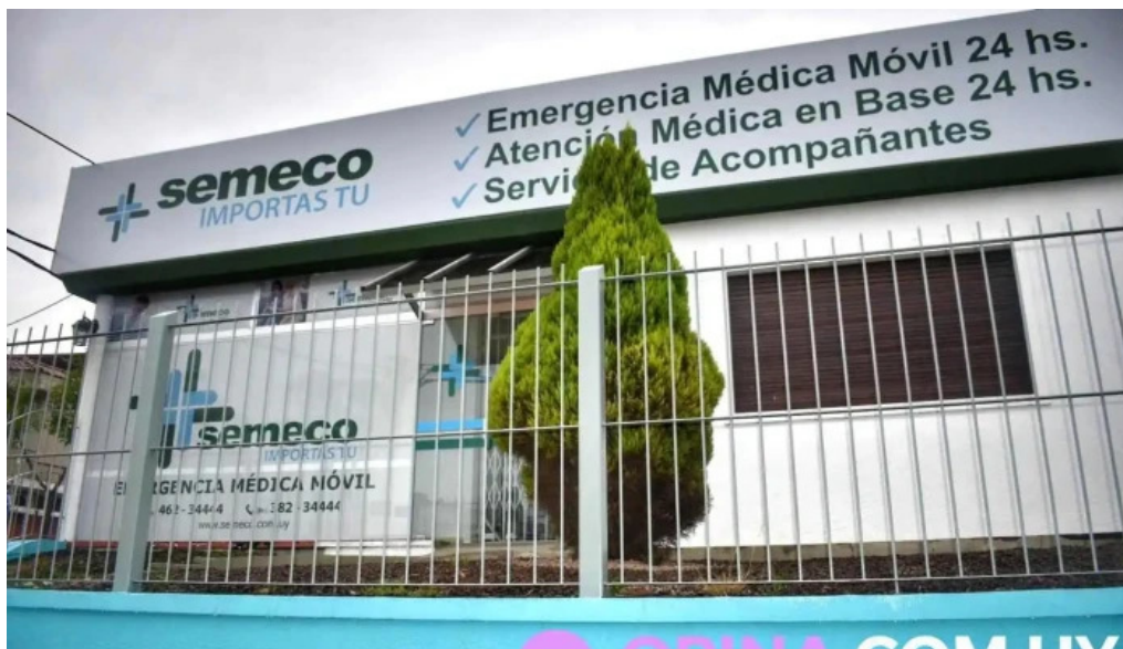
Semeco srl del propietario