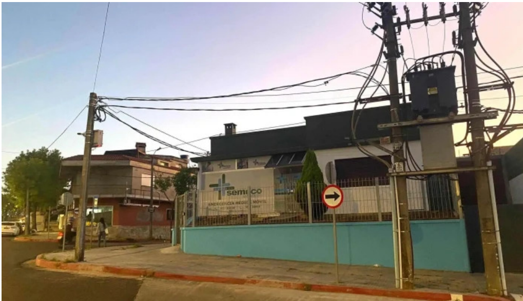
Semeco srl mas recientes