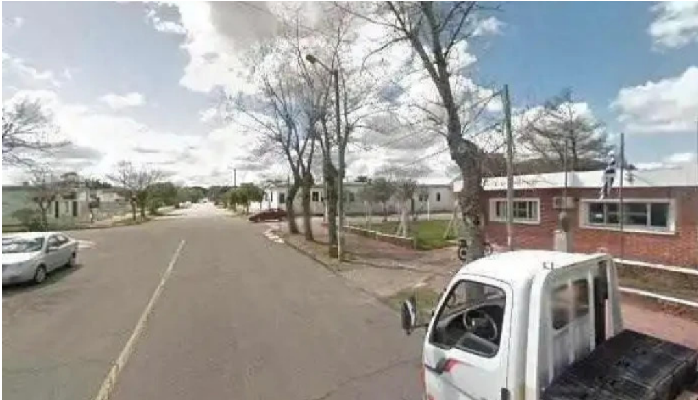
Policlínica asse como Llegardeg