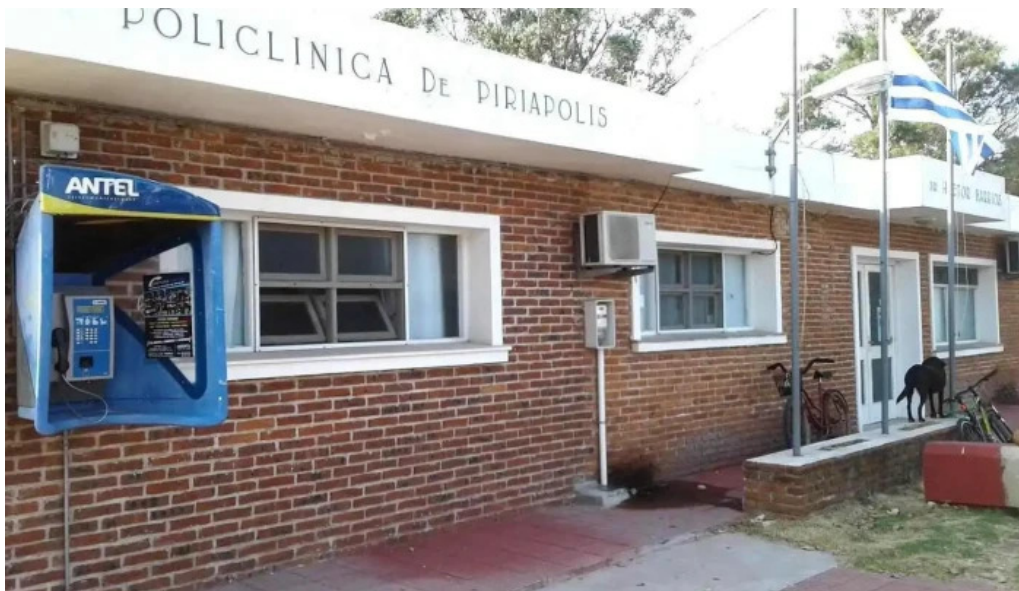
Policlinica asse piriapolis