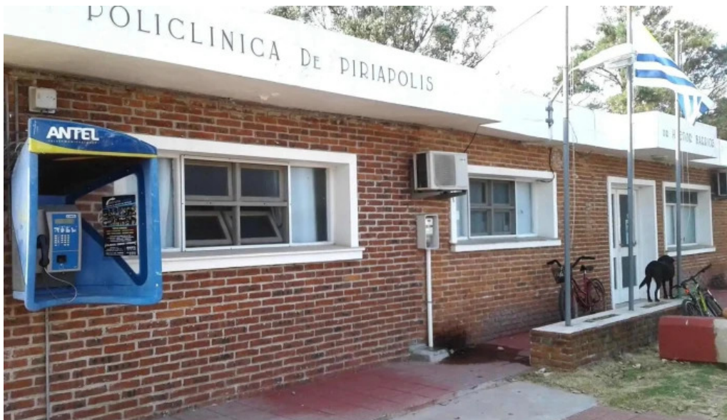
Policlínica asse como llegar