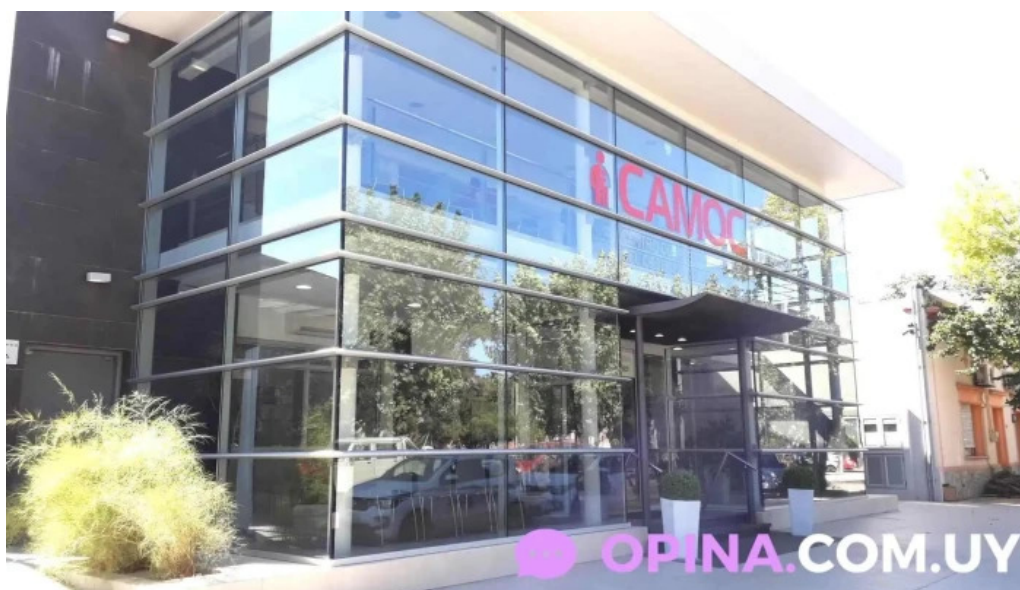
Camoc nueva palmira