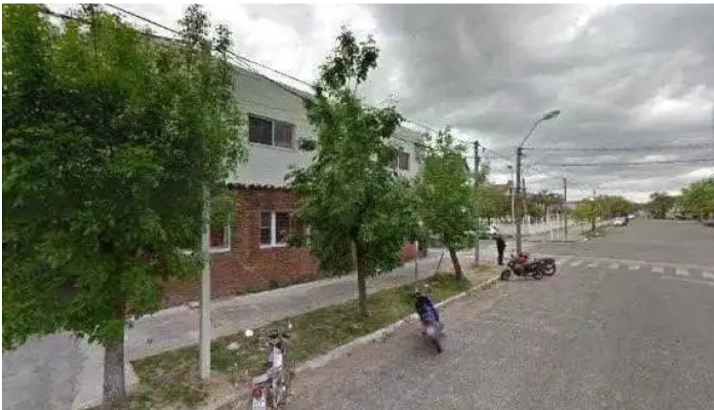
Hospital asse juan lacaze msp videosdeg