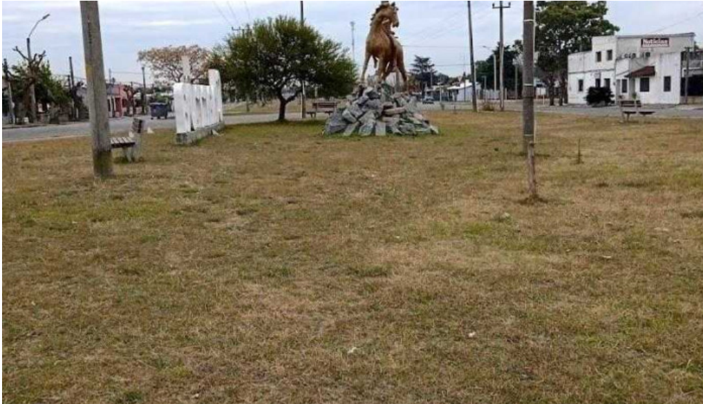
Hospital asse juan lacaze m s p juan l lacaze