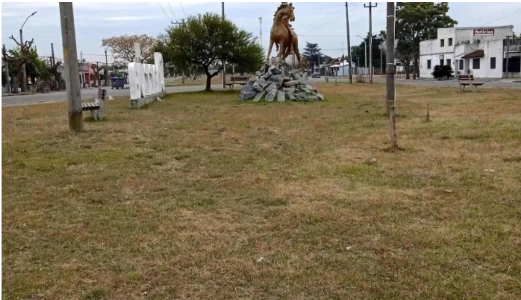
Hospital asse juan lacaze msp videos