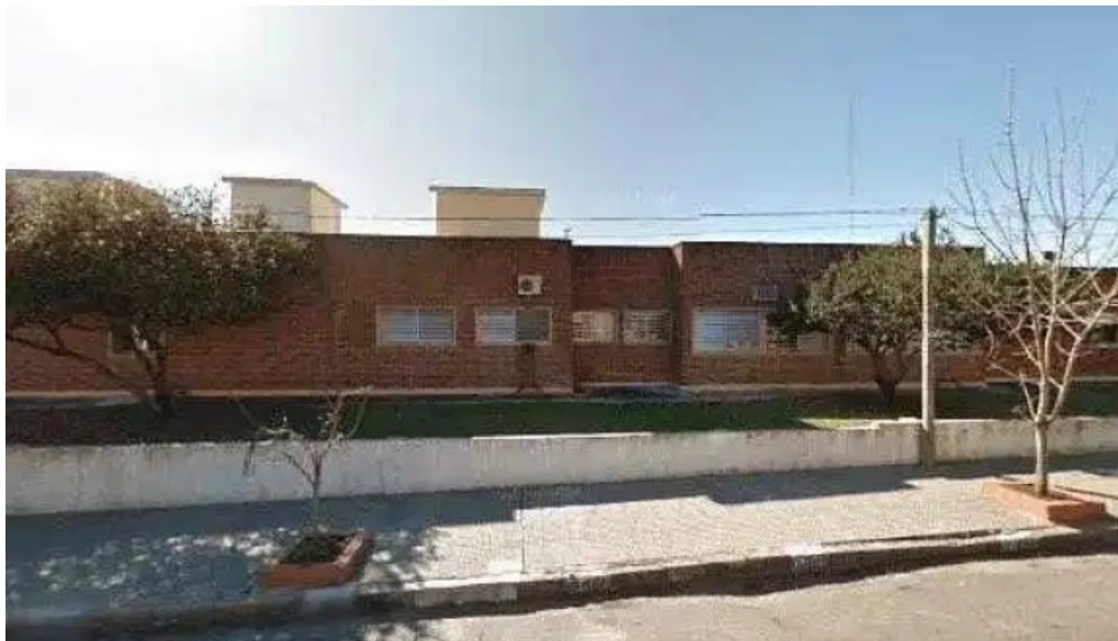
Hospital f telefonodeg