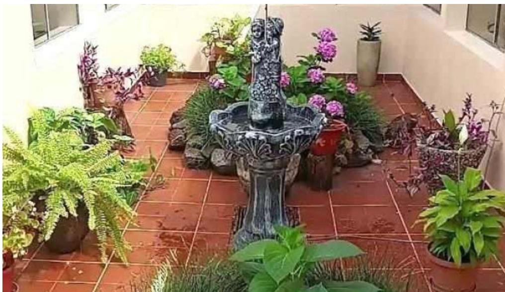
Hospital f fray bentos